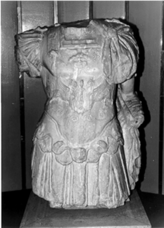
Taf. 6,1) Sousse, Hôtel Hadrumète Place. Torso einer überlebensgroßen Panzerstatue aus Marmor