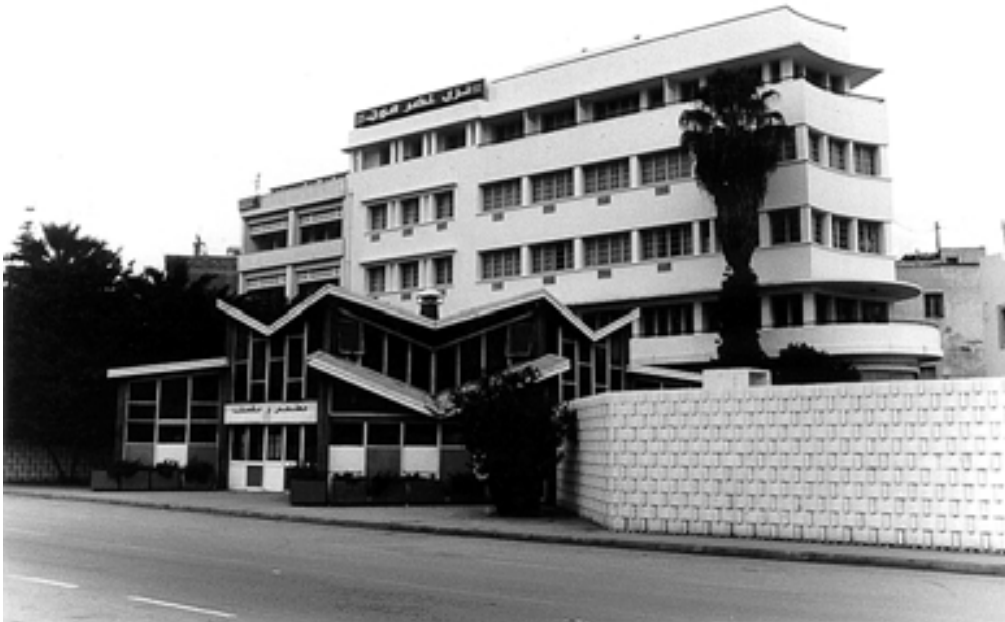
Taf. 5,1) Sousse, Hôtel Hadrumète Place