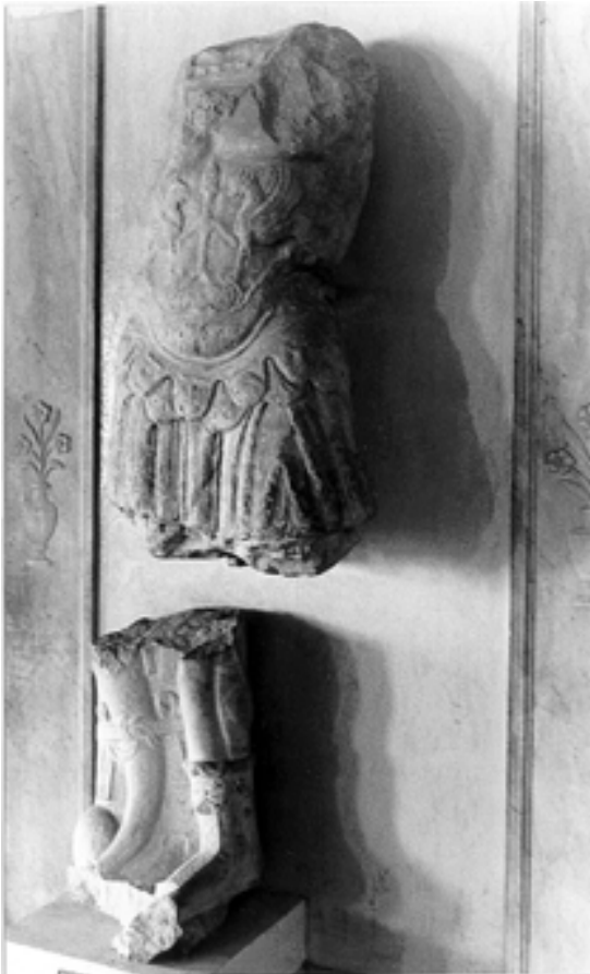
Taf.12,1) Tunis, Bardo-Museum, Inv. Nr. C 20. Panzerstatue aus Khangouet-el-Kedim

Zur Skulpturenausstattung einer Hotellobby in Sousse (Tunesien)