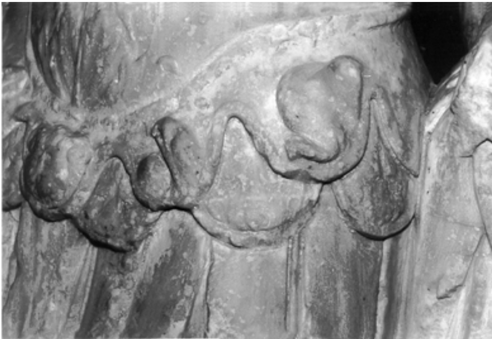
Taf. 7,2) wie Taf. 6,1, Detail