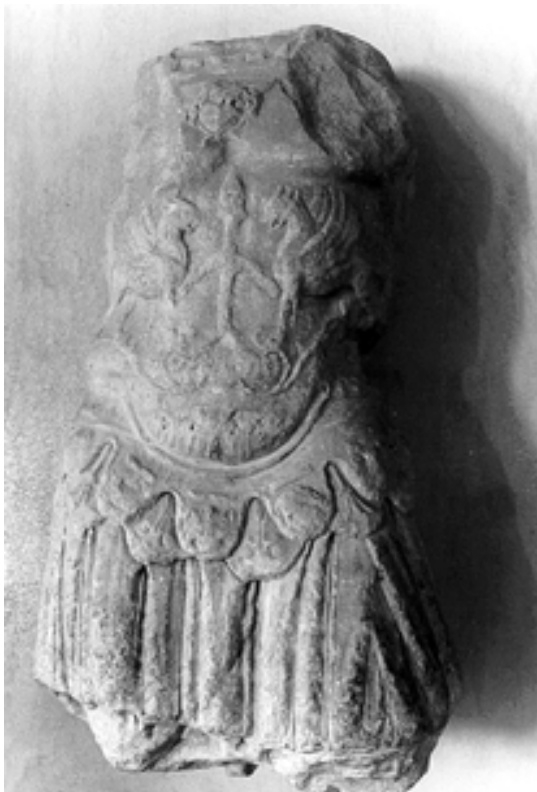
Taf. 12,2) wie Taf. 12,1, Detail