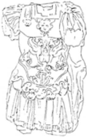
Taf. 8,1) Panzerstatue aus Korbous