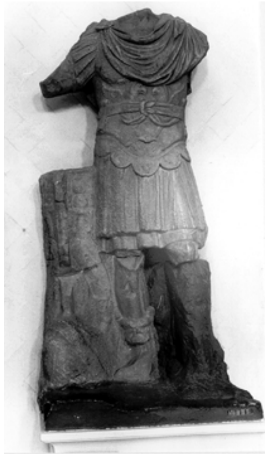
Taf. 9,1) Tunis, Bardo-Museum, Inv. Nr. C 1119. Panzerstatue aus Korbous