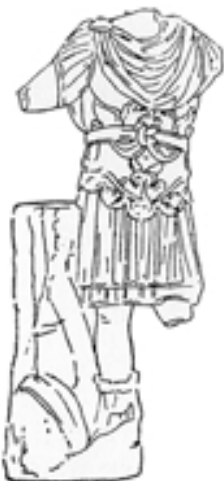
Taf. 8,3) Panzerstatue aus Korbous