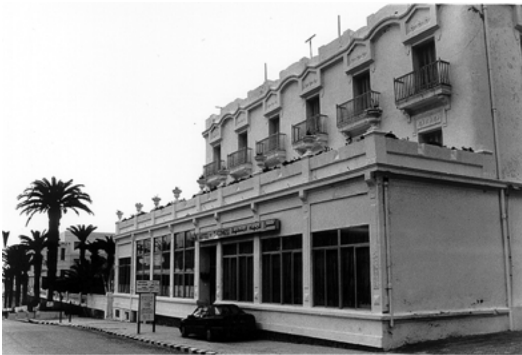
Taf. 10,2) Korbous, Hôtel des Thermes von von Südosten