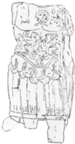
Taf. 8,2) Panzerstatue aus Korbous