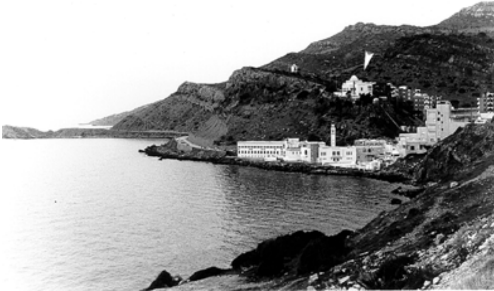
Taf. 10,1) Korbous, Ansicht von Süden