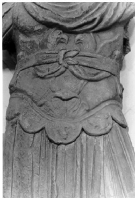
Taf. 9,2) wie Taf. 9,1, Detail