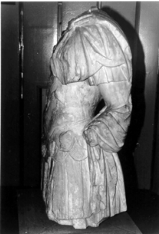
Taf. 6,2) wie Taf. 6,1, Seitenansicht