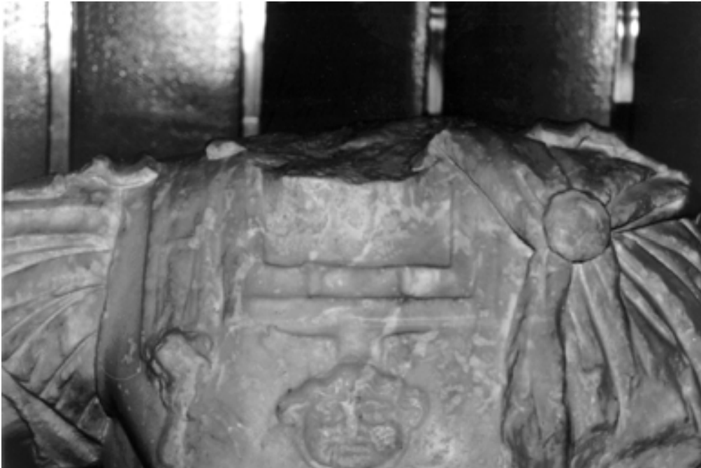
Taf. 7,1) wie Taf. 6,1, Detail