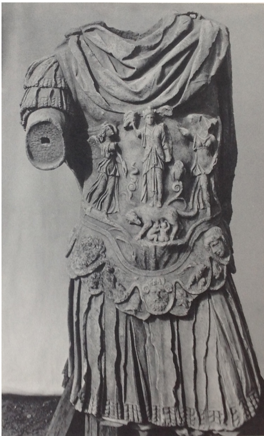
Fig. 2 Statua loricata di Adriano rinvenuta nell'agorà di Atene (da Thompson H.A. – Wycherley R.E., The agora of Athens, the history, shape and uses of an ancient city center [ The Athenian Agora: Results of Excavations Conducted by The American School of Classical Studies at Athens. XIV ], Princeton 1972, Plate 53 b)