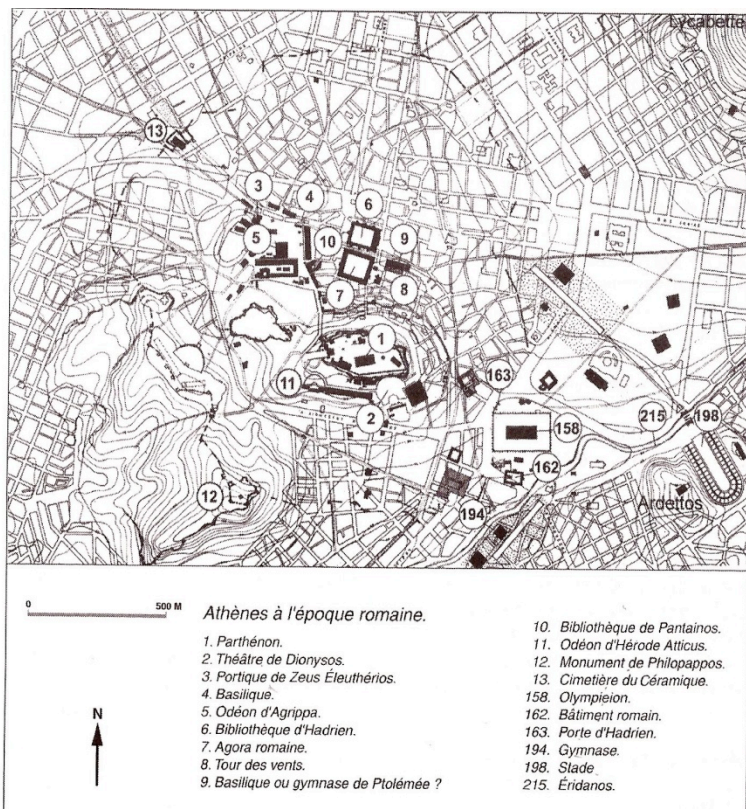
Fig. 5 Atene in età adrianea con il posizionamento degli edifici menzionati (da Étienne R., Athènes, espaces urbains et histoire. Des origines à la fin du III siècle ap. J.-C. , Paris 2004, p. 175)