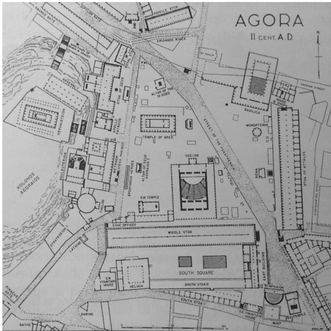
Fig. 1 L'agorà di Atene ai tempi di Pausania (da Torelli M., L'immagine dell'ideologia augustea nell'agorà di Atene , in Ostraka 4,1, 1995, pp. 9-33)