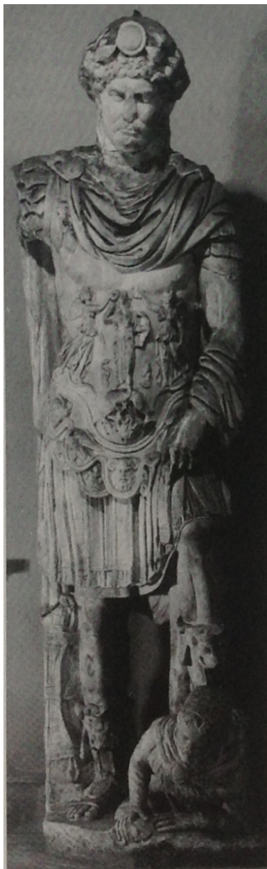
Fig. 6 Statua loricata di Adriano rinvenuta a Hierapytna (da Gergel R.A., Agorà S 166 and related works: the iconography, typology, and interpretation of the eastern hadrianic breastplate type , in A.P. Chapin (ed.), XAPIΣ. Essays in honor of Sara A. Immerwahr ("Hesperia", suppl. 33), Princeton 2004, pp. 371-409)