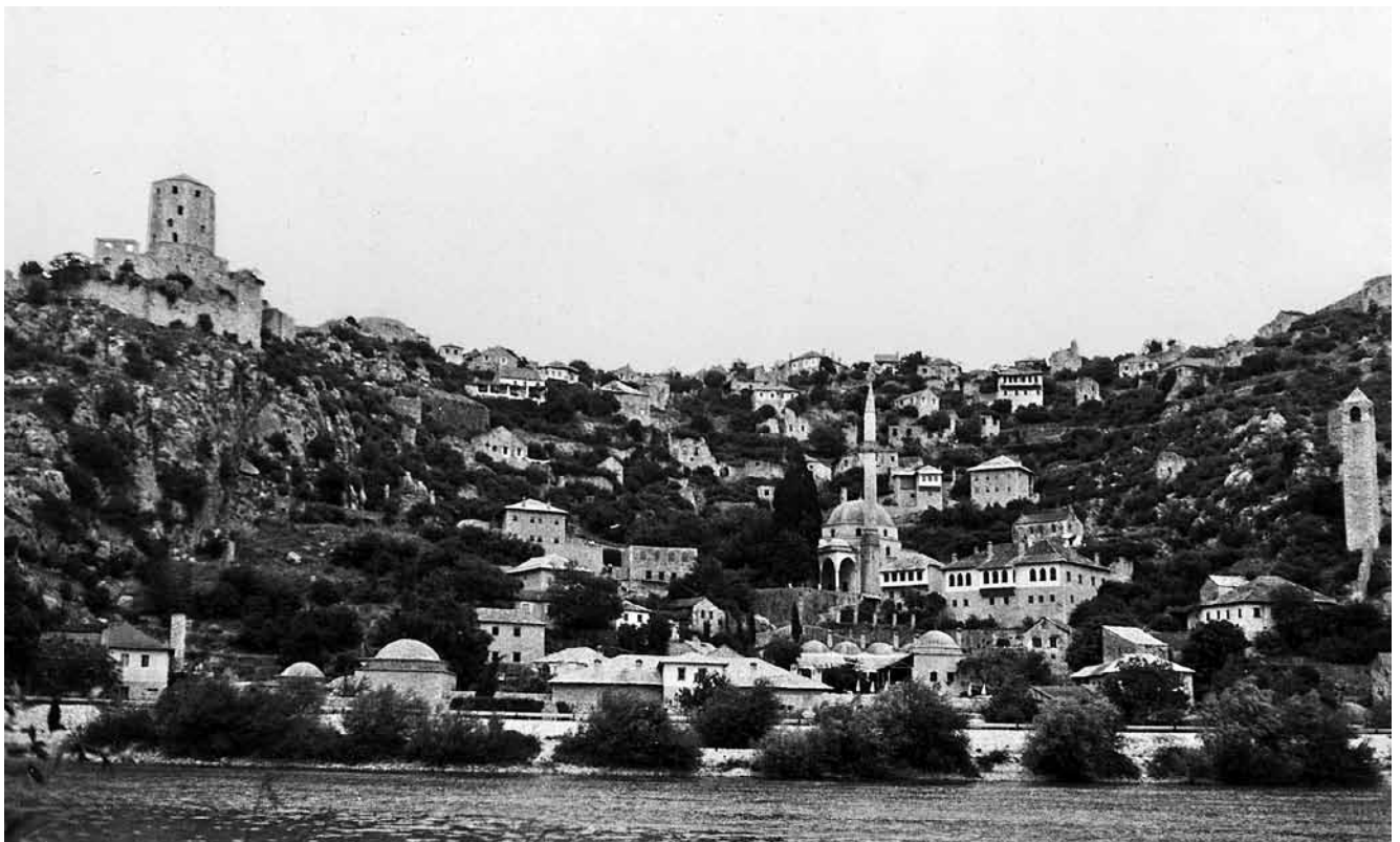
View of Počitelj