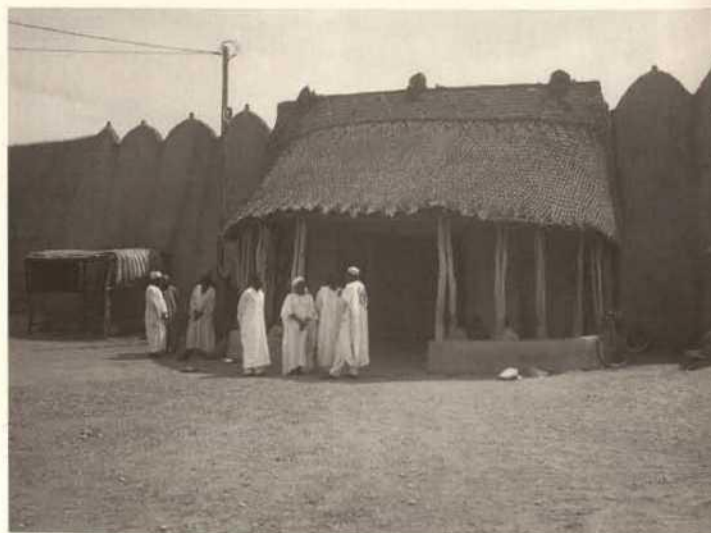
Chefferie de Rey-Bouba, Nord-Cameroun