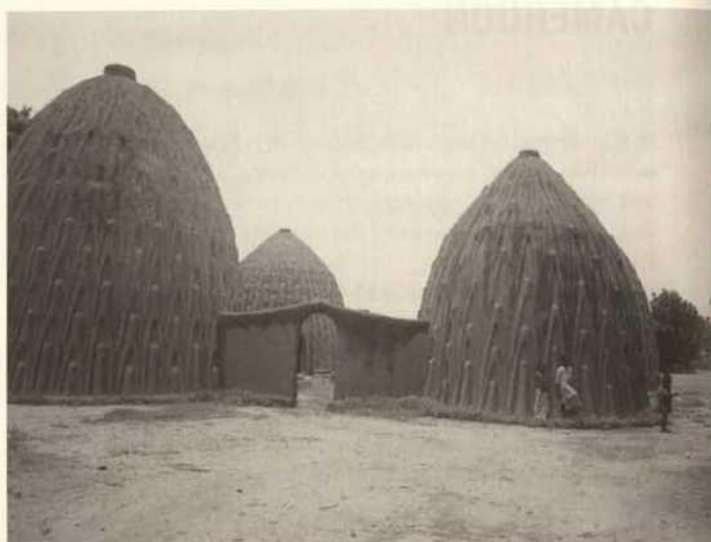
Case Obus de Mousgoum, Nord-Cameroun