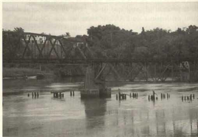
Littoral pont d'Edea