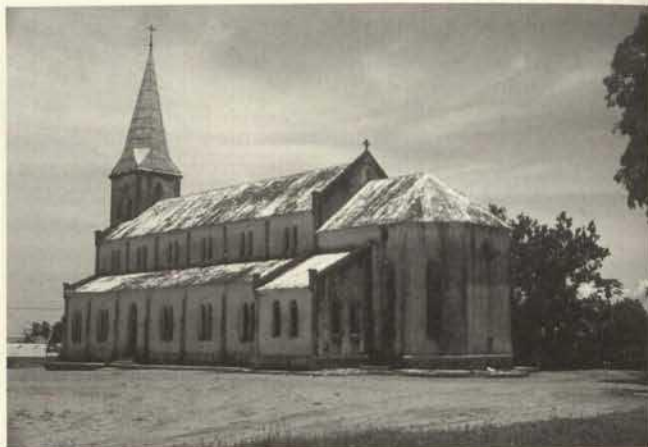
Église allemande à Kribi