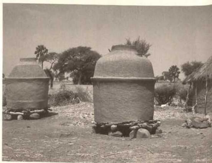
Grenier Amil, Nord-Cameroun