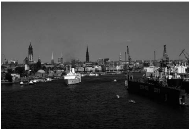
Fig. 3 View of downtown Hamburg from the harbor

Abb. 3 Ansicht der Hamburger Innenstadt vom Hafen aus