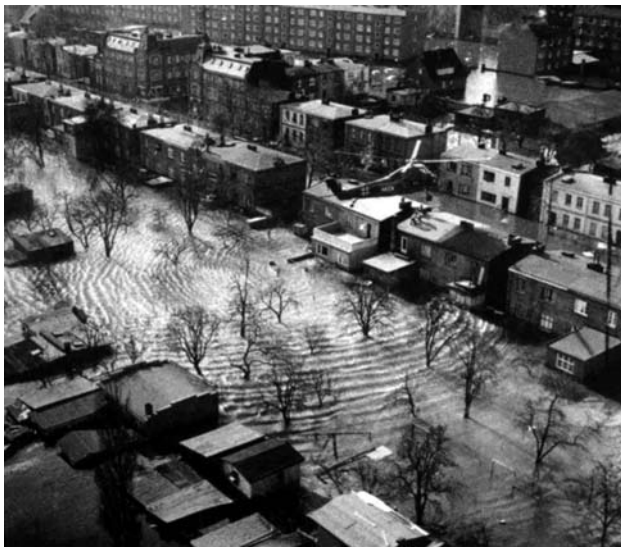
Fig. 1 Elbe River flood in Hamburg in 1962

Abb. 1 Sturmflut der Elbe in Hamburg, 1962