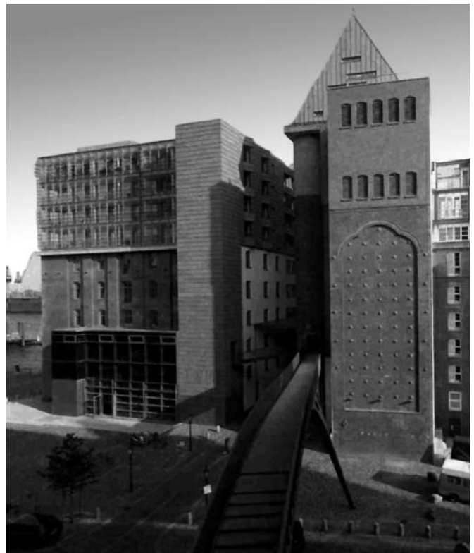
Abb. 8 Hamburg, Stege als hochwassersichere Zugänge am nördlichen Elbufer, Große Elbstraße

Because of modern developments the warehouse district's original use as a place for moving goods cannot be maintained. With this function already partly lost, the warehouse district is increasingly becoming a home for service-oriented offices and cultural institutes. Compatibility with heritage conservation interests is in the foreground for decisions involving future development of this district.