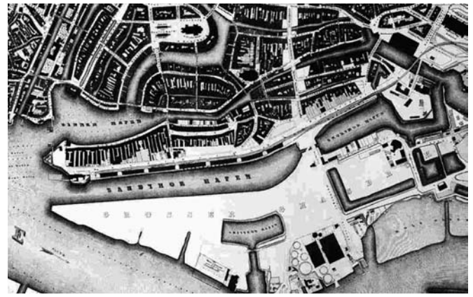
Fig. 4 Plan of the historic Hamburg harbor complex with Sandtorhafen, 1868

Abb. 3 Ansicht der Hamburger Innenstadt vom Hafen aus