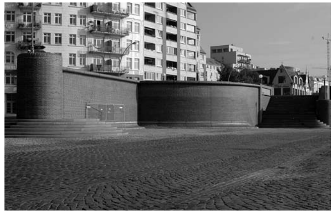
Fig. 2 Flood wall in downtown Hamburg

After studies of storm flood dynamics for the tidal Elbe, a base flood elevation of 7.30 meters was established as the basis for further development of the flood protection system. A construction program to meet these goals was begun in 1993 and largely completed by 2007. Construction of a flood barrier was rejected as a possibility because of the major effects it would have had on the hydrology and ecology of the Elbe, as well as the obstructions it would have caused for ship traffic, technical difficulties in its construction and operation, and, of course, the costs.