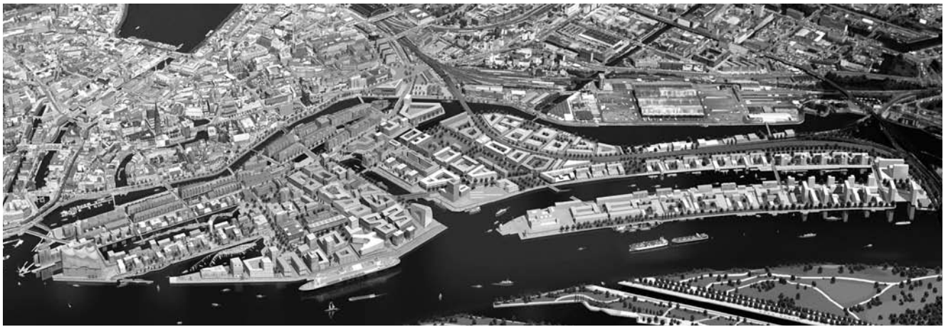
Fig. 6 Overall view of HafenCity in Hamburg