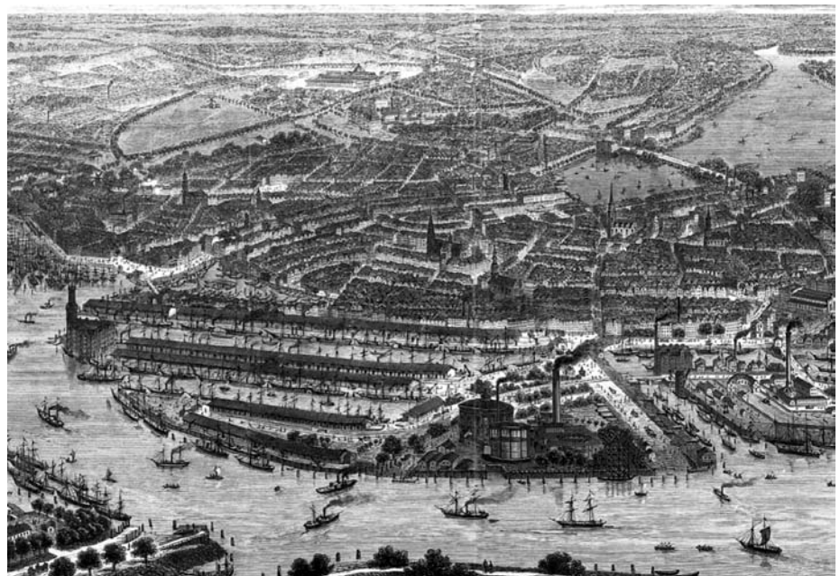
Abb. 5 Historische Ansicht des Hamburger Hafens mit der Speicherstadt, um 1880

as stresses from ships that did not always dock skillfully. The proximity of harbor basin and quay zone also made a direct railroad link possible. Steam-powered portable cranes speeded up loading operations. Sandtor Harbor was developed from 1862 to 1866 and still survives today; Grasbrook Harbor was constructed by 1881. Additional harbor basins were built in the following years.