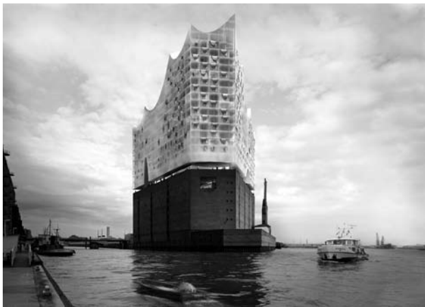
Fig. 7 Hamburg, design for the Elbe Philharmonic Concert Hall in HafenCity

Abb. 7 Hamburg, Plan für eine Elbphilharmonie in der HafenCity