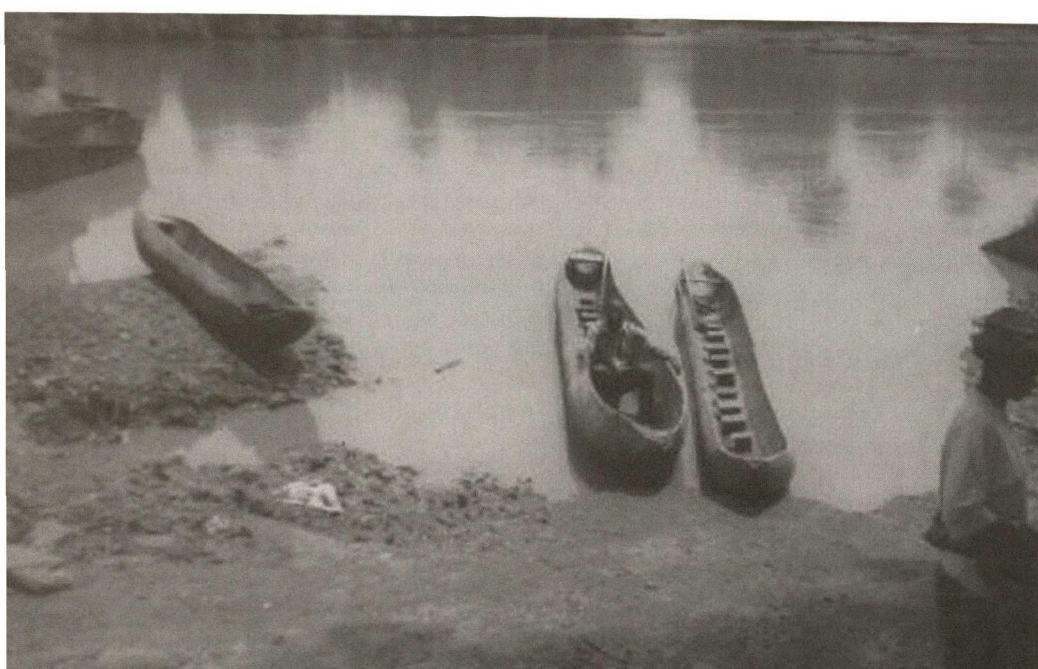
Landing place for the transport of slaves Débarcadère pour le transfert des esclaves

Le Comité a choisi de dédier le rapport à l'«Année internationale (2004) de commémoration de la lutte contre l'esclavage et de son abolition», proclamée par l'ONU et organisée par l'UNESCO. Cette option se justifie quand on sait la présence en Guinée de sites et monuments des plus significatifs de la région africaine, cependant peu ou mal connus, se rapportant au phénomène de l'esclavage.