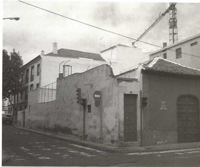
Capilla de la Cruz de los Plateros, C/San Juan (10-03-2002), Antes de modificación de la manzana en el ámbito del Bien Cultural.

The Plan permits certain alignments and changes in ground levels and, above all, a grave alteration in the historic lot division of La Laguna by means of a complex system based on unacceptable criteria which would permit aggregations of lots and, more importantly, segregations of lots in practically all blocks of the historic city. The team drafting the Special Plan aims for their ideal lot division to prevail over the currently existing lot division, which is the one that is actually obligatory to protect.