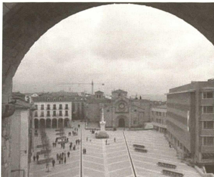
Avila, Plaza de Santa Teresa (Mercado Grande), seen from the town wall