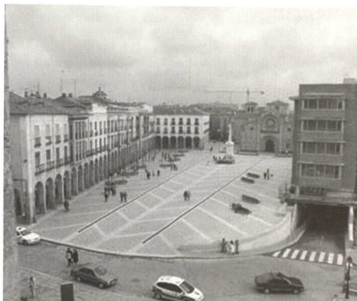
Avila, Plaza de Santa Teresa (Mercado Grande), on the right new building 'A' with entrance to the parking area