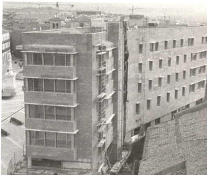
Avila, building 'A' by Rafael Moneo, rear side