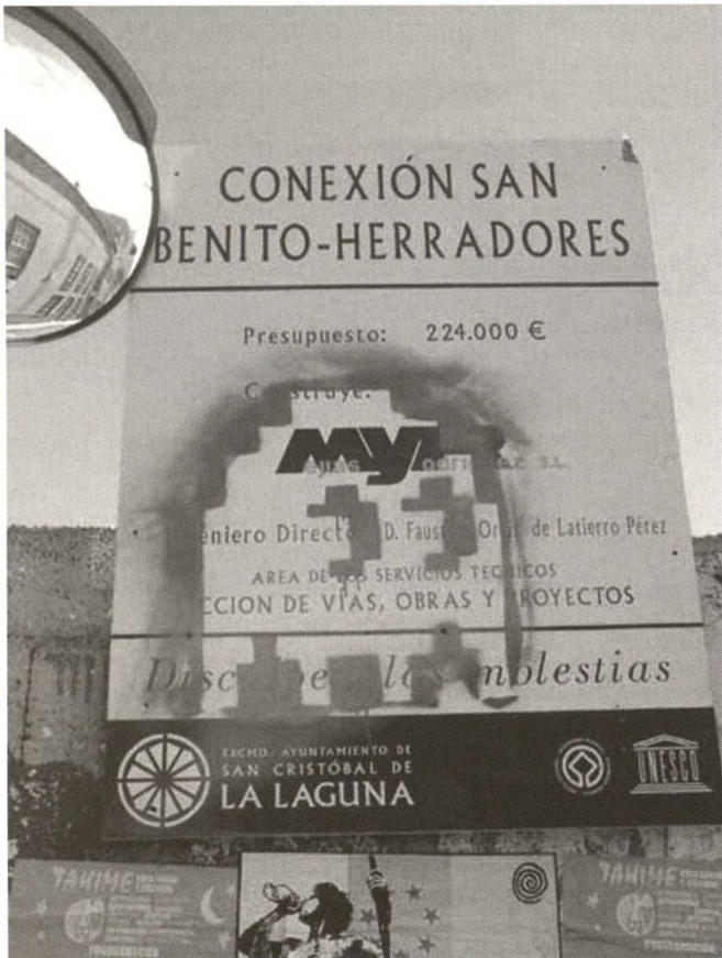
Modificación de alineación prevista en PEP y ya aprobada por el Cabildo Insular, C/San Antonio, Cartel anunciador del Ayuntamiento (julio 2004).

Dstrucción de galería y eliminación de patio del Colegio de los Jesuitas (después Universidad de San Fernando, hoy Real Sociedad Económica de Amigos del País (16-09-2004).