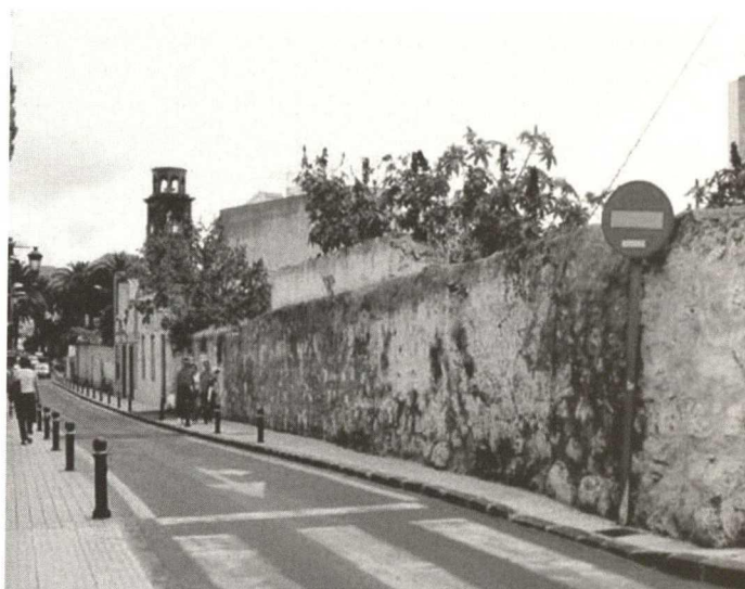
Modificación de alineación prevista en PEP y ya aprobada por el Cabildo Insular, C/San Antonio, Situación actual (julio 2004).

El plan permite alterar algunas alineaciones, rasantes y, sobre todo, admite una grave alteración del parcelario histórico de La Laguna mediante un sistema complejo y con criterios inadmisibles que permitirían las agregaciones – sobre todo-y-también – las segregaciones en prácticamente todas las manzanas de la ciudad histórica. Se pretende que el parcelario ideal del equipo redactor del Plan Especial prevalezca sobre el parcelario real, que no es otro que el que realmente es obligado proteger.