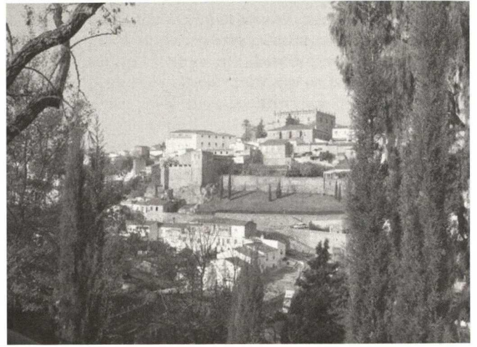
Ribera del Marco, Cáceres, with the World Heritage Old City in the background

water courses and overflow channels at the side, reducing the amount of space for pedestrians, playing fields and tourist routes.