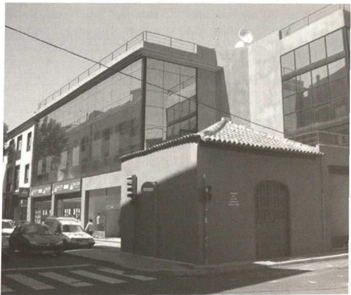
Capilla de la Cruz de los Plateros, C/San Juan (03-11-2002), Modificación de la manzana en el ámbito del Bien Cultural.