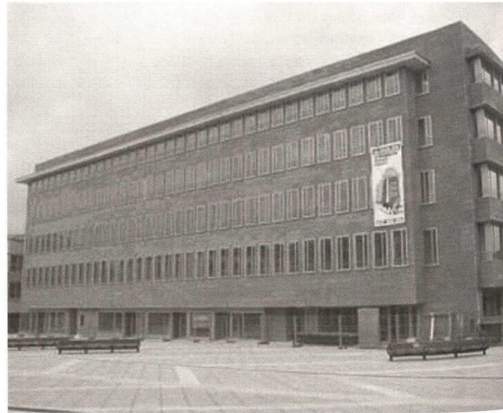
Avila, building 'A' by Rafael Moneo, front