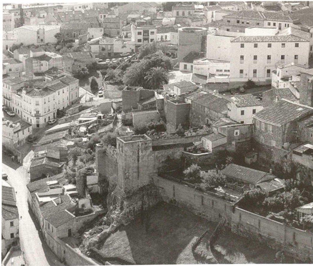
Aerial view of the eastern edge of the Historic-artistic Town Complex, closely associated with the Almohad fortification which delimits the intramural area of the Old City of Cáceres (World Heritage, 1986), in the urban sector of Ribera del Marco. The intention of the Ronda Este Interior project, as conceived by the municipal government, is based on the destructive cutting of this medieval ring-road by a ten metre wide road. This breaks into the historic town-complex and takes land at the perimeter, demolishing the small modest dwellings at the edge, under environmental protection, and risks the precarious stability of the 12 th century Almohad outer wall and the olive grove of the old Jewish quarter. It also destroys the necessary surrounding protection area of the Ribera del Marco with a highly polluting traffic route.

Que el Ayuntamiento de Cáceres, haciendo caso omiso a las determinaciones anteriores, decide en el marco de revisión del vigente Plan General de Ordenación Urbana, introducir el Proyecto de Ronda Este Interior, un vial de 10 metros de anchura y alta capacidad de tráfico para la canalización del flujo de vehículos (15.000 veh./día), entre el oeste y este de la ciudad por el fondo de la fosa tectónica de la Ribera del Marco (Fuente Concejo-Mira