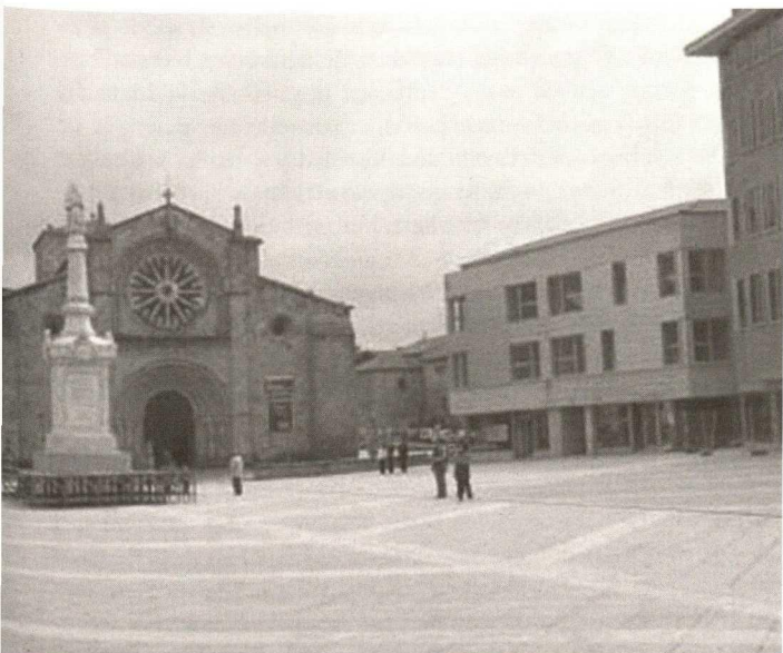
Avila Plaza de Santa Teresa (Mercado Grande), San Pedro and building ‘B’

Refiriéndose a las ciudades históricas, las Directrices agregan que, a causa de la fragilidad del tejido urbano y de la urbanización galopante de las periferias, no podrán considerarse solamente desde un punto de vista abstracto en función del papel que puedan haber desempeñado en el pasado o como símbolos históricos. La organización del espacio, la estructura, los materiales, las formas