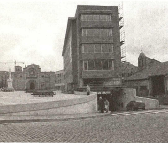
Avila, Plaza de Santa Teresa (Mercado Grande), on the right new building 'A' with entrance to the parking area