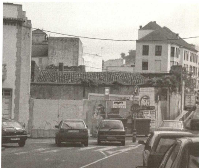
Modificación de alineación prevista en PEP y ya aprobada por el Cabildo Insular, C/San Antonio (julio 2004), Vista desde la Plaza de la Concepción (Plaza del Dr. Olivera).

Propuesta de proyecto-tipo según el PEP, C/Herradores (19-03-2004).