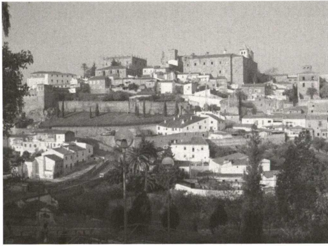
Ribera del Marco, Cáceres, with the World Heritage Old City in the background