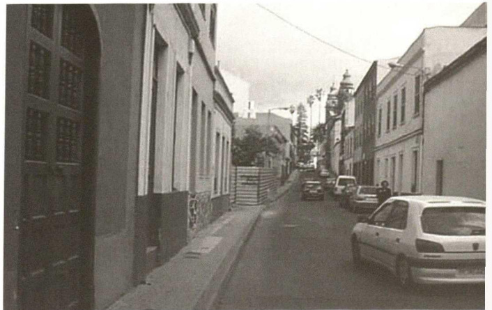
Calle de San Juan (10-03-2002), Antes de modificación de la manzana en el ámbito del Bien Cultural.