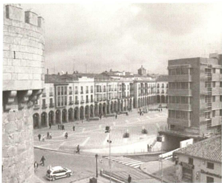
Avila, Plaza de Santa Teresa (Mercado Grande), on the right new building 'A' with entrance to the parking area