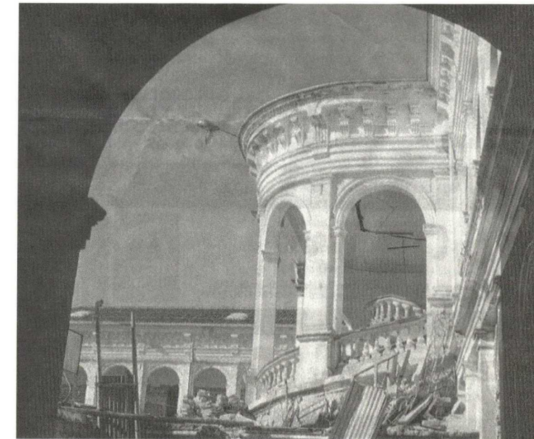
Femenino Espejo College, a work of Neoclassical Architecture Colegio Femenino Espejo, obra de arquitectura Neoclásica