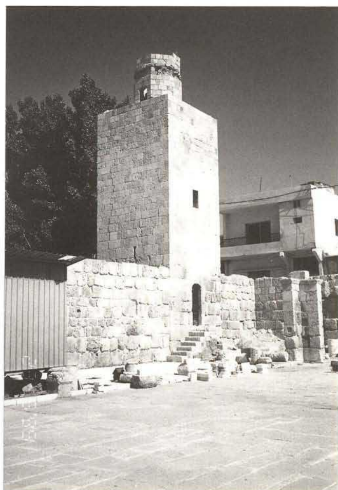
Baalbeck Great Mosque: minaret after restoration work