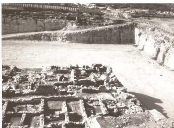
Beirut, downtown excavations

des villages situés sur le pourtour de la vallée. Une étude visant à résoudre ce problème a déjà été réalisée, cependant les fonds ne sont pas disponibles.