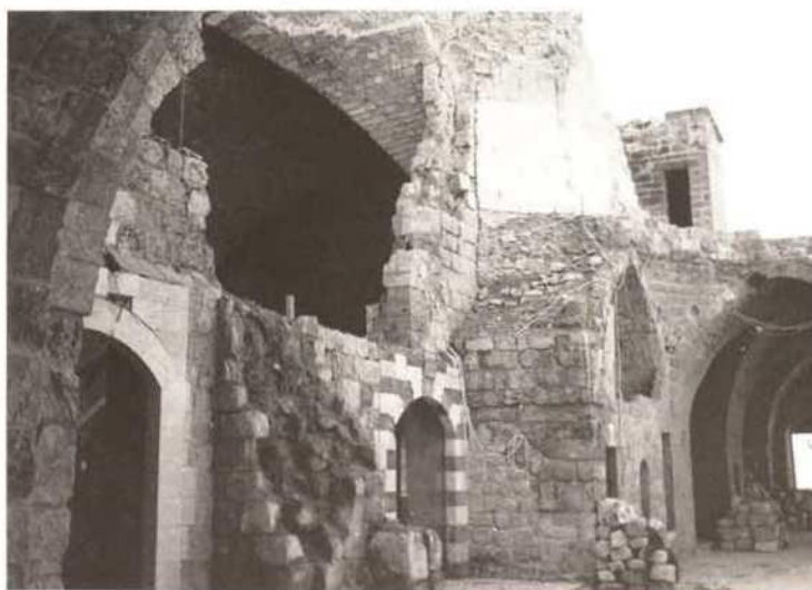
Sidon, Great Omari Mosque, destroyed by war