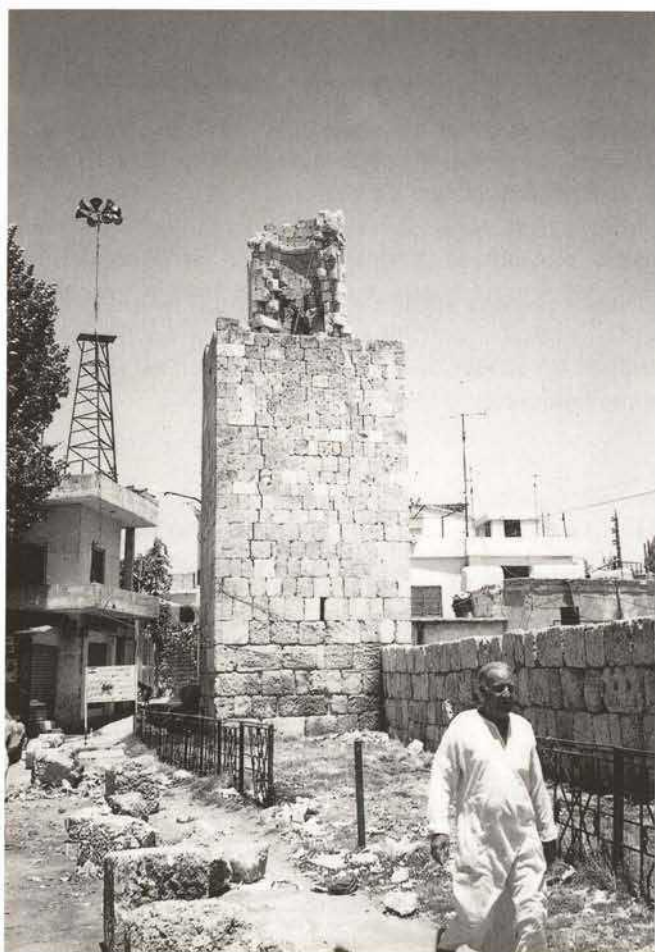
Baalbeck Great Mosque: earthquakes destroyed the upper octagonal parts of the minaret