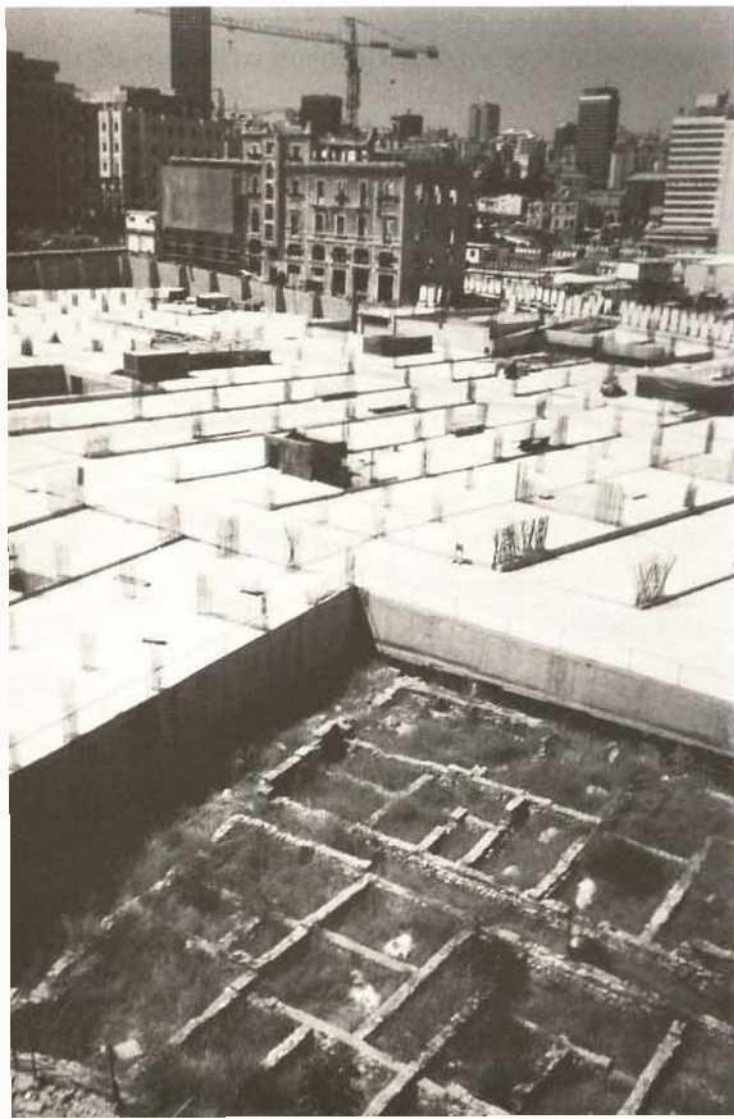
Former Beirut Souq

The South of Lebanon has been a conflict zone for two decades. Since the declaration of peace and the end to hostilities, this region is in urgent need to be cleared of mines. It is a fact that several sites have been submitted to bombardment and massive destruction (Chateau Beaufort), and that others of them have been the object of unauthorised excavation and pillaging. It only remains that the majority of sites have been transformed into minefields.