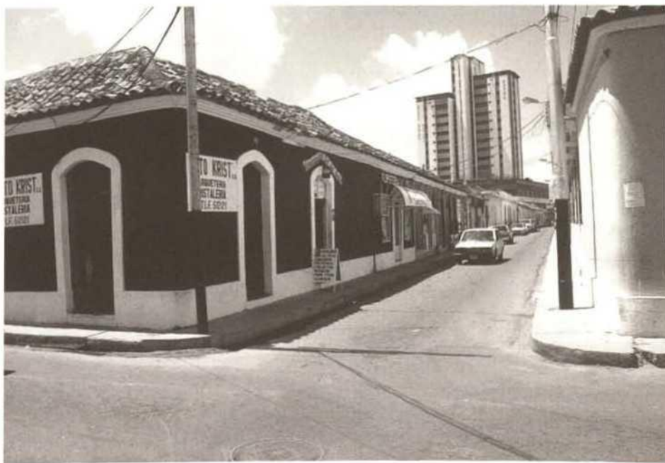
Coro, new buildings endanger the historic structure

Por otra parte, las amenazas por agentes naturales que se ciernen sobre su arquitectura de tierra, se inician con la humedad, a la que contribuye la ausencia de un sistema de drenaje urbano eficiente. Esto favorece el desarrollo de colonias de termitas y el movimiento de las arcillas expansivas de los suelos, que producen más deterioro. La inclusión de la Iglesia de San Francisco en la lista de "100 most endangered sites" del "World Monument Watch", en sus ediciones de 1998-99 y 2000-2001 demuestra la gravedad de la situación. La Arquidiócesis de Coro, quien financia parcialmente el proyecto de restauración de este templo, no cuenta con adecuados recursos para la ejecución de las obras.