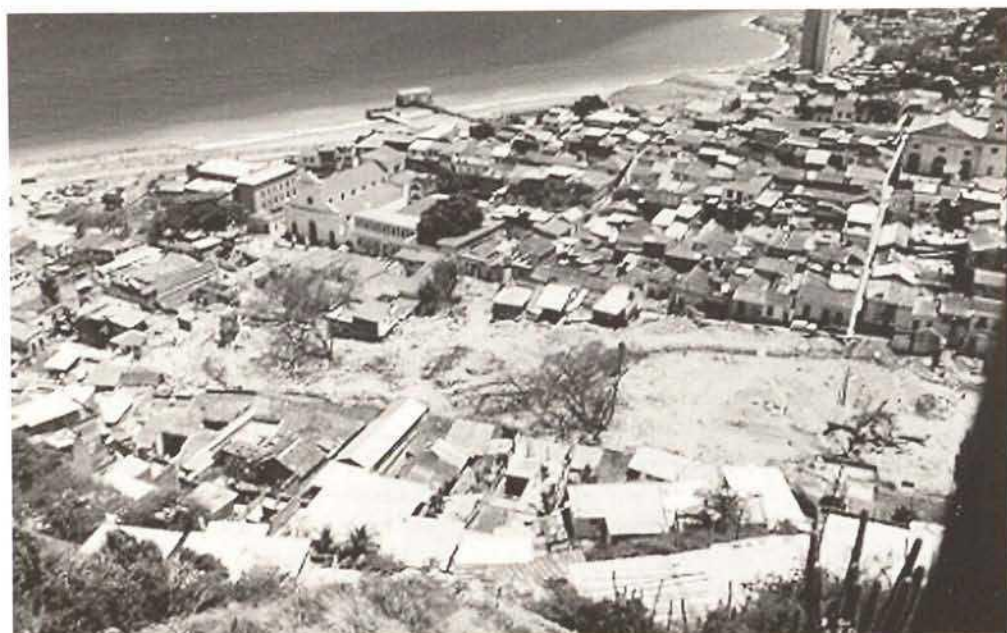
La Guaira and Macuto after the disaster. Following an unusual period of non-stop rain floods and landslides the historic centre of La Guaira and the town of Macuto were buried in December 1999 under layers of mud