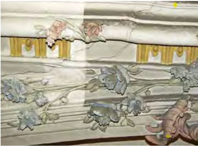
Abb. 9: Detail der barocken Stuckierung aus der Kirche St. Martin in Erbach mit Reinigungsprobe