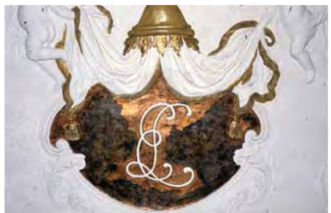
Abb. 5: Detail der Stuckdecke von 1705 im Forstamt von Stockach