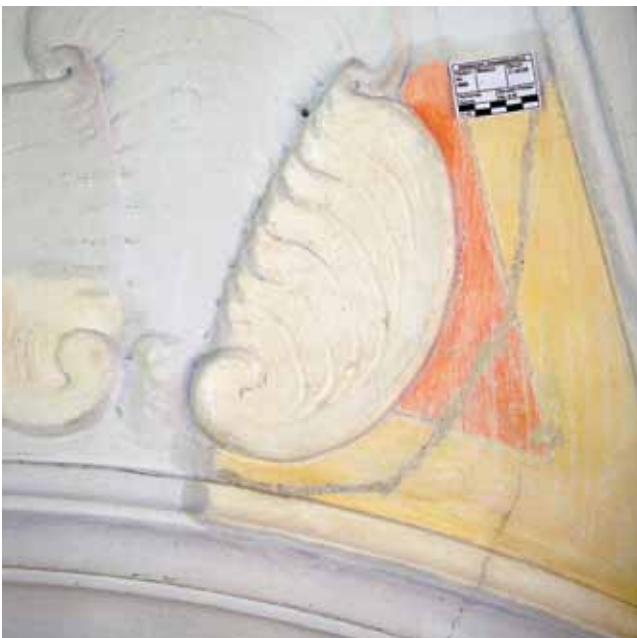
Abb. 10: Detail der Stuckierung von 1736 in der Johanneskapelle in Ummendorf mit Freilegungsprobe

und gefasste Raumschale in die Hand des für Stuck spezialisierten Restaurators gehört. Diese Anforderung hat sich im Sakralbau oder musealen Profanbau bereits fast überall durchgesetzt. Anders verhält es sich dagegen beim nicht-musealen Profanbau. Die Arbeiten an stuckierten Decken und Wänden werden hier vielfach an Handwerksbetriebe vergeben, die mit den Anforderungen einer Stuckrestaurierung überfordert sind oder diese nicht kennen. Auch die Wünsche des Bauherrn können dazu führen, dass neben notwendigen Erhaltungsmaßnahmen noch unnötige Sicherungs- und Freilegungsmaßnahmen ausgeführt werden. Dies geschieht vielfach in der Unkenntnis darüber, was notwendig ist und was nicht und leider werden diese Maßnahmen oft durch Architekten und Denkmalpfleger noch gebilligt statt verhindert.