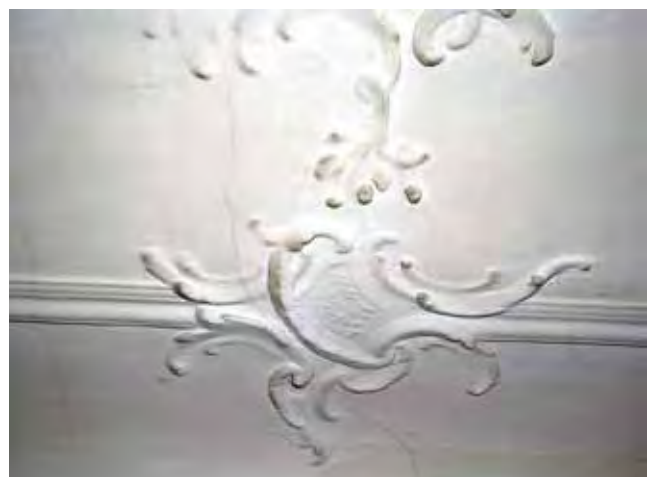
Abb. 1: Detail einer Schaffhauser Stuckdecke aus der Zeit um 1700 mit Schäden durch alte Sicherungsmaßnahmen