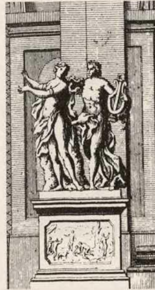
Abb. 6a Pomeranzenhaus des Prinzen Eugen, linker Brückenpfeiler mit Apoll und Daphne nach Salomon Kleiner

Schließlich ist auch die über das Bassin zum Pomeranzenhaus führende Brücke nichts anderes als eine Metapher der Metamorphose. Sie überbrückt das Wasser und wandelt damit im übertragenen Sinn Wasser zum Weg.