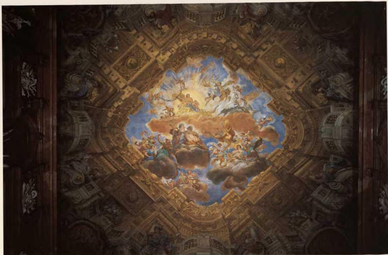
Abb. 10 Deckengemälde von Martino Altomonte und Marcantonio Chiarini im Marmorsaal des Unteren Belvedere in Wien, 1715/17, Österreichische Galerie Wien

sondern den interessanten Vorgang der Metamorphose, also der sukzessiven Verwandlung des Pomeranzenhauses, durch erzählende Handlungen unterstreichen.