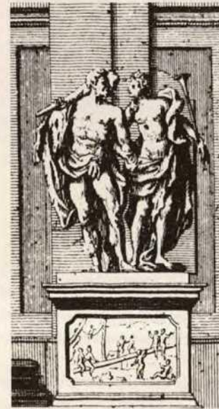
Abb. 7a Pomeranzenhaus des Prinzen Eugen, rechter Brückenpfeiler mit Herkules und Clio nach Salomon Kleiner

Den Brunnen an seinem ursprünglichen Platz – er wurde nach 1945 vom Pfirsichgarten teilweise an das Gebäude im Kammergarten zurückversetzt – überliefert uns vollständig nur Salomon Kleiner. Als dreigeschossiger Schalenbrunnen präsentiert er sich mit seiner Ausstattung als Lebensbrunnen. Zwei Schalen erheben sich über einem größeren, geschweiften Bassin. Im Bassin selbst steht ein