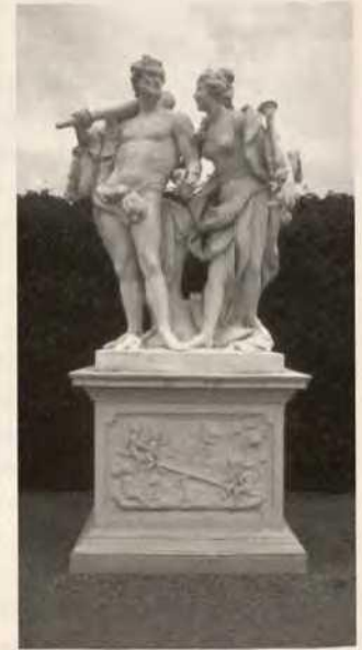
Abb. 7b Pomeranzenhaus des Prinzen Eugen, rechter Brückenpfeiler mit Herkules und Clio, Originalskulptur im Park

Schilfstock mit zwei Tritonenhermen. Sie tragen eine große Schale mit zwei Chimären oder Höllenhunden, die hier in den Dienst des lebendigen Wassers gestellt sind. Auf einen in den Brunnenstock eingelassenen Zerberuskopf folgt eine Muschelschale. In ihr sitzt ein fischehaltender Triton. Aus dem Maul seines Fisches steigt die hohe, gerade Fontäne auf.