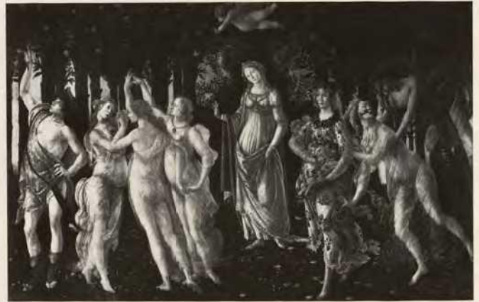
Abb. 2 Primavera , Gemälde von Sandro Botticelli, Galleria degli Uffizi in Florenz, um 1478

Die Front der Pflanzterrasse ist mit einer Reihe weiterer Gartenfiguren auf Postamenten bestanden. Seit ihrer Versetzung im Jahr 1850 stehen diese Figuren – mit teils gegeneinander vertauschten Gliedmaßen und auch in den Attributen leicht verändert – nun in Heckennischen des unteren Teils des großen Belvederegartens. Zusammen mit