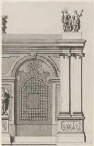
Abb. 5a Pomeranzenhaus des Prinzen Eugen, rechter Pilaster mit der Allegorie von Sonne und Feuer nach Salomon Kleiner