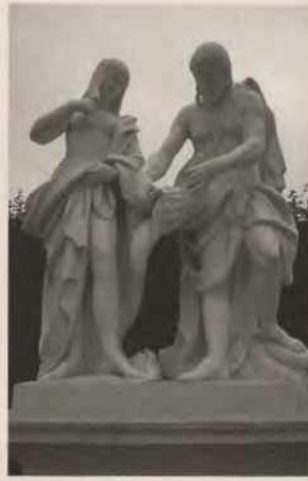
Abb. 4b Pomeranzenhaus des Prinzen Eugen, linker Pilaster mit der Allegorie von Regen und Wasser, Originalskulptur im Park