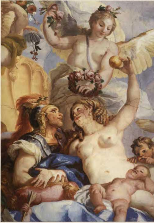
Abb. 3 Venus und Mars, Deckengemälde von J. M. Rottmayr, Ausschnitt, Osttreppenhaus im Gartenpalais Liechtenstein in der Rossau in Wien, um 1705, Sammlungen des Fürsten von und zu Liechtenstein, Vaduz – Wien

Windgott Zephyr, wie er sich an der erfolglos fliehenden und noch immer widerstrebenden Nymphe Chloris vergreift. Der Schlüsselbegriff zum Verständnis dieser Szene wie des gesamten Gemäldes überhaupt ist die Metamorphose. Gemeint ist damit die Verwandlung einer Pflanze in eine Gottheit oder umgekehrt, im weiteren Sinne das Auftreten von Göttern, Menschen, Sachen, Eigenschaften oder Allegorien in verschiedenerlei Gestalt mit der Möglichkeit ihrer Verwandlung. So zeigt die dramatisch inszenierte Szene um Chloris in Botticellis Gemälde den Beginn einer Metamorphose in Form von deren Verwandlung in die Göttin Flora. Bildlich wird die Metamorphose durch die Wiederholung der dargestellten Person in neuer Gestalt artikuliert. So erscheint links neben Chloris unter dem fruchtbringenden und blühenden Orangenbaum die Person erneut, nun in Gestalt der Flora. Die Chronologie der Metamorphose findet ihre bildliche Umsetzung im Nebeneinander der Figurengruppen bei gleichzeitiger Wahrung der Personenidentität.