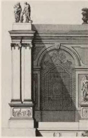
Abb. 4a Pomeranzenhaus des Prinzen Eugen, linker Pilaster mit der Allegorie von Regen und Wasser nach Salomon Kleiner