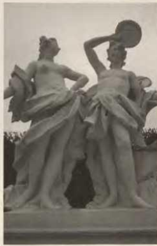
Abb. 5b Pomeranzenhaus des Prinzen Eugen, rechter Pilaster mit der Allegorie von Sonne und Feuer, Originalskulptur im Park

ge Attribut des Elements Wasser. Das Element des Wassers wird hier also in zweierlei Gestalt verbildlicht, einmal als der vom Himmel fallende Regen und ein andermal als das vom Gärtner geschöpfte Gießwasser (Abb. 4).