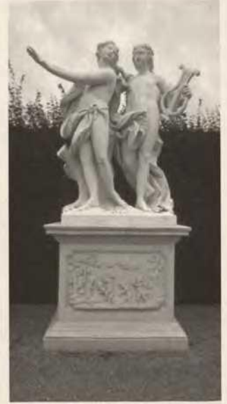
Abb. 6b Pomeranzenhaus des Prinzen Eugen, linker Brückenpfeiler mit Apoll und Daphne, Originalskulptur im Park