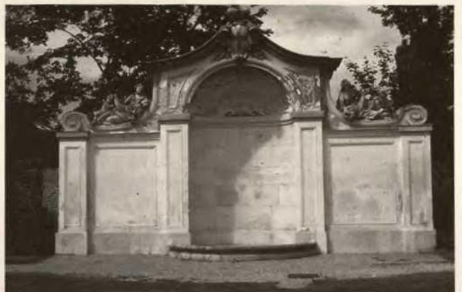
Abb. 9 Verdachung und Tympanon des ehemaligen Brunnens, Original im Pfirsichgarten

Das jährliche Aufschlagen dieser Winterung war ein besonderes Ereignis für sich, man könnte sagen, es stellte die Metamorphose der Orangerieanlage selbst dar. Deshalb, und nicht nur weil es sich um ein aufwendiges und kostspieliges Unterfangen handelte, hat Salomon Kleiner diesem Ereignis einen eigenen Prospekt gewidmet. In diesem zeigt er die Anlage in Schrägansicht von einem leicht erhöhten Standpunkt aus. Äußerst wichtig schien Salomon Kleiner die bühnenartige Wirkung des Pomeranzenhauses, die durch die Schrägansicht der Pflanzterrasse in Plastizität und Raumentiefe zusätzlich unterstrichen wird. Agierende Staffagefiguren sollten nicht nur Leben in das Bild bringen,