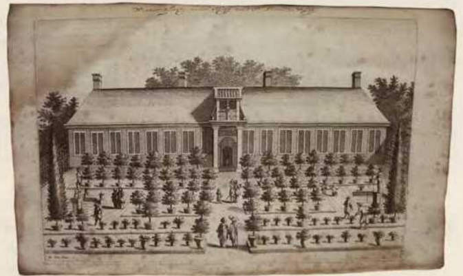
Abb. 2 Eine der ersten Orangerien in den Niederlanden, aus: Commelin, 1676

Zu Beginn der hohen Zitruskultur, die sich in den Niederlanden bis zum 18. Jahrhundert entwickelte, stehen erste, um 1600 errichtete Orangeriebauten. Diese frühesten Architekturen waren nicht viel mehr als »veredelte Scheunen« mit Fenstern, in deren kaum frostfreien Räumen die Zitrusbäume nur schwer zu überwintern waren.