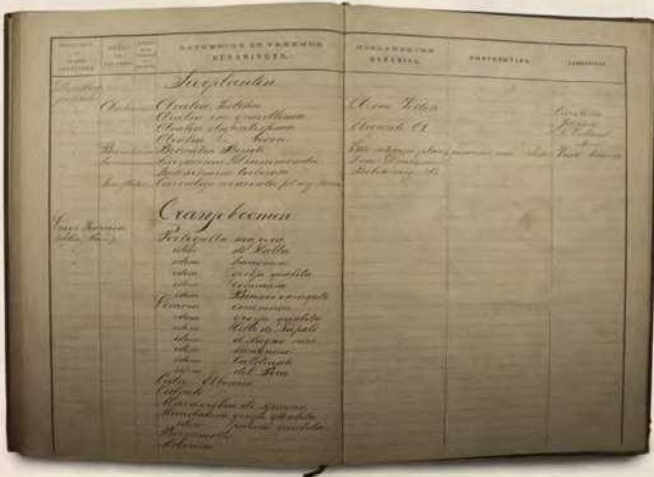
Abb. 1 Eine Seite der Inventarliste der Orangeriepflanzen des Palais Het Loo, ca. 1870