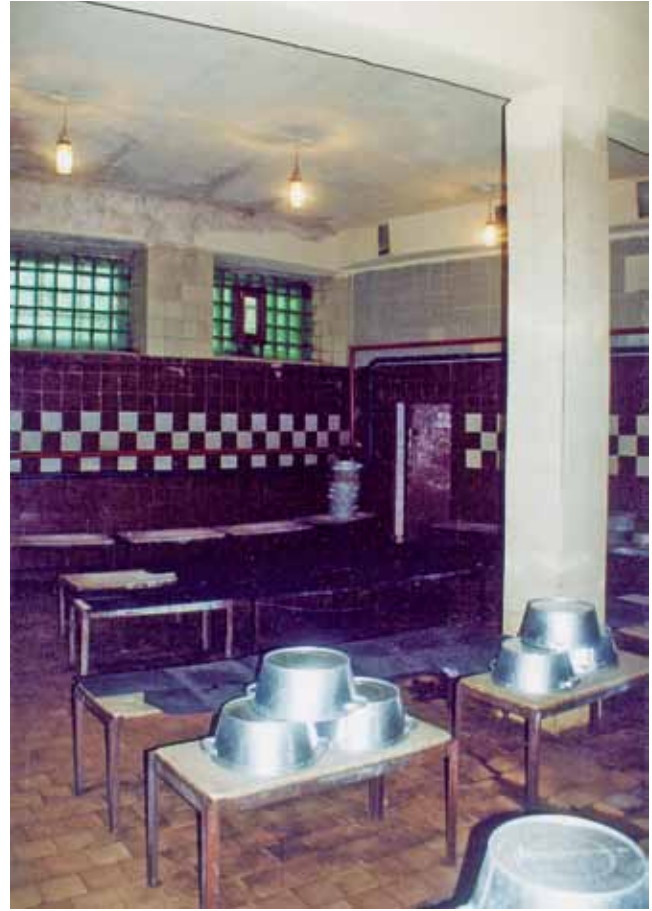
Seifenraum im „Runden Banja“, 2001. Помывочная, «Круглая баня», 2001 г.

Dass die Leningrader Kommunalwirtschaftler auf die russische Waschmethode mit Dampfbad und Schüsseln zurückgriffen, obwohl Duschen als fortschrittlich galten, erklärt sich nicht zuletzt aus der veränderten Einstellung zur Neuen Lebensweise. Während kurz nach dem Machtantritt die Bol'sheviki erwartet hatten, dass der „Neue Mensch“ allein durch das Ereignis der Revolution entstehe, wurde Mitte der 1920er Jahre den Veränderungen mehr Zeit eingeräumt und führende Politiker warnten vor übereilten und extremen Neuerungen. Eine solche hätten Badeanstalten ohne Dampfbad aber bedeutet. Denn die Körperreinigung durch Abwaschung und nicht durchs Schwitzbad war unter der breiten russischen Bevölkerung kaum bekannt bzw. ihr wurde eine „verächtliche Haltung“ entgegengebracht und die proletar-