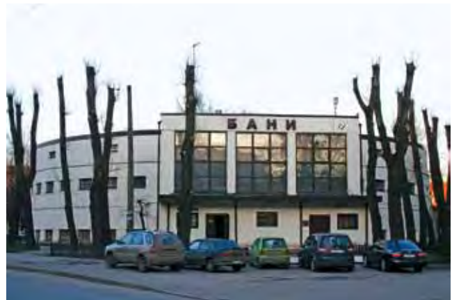
Badeanstalt des Vyborgskij Rayons – das „Runde Banja“ (1927–29, Atelier von Aleksandr Nikol'skij), 2007. «Кругая Баня» Выборгского Района (1927–29, Александр Никольский, мастерская). Фото 2007 г.

Die „Runde Banja“ im Vyborgskij Rayon ist die einzige der Banjas, die unter Denkmalschutz steht (seit 1993 mit örtlichem Denkmalstatus). Diese wird ihrer ursprünglichen Funktion gemäß genutzt und der Besucher kann die licht- und sonnendurchfluteten, gut proportionierten Räume von Aleksandr Nikol'skij erleben. Dagegen ist der Erhalt der zweiten Nikol'skij Banja, die in der Anwärter-Kategorie der „neu erfassten Objekte“ einen nur geringen Schutz genießt, stark gefährdet. „Gigant“ steht seit wenigen Jahren