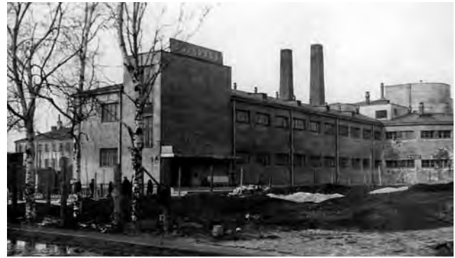
Badeanstalt des Moskovskij-Narvskij Rayons – Banja „Gigant“ (1928–30, Atelier von Aleksandr Nikol'skij). Foto 1930er Jahre

In den 1927/28 errichteten Bädern von Nikol'skij wurde die Eliminierung von Räumen und Elementen, die für die Reinigungsfunktion nicht grundlegend notwendig waren, vollendet. Allerdings entsprach dieses reduzierte Raumprogramm nicht unbedingt der sowjetischen Idealvorstellung eines öffentlichen Bads, denn diese beinhaltete zumindest eine Kombination mit Elementen der als fortschrittlich geltenden westlichen Badekultur. Zusätzliche Duschabteilungen sollten zur allmählichen Gewöhnung an diese hygienische Waschmethode führen. Sowjetische Bäderspezialisten meinten, dass Hallenbäder „dank der Gymnastik des ganzen Körpers während des Schwimmens“ der „gesundeste“ Typ einer Badeanstalt seien. 16 Sie befürworteten die Kombination mit Wäschereien, denn zu einem sauberen Körper müsse auch saubere Kleidung gehören, und durch die Mitbenutzung der Banja-Heisanlage würde die „kommunale Wäscherei ... erschwinglich sogar für die ärmere Bevölkerung“. 17