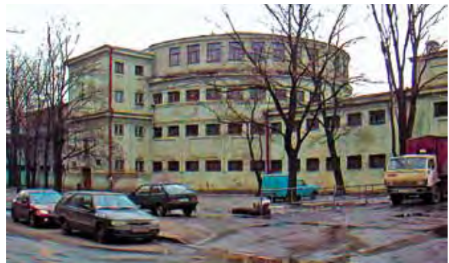
Banja „Raznočinnaja“ des Petrogradskij Rayons (1931–Mitte 1930er, Nikolaj Demkov/V. Geršelman. Umbau 1934–36 nach einem Entwurf von Aleksandr Gegello). Seitenansicht nach Aufstockung, Foto: 2003. «Разночинные бани» Петроградского района (1931–сер.1930 гг., Николай Демков/ В.Гершельман. Перестройка в 1934–36 по проекту арх. Гегелло). Боковой фасад после надстройки, Фото 2003 г.

Бани «Гигант» Московско-Нарвского района (1928–30, Александр Никольский, Мастерская). Фото 1930-х гг.