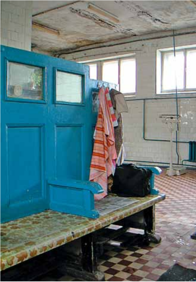
Auskleideraum im Banja „Gigant“, 2003. Раздевалка, бани «Гигант», 2003 г.

im Raum- und Funktionsangebot sowie durch die nüchterne Gestaltung voller geometrischer Einfachheit, Funktionalität und Helligkeit. Nikol'skij entwickelte den Grundriss sinnvoll aus den inneren Bewegungsabläufen heraus, indem er Umkleide, Seifen- und Dampfraum als Raumfolge anordnete. Der Zusammenschluss der zwei Abteilungen auf einer Etage ermöglichte, dass bei einer Typhus- oder anderen durch Läuse übertragbaren Epidemie ein „reiner“ Ankleide- von einem „unreinen“ Auskleideraum abgetrennt werden konnte, während die Wäsche in den darüber liegenden Geräten zur Entlausung (Desinsektion) behandelt wurde. Diese Vorkehrmaßnahme für den Epidemiefall hatte bei den vorrevolutionären Banjas gefehlt, sie wurde aber typisch für sowjetische Bäder. 8