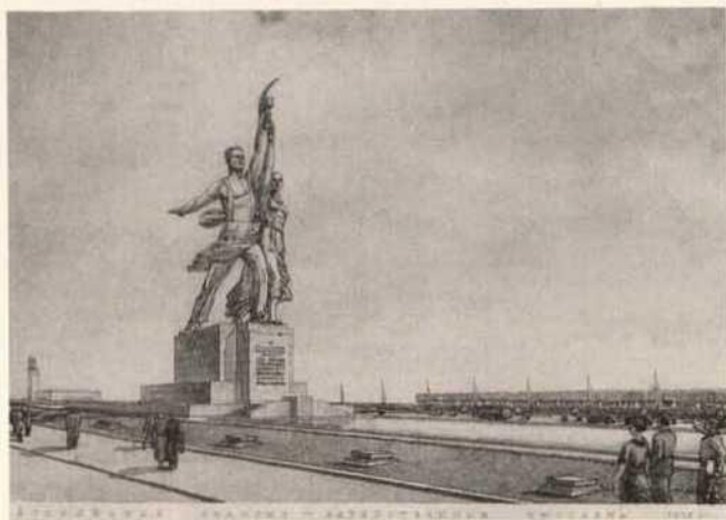
Arbeiter- und Kolchosbauerin, errichtet 1939 anlässlich der All-unions-Ausstellung der Landwirtschaft in Moskau auf dem Platz vor dem Haupteingang