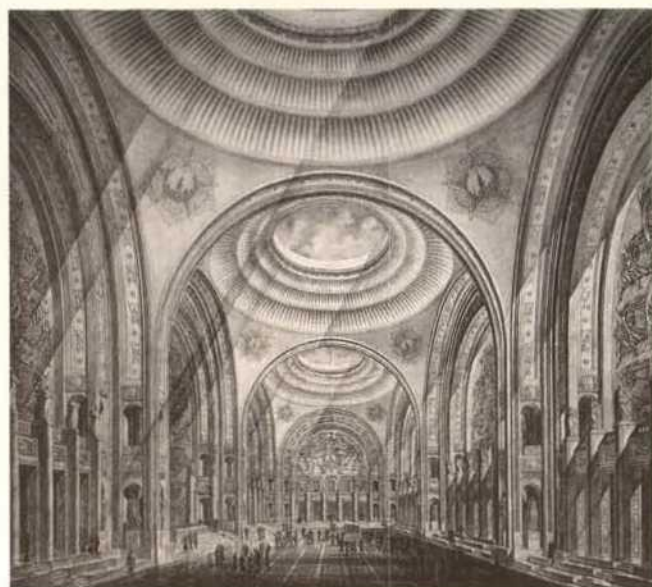
Palast der Sowjets in Moskau, Variante von 1948, Empfangsballe der Regierung, Innenansicht