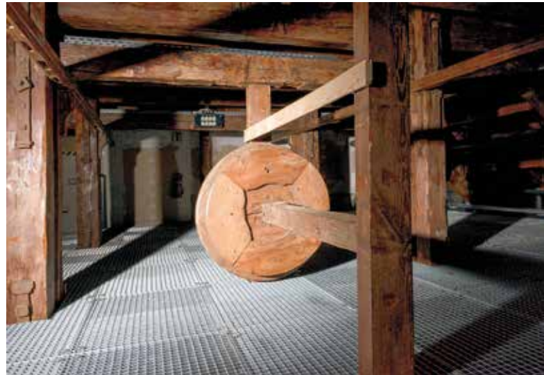
Abb. 3 Reste der barocken Bühnentechnik, darunter der neue Schnürboden