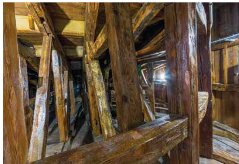
Abb. 5 Unterkonstruktion des Zuschauerraums nach der Maskierung