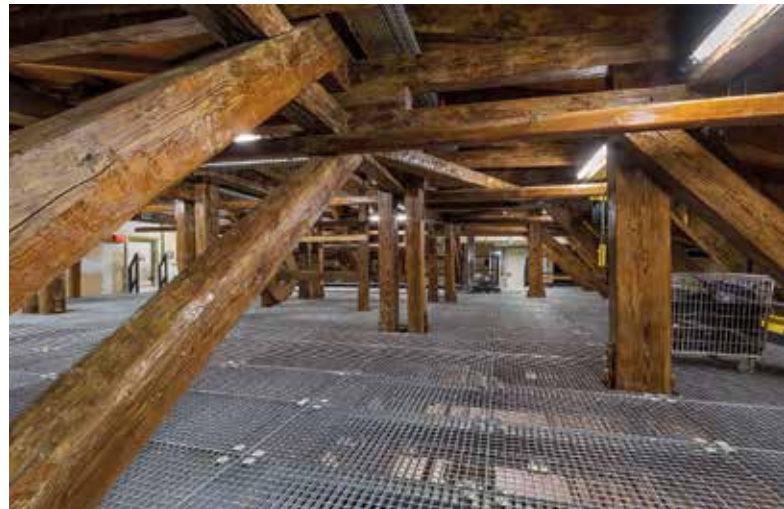
Abb. 4 Dachkonstruktion nach der Maskierung