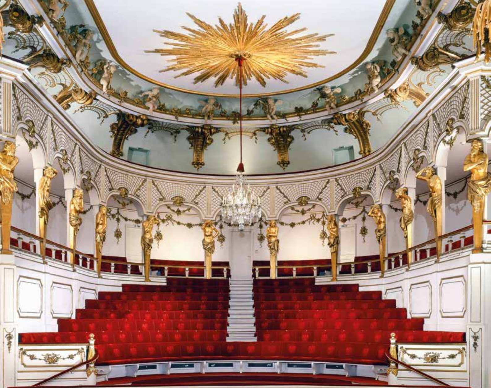
Abb. 2 Blick in den Zuschauerraum

Im Theater wären nur noch konzertante Aufführungen möglich gewesen.