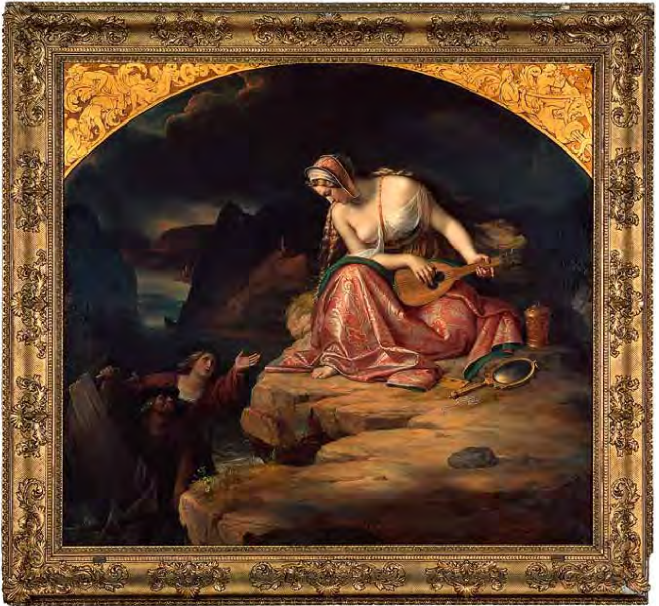
Carl Joseph Begas, Lureley, 1835 (s. auch S. 142, Abb. 8)