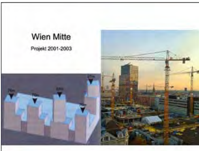
Einer der fünf geplanten Türme wurde gebaut. Anstoß für das Wiener Memorandum 2005