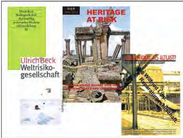
Beobachtung als Teil des Risikomanagements und der Konfliktvermeidung