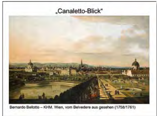
Maßstäbe für die visuelle Integrität