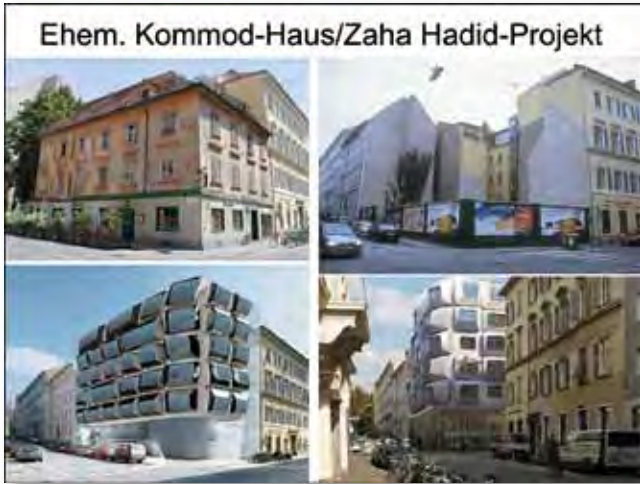
Die Verführung großer Namen