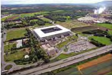
Dem Welterbe Salzburg fern und doch so nah