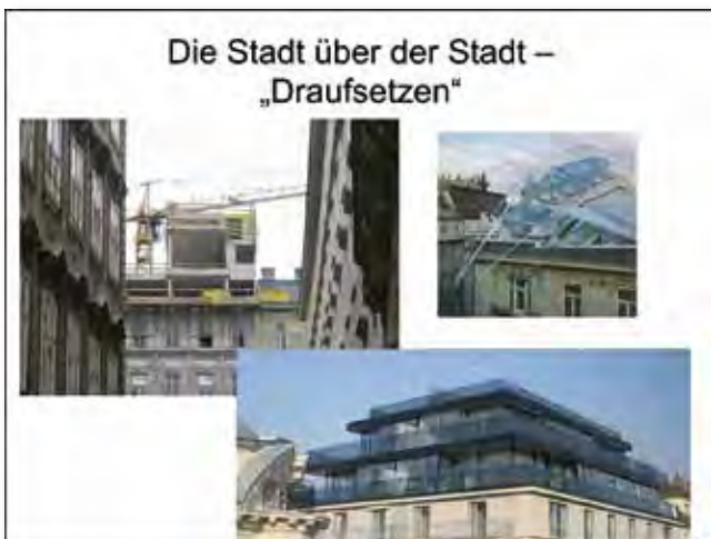
„Draufsetzen“, Zerstörung des Anblicks durch Privilegien des Ausblicks