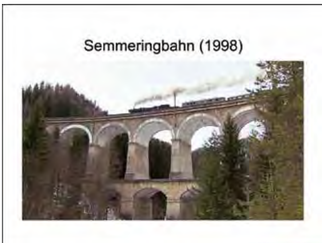
Idealbild – und Realität?