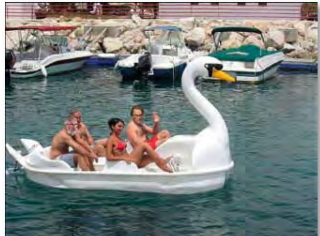
Geht das Welterbe baden? Mitglieder der österreichischen ICOMOS Monitoring-Gruppe am Traunsee (Fotomontage)