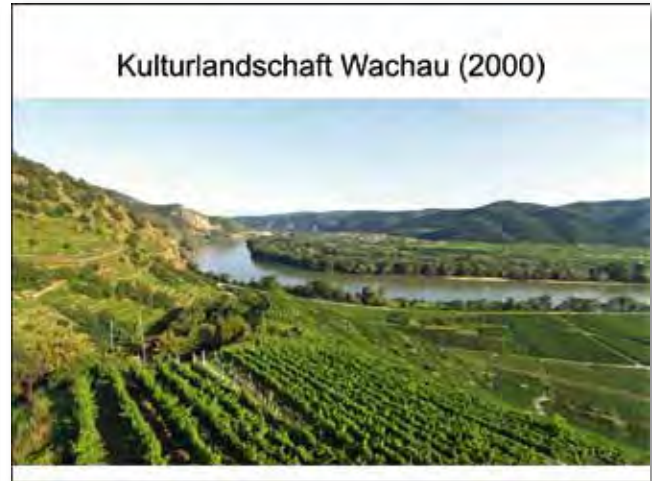
Idealbild – und Realität?