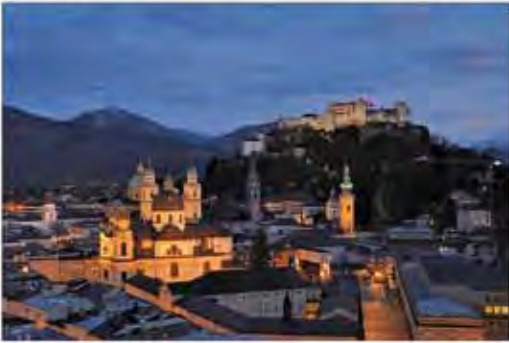
Idealbild – und Realität?