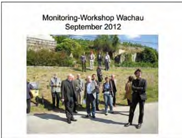
Argusaugen der Prävention zur Vermeidung des „Ernstfalls“