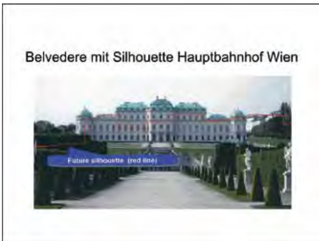
Das Schloss als Abdeckkulisie ...