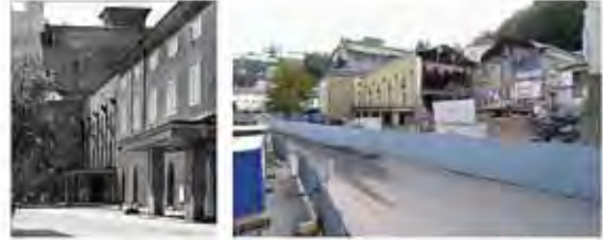
Kleines Festspielhaus Clemens Holzmeister 1926