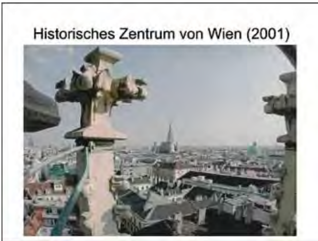
Idealbild – und Realität?