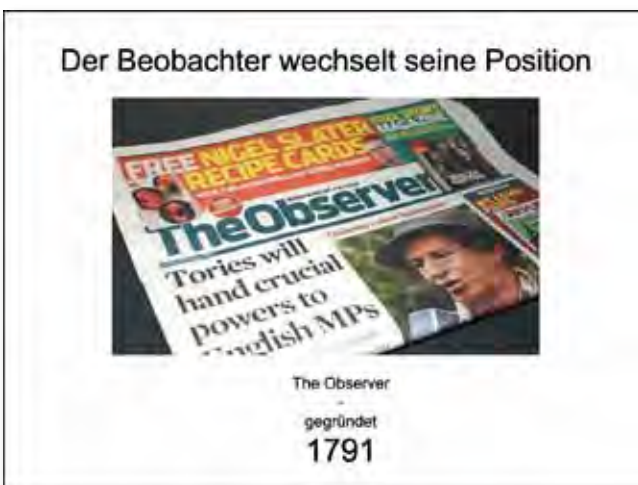
Veränderung der Perspektiven