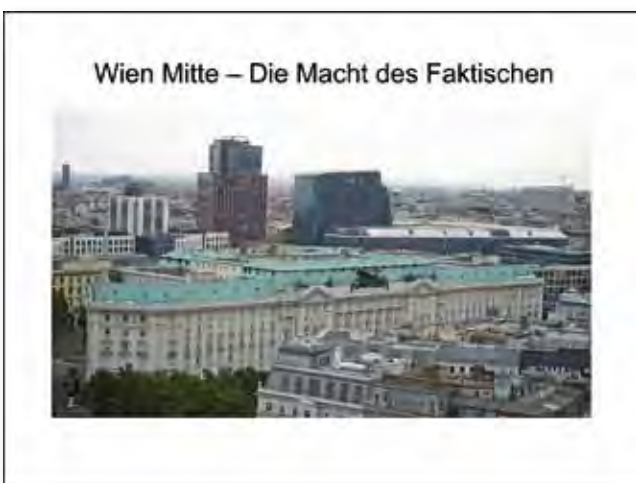
Ergebnis 2012 mehr als fragwürdig. Wiener Memorandum – wirkungslos?