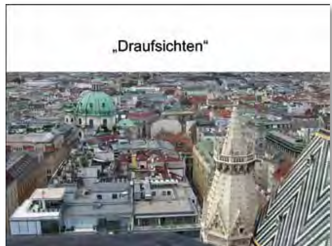
Zählt nur die Fußgänger-Perspektive (Augenhöhe 1,60) (!?)