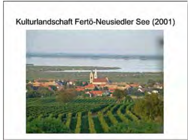
Idealbild – und Realität?