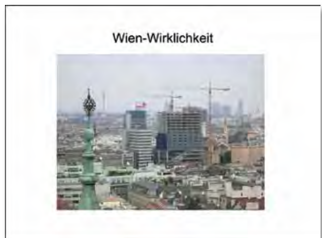
Alles Walzer – alles welterbeverträglich?