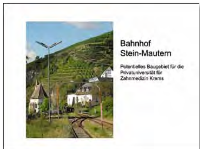
Realisierung noch unentschieden