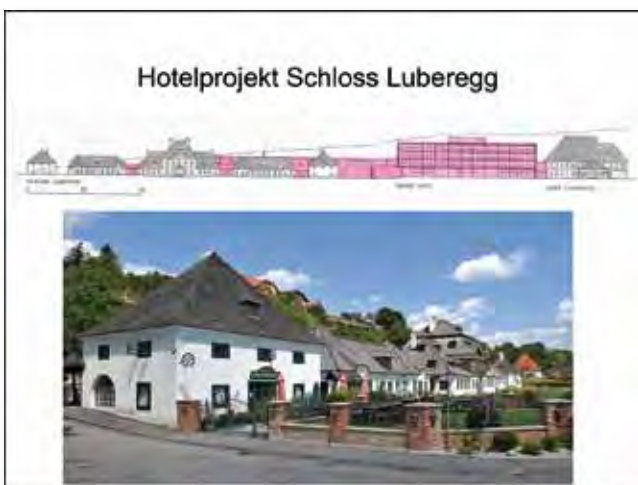
Projekt vorläufig hintangestellt