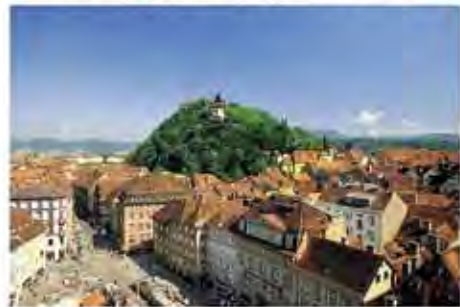
Idealbild – und Realität?