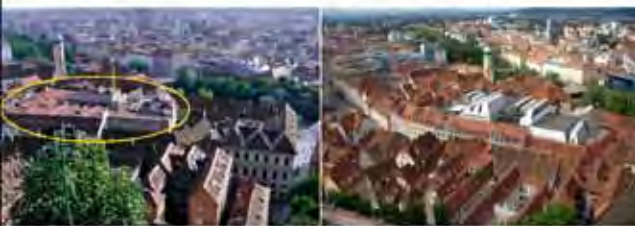
Entscheidung nachhaltig fragwürdig