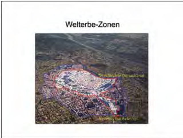
Problem zu gering bemessene Pufferzone