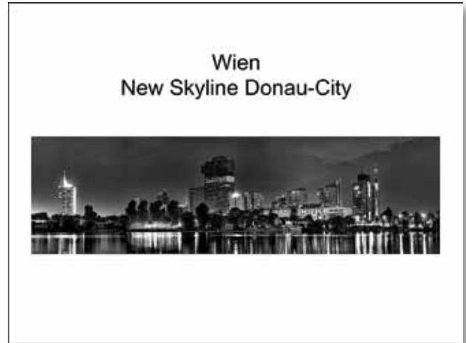
Wien, wie es werden soll?