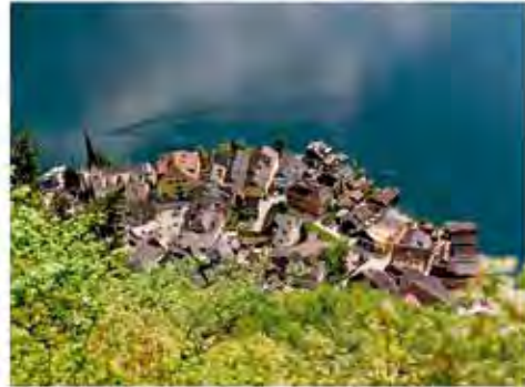
Idealbild – und Realität?