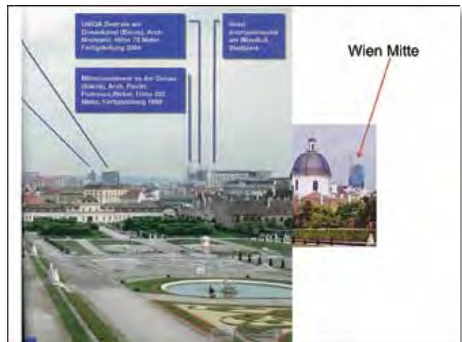
Metamorphosen des „Canaletto-Blicks“. Wiener Skyline vom Belvedere aus heute