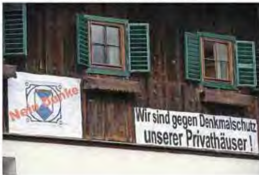
„Die Macht geht vom Volke aus.“ Daher bis heute kein Ensembleschutz für das Welterbe Hallstatt