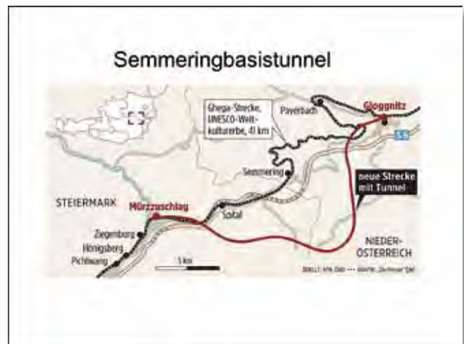
Mit 27,3 km der längste Tunnel Österreichs. Eine technische, kulturlandschaftliche und architektonische Herausforderung