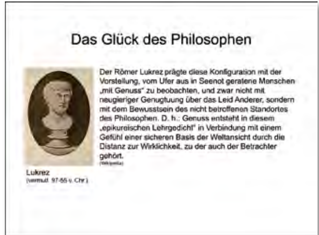
Beobachtung aus der Distanz des Nicht-Betroffenseins