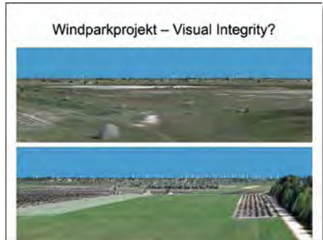
Was sagt die UNESCO...? Bislang keine Entscheidung, trotzdem bereits in Bau