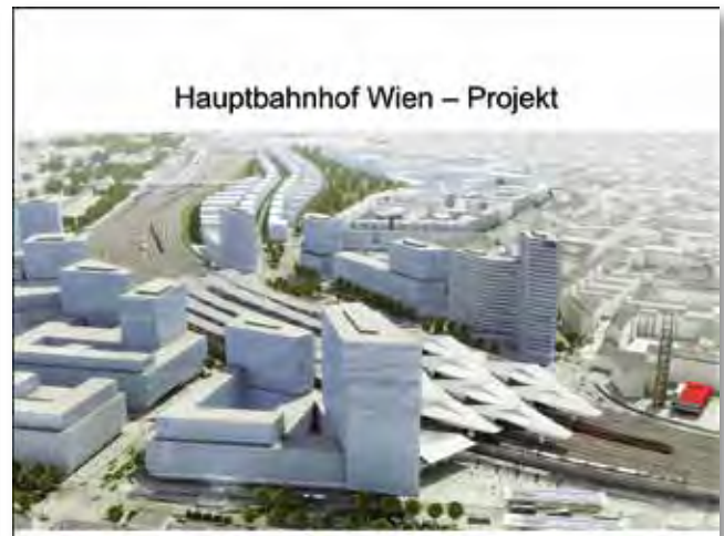
... für das in Entwicklung befindliche neue Hauptbahnhof-Quartier