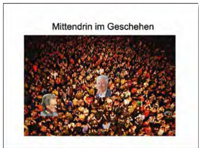
Alle alles und jeden beobachtend