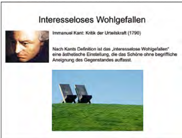
Ästhetische Weltsicht. Beobachtung ohne Eigennutz