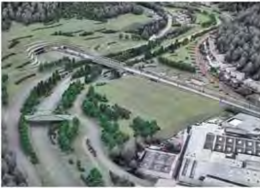
Optimierung vieler Details der Neuplanung – die Zukunft der Welterbe-Bergstrecke ist offen