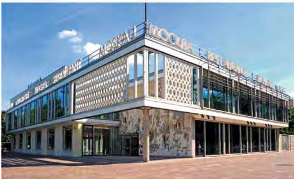
Wohngebiet Karl-Marx-Allee, II. Bauabschnitt. Café Moskau. Aufnahme 2012.