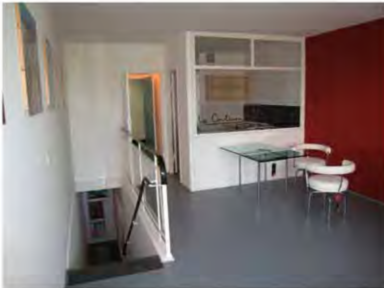
Unité d'Habitation – Typ Berlin. 2-Zimmer-Maisonettewohnung in der 2. Straße.