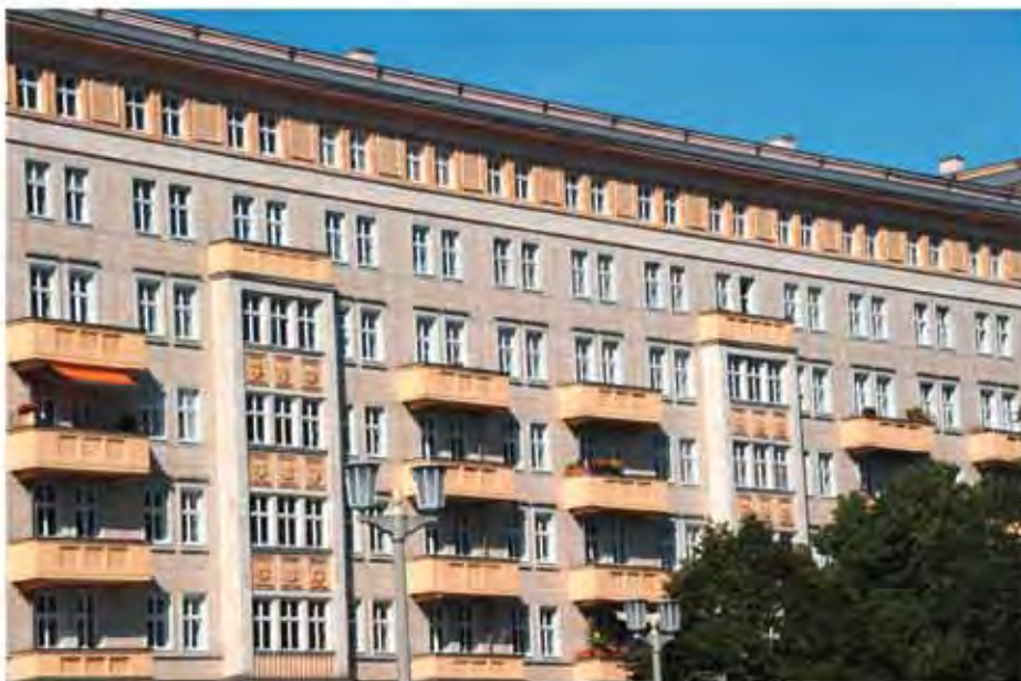
Wohngebiet Karl-Marx-Allee, I. Bauabschnitt, Fassadenausschnitt, Aufnahme 2012.