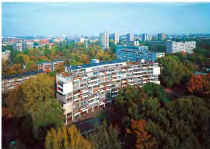
Blick über das Hansaviertel – IBA 1957 von Süden. Im Vordergrund Haus Gropius, dahinter Haus Vago; im Hintergrund die Punkthochhäuser (aus: G. Dolf-Bohnekämper / F. Schmidt: Das Hansaviertel. Die Nachkriegsmoderne in Berlin. Berlin 1999. Foto: Franziska Schmidt).