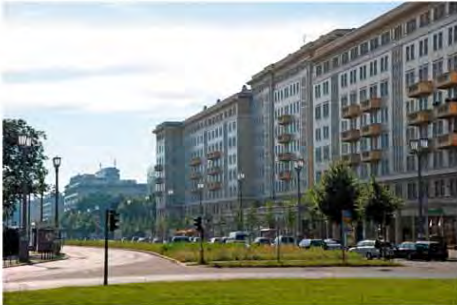
Wohngebiet Karl-Marx-Allee, I. Bauabschnitt, Blick in Richtung Alexanderplatz, Aufnahme 2012 (Foto: M. Schütze, 2012).