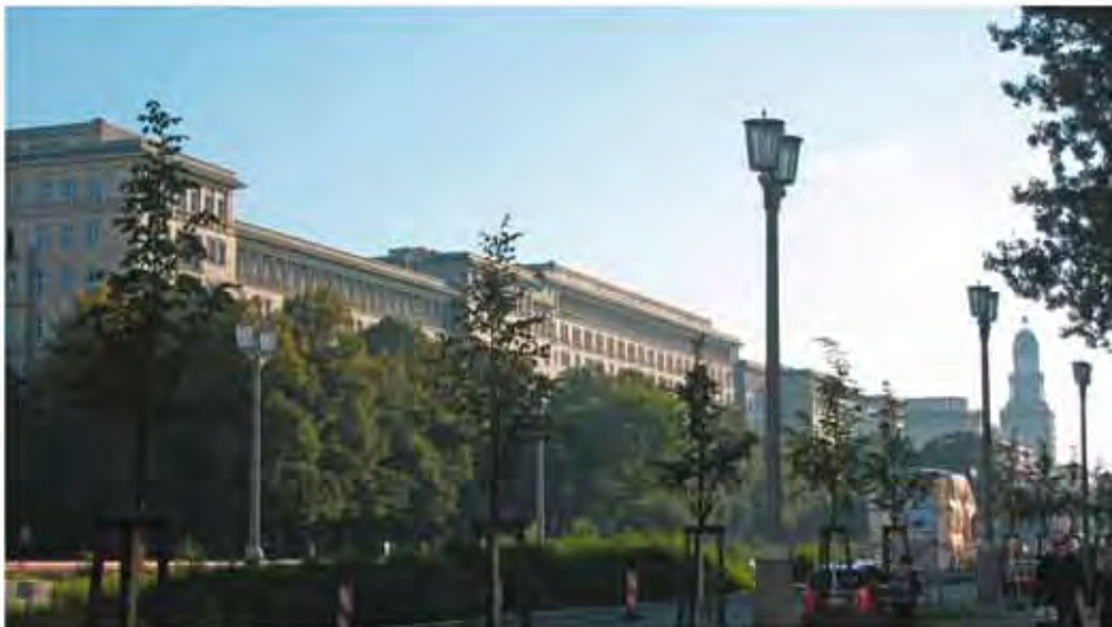
Wohngebiet Karl-Marx-Allee, I. Bauabschnitt. Aufnahme 2011.