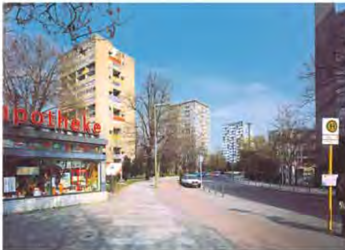
Blick auf die Reihe der Punkthäuser an der Bartningallee mit dem Geschäftsbereich am U-Bahnhof Hansaplatz. (aus: G. Dolff-Bohnekämper / F. Schmidt: Das Hansaviertel. Die Nachkriegsmoderne in Berlin. Berlin 1999. Foto: Franziska Schmidt).