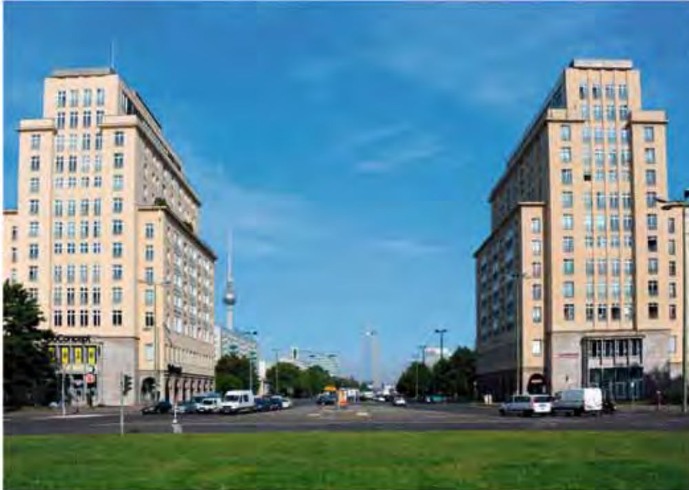
Wohngebiet Karl-Marx-Allee, I. Bauabschnitt mit Blick in Richtung II. Bauabschnitt / Alexanderplatz. (Foto: M. Schütze, 2012).