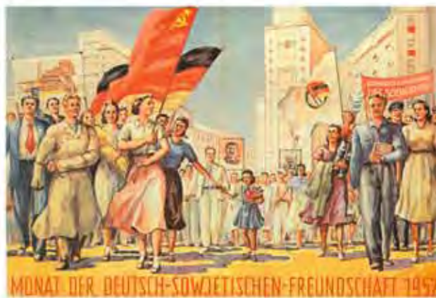
Monat der deutsch-sowjetischen Freundschaft DDR, 1952, Propagandaplakat: Offsetdruck 60 x 83 cm Inv.-Nr.: P 96/434.