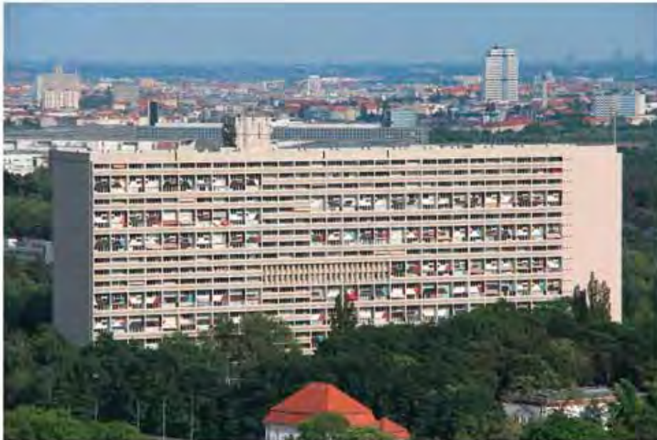
Blick von Westen auf die Unité d'Habitation – Typ Berlin am Olympiastadion. Arch Le Corbusier.