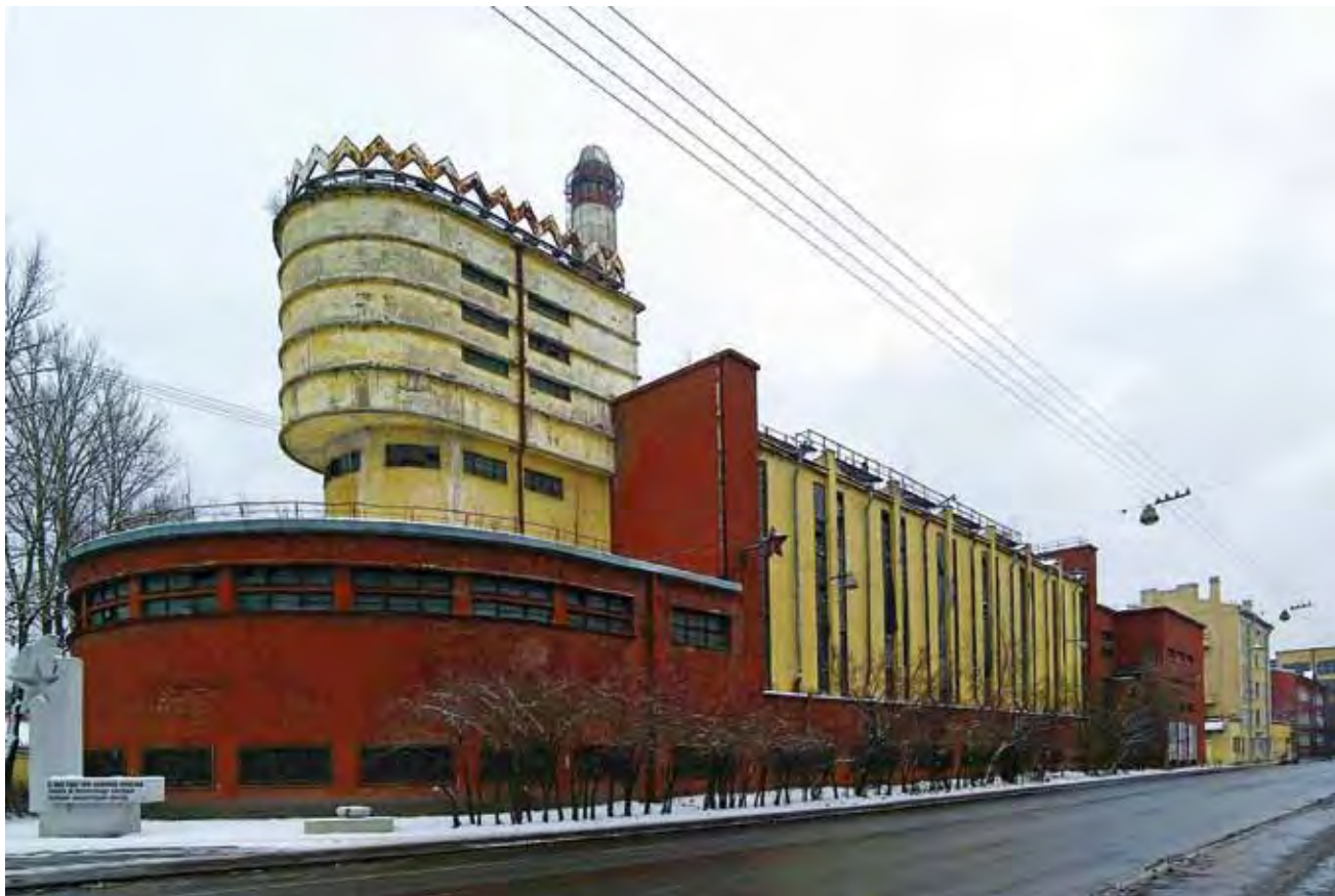
Силовая станция комплекса «Красное знамя» арх. Эрих Мендельсон, Фото 2007. Energiestation der Industrieanlage „Rote Fahne“ von Erich Mendelsohn, Foto 2007.

В конце 2006 года петербургский предприниматель Игорь Бурдинский приобрел большую часть фабричного комплекса «Красное Знамя» на Пионерской улице Петроградской стороны. Находящиеся здесь производственные сооружения, возведенные в 1926–1928 и расширенные в середине 1930-х годов, включают фрагменты широко известного проекта немецкого архитектора Эриха Мендельсона. В последнее время они все чаще упоминаются как пример утраченного наследия, так называемой, современной архитектуры.