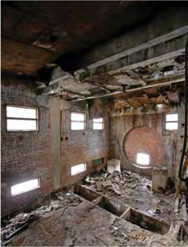
Интерьер силовой станции – комплекс «Красное знамя». Фото 2008. Innenaufnahme der Energiestation der Textilfabrik „Rote Fahne“, Foto 2008

комплекс целиком. С точки зрения экономики этот шаг весьма неоднозначен. Несмотря на то, что купленный участок является хорошим вложением средств, наличие на этой территории памятника промышленной архитектуры вносит ряд серьезных ограничений при его использовании. Но я совершил сделку как раз потому, что здесь находится сооружение Мендельсона.