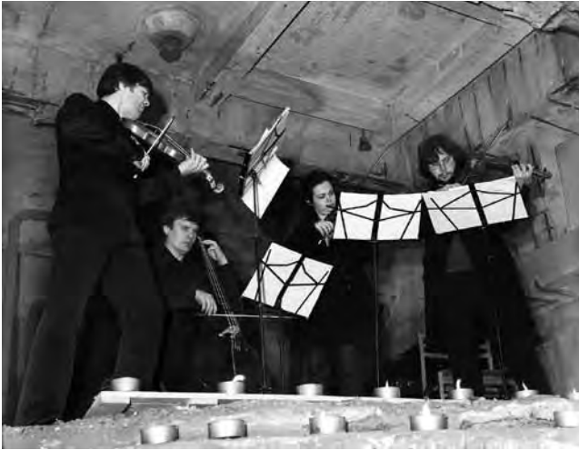
Концерт ансамбля «Солисты Екатерины Великой» в здании ТЭЦ комплекса «Красное знамя» для участников форума Петербургский диалог 29. 9. 2008. Konzert des Ensembles „Solisten von Katharina der Großen“ in der Wärme-Energie-Zentrale der „Roten Fahne“ für die Teilnehmer des Petersburger Dialogs am 29. 9. 2008.

разившегося экономического кризиса это непросто. Тем более, сложно найти, я подчеркиваю, адекватных партнеров, которые разделяли бы моё бережное отношение к данному объекту.