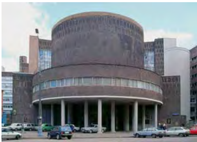
Здание Центросоюза в Москве (Ле Корбюзье, Н. Колли, 1928–1937). Претендент от России на включение в серийную номинацию работ Ле Корбюзье (Франция, Германия, Бельгия, Швейцария, Аргентина, Япония). Заявлена в Список Всемирного наследия в 2008 г. Centrosojuz-Gebäude in Moskau (Le Corbusier, N. Kolli 1928–1937). Vorschlag für die 2008 gestartete Welterbeinitiative Le Corbusier (Frankreich, Deutschland, Belgien, Schweiz, Argentinien, Japan). 2008.

и привел к отказу от традиций реализма и фигуративного творчества в живописи. Постепенно он завладел всеми формами пространственных искусств – и, в первую очередь, архитектурой. Условные беспредметные композиции и абстрактные образы, получившие развитие в экспериментальном искусстве начала XX века (экспрессионизм, кубизм, футуризм, супрематизм), заложили основы новой стилиобразующей системы, прервавшей эволюционное развитие зодчества. Был создан новый язык архитектуры модернизма, 1 отказавшейся от академических концепций стиля с присущими ему статическими объемами, ордерам, симметрией, ритмическим повторением. К началу 1920-х гг. в Европе оформилось Современное движение (Modern Movement), ориентированное в будущее и окрыленное оптимистической верой в возможности прогресса. Такие течения как «функционализм», «рационализм», «минимализм», «авангардизм», «конструктивизм» в архитектуре стали также ассоциироваться с понятием модернизма. Его социальный и идеологический пафос (в особенности на раннем этапе) был направлен на обновление всей жизненной среды общества. В утверждении новой архитектуры бесспорными лидерами выступили Германия, Россия, Голландия и Франция. Каждая из стран внесла самостоятельный вклад в развитие авангардных течений, однако единое культурное пространство, которое существовало в Европе до начала 1930-х годов, позволяло плодотворное сотрудничество и взаимообогащение.