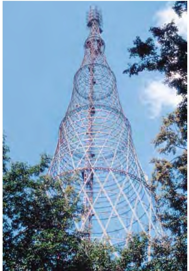
Пространственные конструкции инженера В. Шухова. Радиоба́шня в Москве (1919–1922). Претендент на включение в Предварительный список Всемирного наследия от России.

В развитие этой темы, в Меморандуме Авангард и Всемирное наследие была поставлена задача включения здания Центросоюза (1928–1937) в Москве в серийную номинацию архитектурных и градостроительных произведений Ле Корбюзье, выдвинутых в Список Всемирного наследия шестью странами мира в 2008 г. В равной степени это касается и Библиотеки в Выборге (1928), которая может потенциально войти от Финляндии и России в состав серийной номинации построек архитектора А. Аалто.