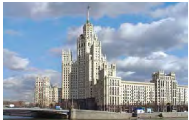
Система высотных зданий в Москве послевоенного периода. Жилой дом на Котельнической набережной (Д. Чечулин, А. Ростковский, 1949–1952). Претендент на включение в Предварительный список Всемирного наследия от России.

Raumtragwerke des Ingenieurs V. Šuchov. Funkturm in Moskau (1919–1922). Kandidat für die Aufnahme in die Welterbe-Tentativliste von Russland.