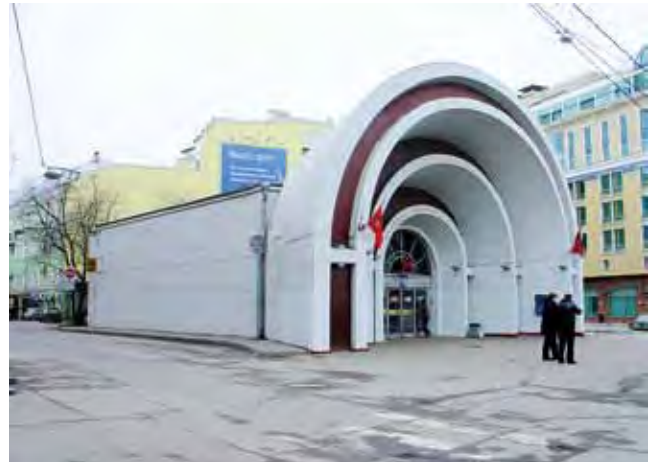
Система Московского метрополитена 1930–1950-х гг. Входной вестибюль станции «Красные ворота» (Н. Ладовский, 1935). Претендент на включение в Предварительный список Всемирного наследия.

Крупнейшая научная конференция Heritage at Risk. Сохранение архитектуры XX века и Всемирное наследие , которая проходила в Москве в апреле 2006 г. под патронатом правительства Москвы, выявила многочисленные факты утрат и деградации памятников этого периода и заявила о необходимости принятия безотлагательных мер по сохранению этого ценного пласта культурного наследия. В тексте итогового документа – Московской декларации по сохранению культурного наследия XX века – звучит призыв «к строгому соблюдению законов о