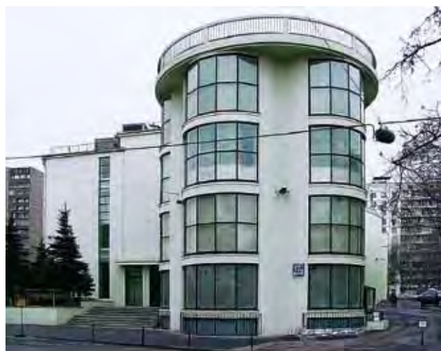
Рабочий клуб «Буревестник» в Москве (К. Мельников, 1927). Претендент на включение в Предварительный список Всемирного наследия от России.

Wohn- und Atelierhaus des Architekten K. Melnikov in Moskau (1927–29). Kandidat für die Aufnahme in die Welterbe-Tentativliste von Russland.