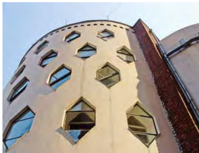
Дом-студия архитектора К. Мельникова в Москве (1927–1929). Претендент на включение в Предварительный список Всемирного наследия от России.

Наиболее значимые сооружения 1920–1930-х гг., сосредоточенные в Москве и представляющие собой золотой фонд мирового Современного движения, были поставлены на охрану в 1987 г. и являлись памятниками самой низшей «местной» категории до 2005 г., когда были переведены в разряд объектов «регионального» значения. Лишь единицы обладают «федеральным» (обще-