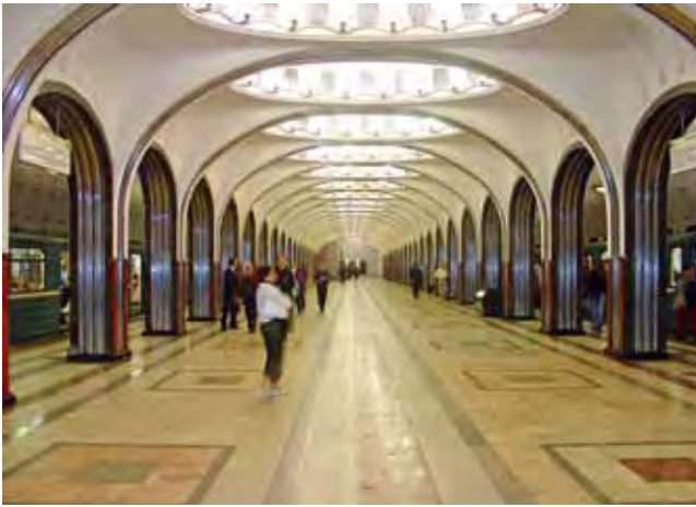
Система Московского метрополитена 1930–1950-х гг. Станция «Маяковская» (А. Душкин, 1938). Претендент на включение в Предварительный список Всемирного наследия от России.

Moskauer Metronetz aus den 1930–50er Jahren. Station „Majakovskaja“ (А. Duškin, 1938). Kandidat für die Aufnahme in die Welterbe-Tentativliste von Russland.