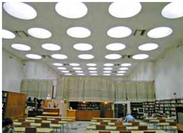
Читальный зал Библиотеки в Выборге (быв. Финляндия) (А. Аалто, 1928). Претендент от России на включение в серийную номинацию работ Аалто от Финляндии. Lesesaal der Bibliothek in Vyborg (ehemals Finnland) von dem Architekten Alvar Aalto, 1928. Kandidat in Russland für eine Aufnahme in die von Finnland beabsichtigte internationale serielle Gruppennominierung des architektonischen Gesamtwerks von Alvar Aalto für die Welterbeliste der UNESCO.

К работе «Петербургского диалога» 2008 международными научными комитетами ICOMOS России и Германии был подготовлен специальный Меморандум Авангард и Всемирное наследие . 2 Центральная задача этого важного документа состояла в привлечении внимания: 1) к универсальной ценности построек, созданных в России в XX веке; 2) к их неудовлетворительному (бед-