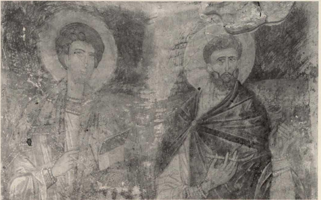
Nikolauskirche, Naos, die Heiligen Cosmas und Damian / Eglise Saint-Nicolas, naos, les saints Cosme et Damian

Dans l'ensemble, l'édifice est considéré comme un «... monument curieux, un conglomérat de plusieurs époques et un résultat des reflets de l'architecture antique sur plan byzantin, adapté au système d'élévation du roman tardif transylvain et aux formes décoratives des bâtiments de bois autochtones.» (V. Vătășianu, p. 89)