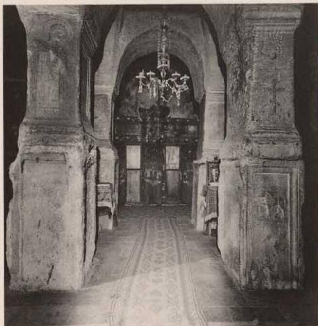
Nikolauskirche, Innenansicht / Eglise Saint-Nicolas, vue de l'intérieur

la nef, sans aucune raison constructive, probablement par simple esprit d'imitation d'un modèle de l'Antiquité, aujourd'hui disparu, ou bien – peut-être – des contreforts gothiques.