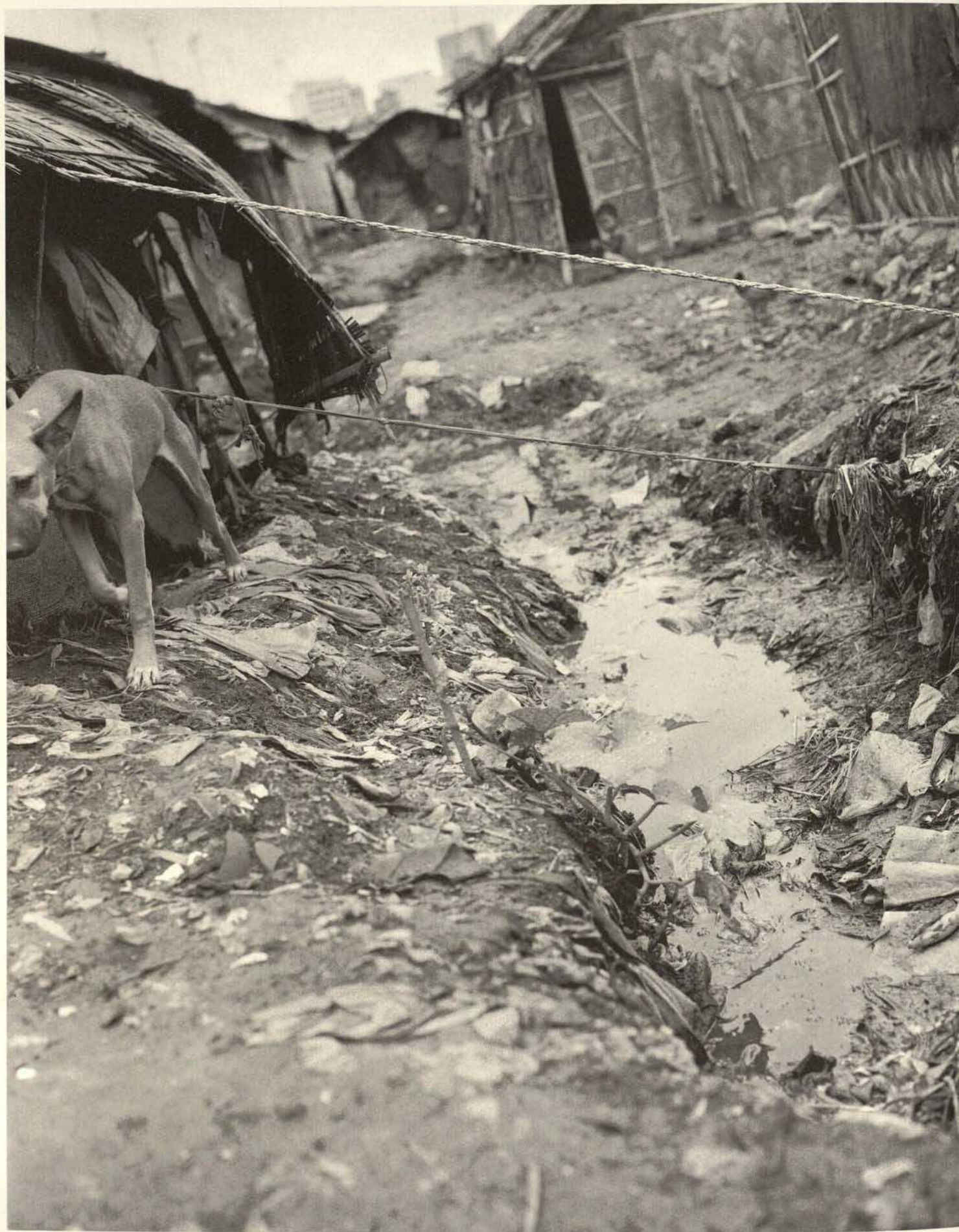
△ Elendsviertel in der Dritten Welt