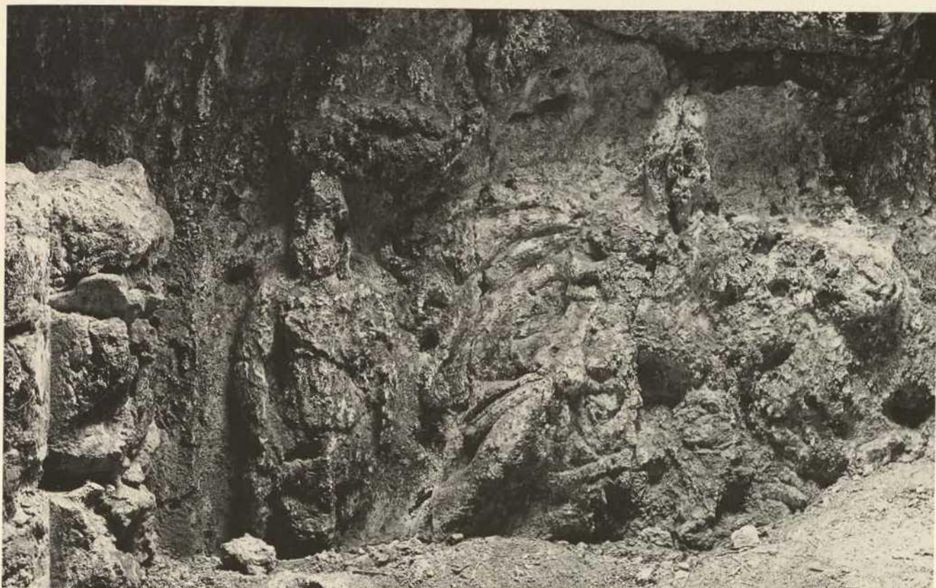
Abb. 74. Mithras-Kultstätte, Relief mit zentraler Mithrasfigur (mit Helm und wehendem Mantel), seitlich, stehend Cautopates (mit gesenkter Fackel).

74. kép. Mithras-kultuszhely, dombormű közepetáján Mithras alakja, sisakkal, lobogó köpenyben, oldalt Cautopates álló alakja (leeresztett fáklával).