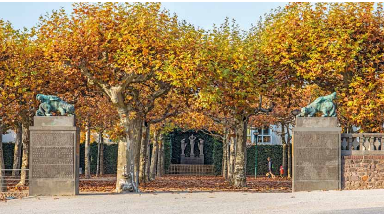
XVII Bernhard Hoetger, Platanenhain, 1914 (Zustand 2015) Bernhard Hoetger, Plane Tree Grove, 1914 (status 2015)