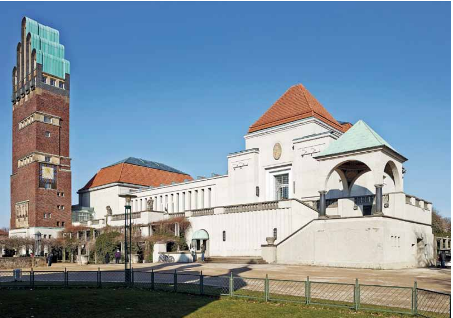
III Joseph Maria Olbrich, Hochzeitsturm und Ausstellungsgebäude, 1908 (Zustand 2013) Joseph Maria Olbrich, Wedding Tower and Exhibition Hall, 1908 (status 2013)