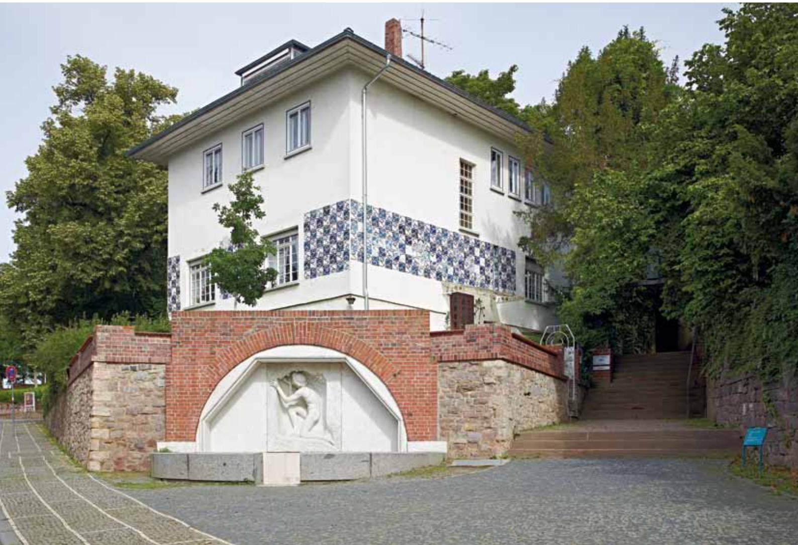
XII Joseph Maria Olbrich, Haus Olbrich, 1901 (Zustand 2012) Joseph Maria Olbrich, Olbrich House, 1901 (status 2012)