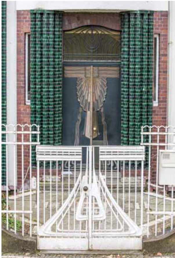
VII Peter Behrens, Haus Behrens, Eingang, 1901 (Zustand 2015) Peter Behrens, Behrens House, entrance, 1901 (status 2015)