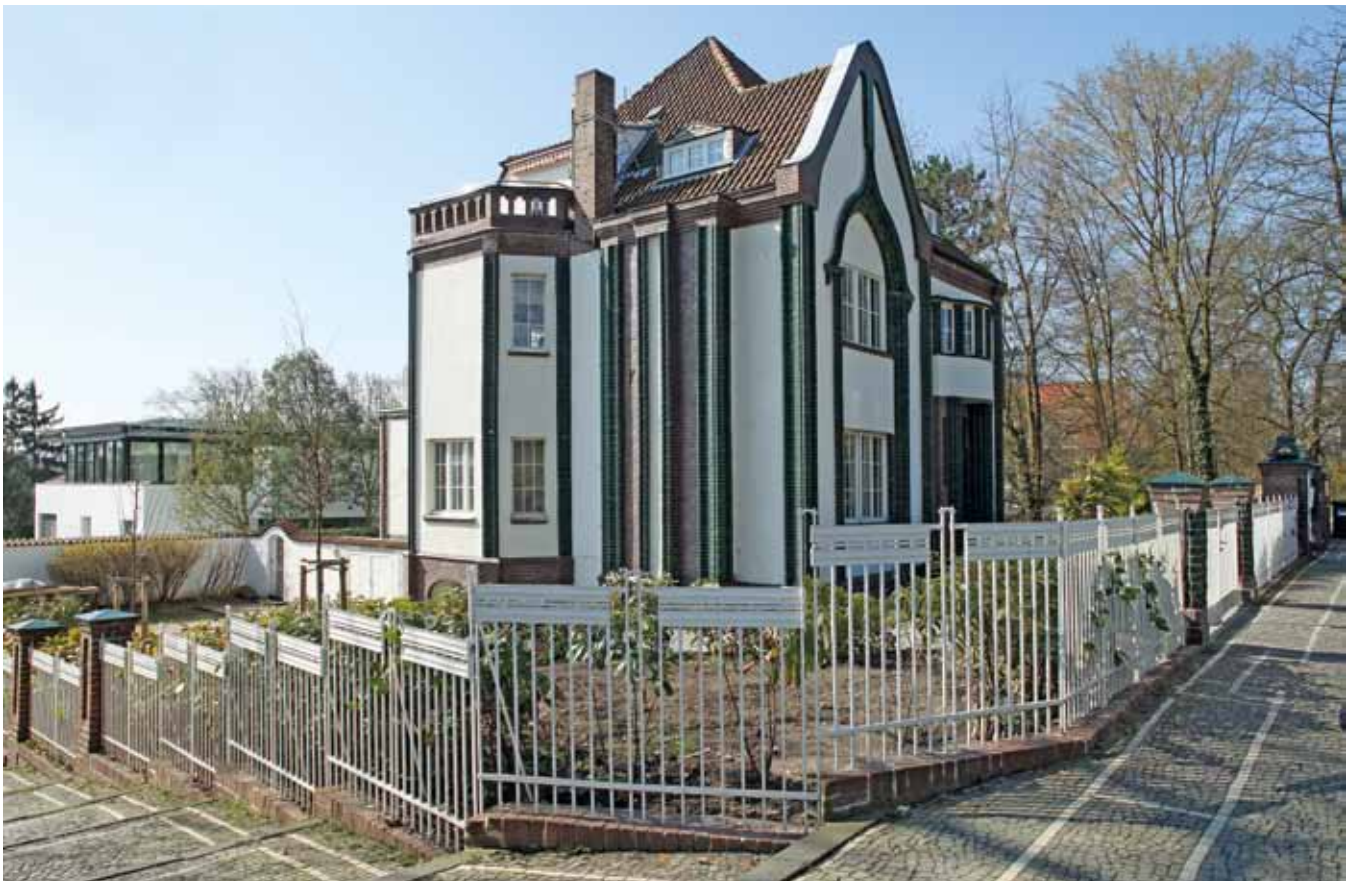
VIII Peter Behrens, Haus Behrens, 1901 (Zustand 2009) Peter Behrens, Behrens House, 1901 (status 2009)