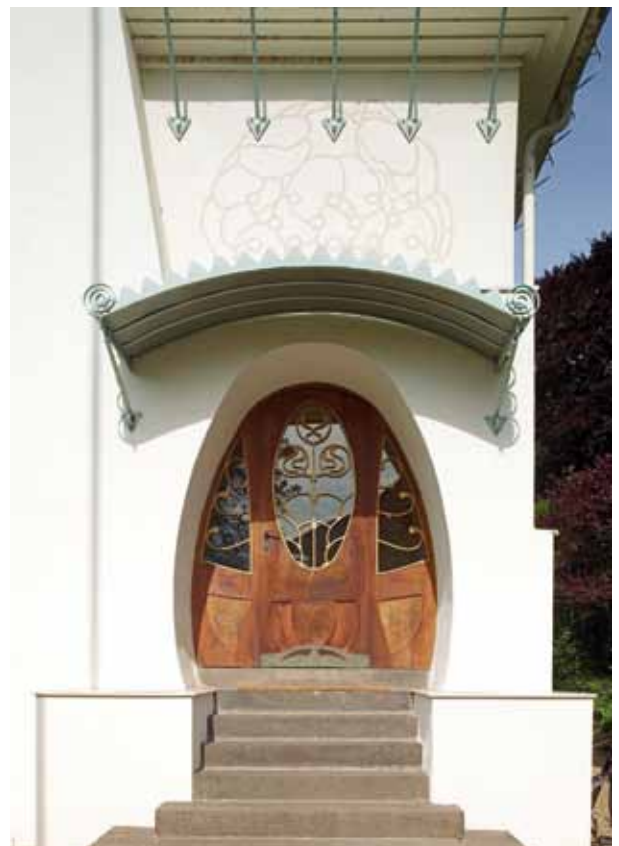
XIV Joseph Maria Olbrich, Haus Deiters, Eingang, 1901 (Zustand 2015) Joseph Maria Olbrich, Deiters House, entrance, 1901 (status 2015)