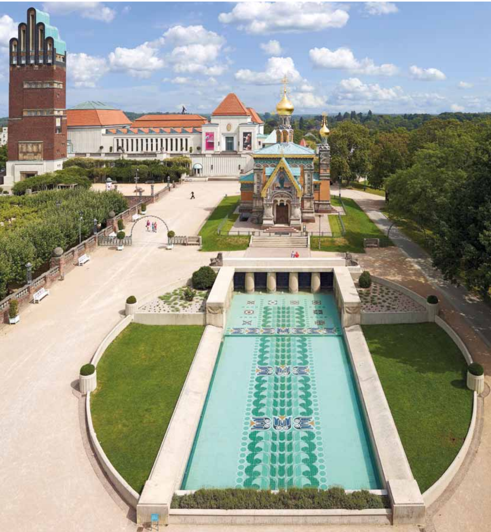
XIX Stadtkrone Mathildenhöhe (Zustand 2012) City crown Mathildenhöhe (status 2012)