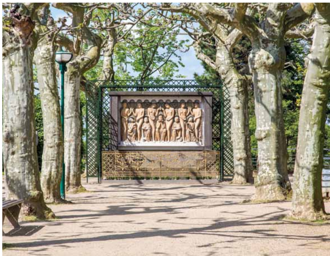
XVIII Bernhard Hoetger, Platanenhain, Relief „Sommer“, 1914 (Zustand 2015) Bernhard Hoetger, Plane Tree Grove, Relief "Summer", 1914 (status 2015)