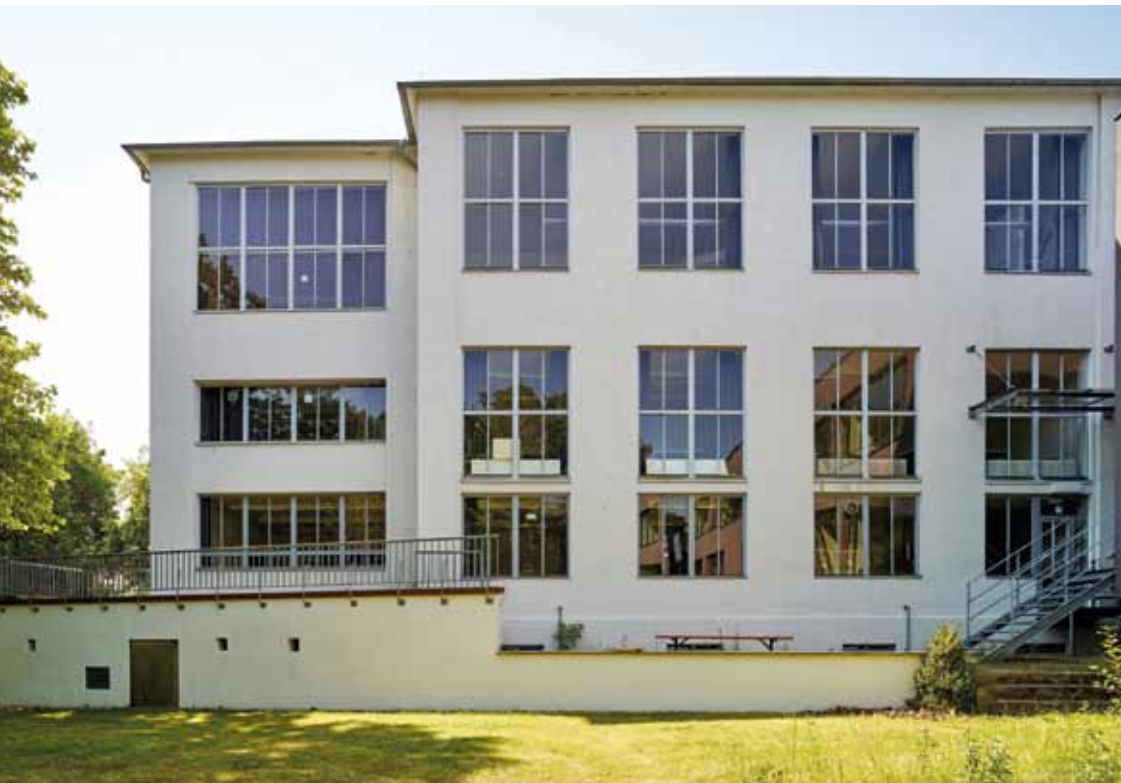
XV Albin Müller, Ateliergebäude, Nordfassade, 1914 (Zustand 2015) Albin Müller, Studio Building, north front, 1914 (status 2015)