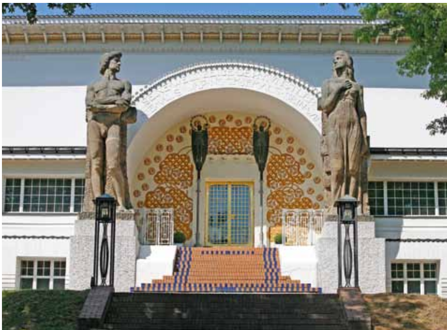
V Joseph Maria Olbrich, Ernst Ludwig-Haus, 1901 (Zustand 2015) Joseph Maria Olbrich, Ernst Ludwig House, 1901 (status 2015)