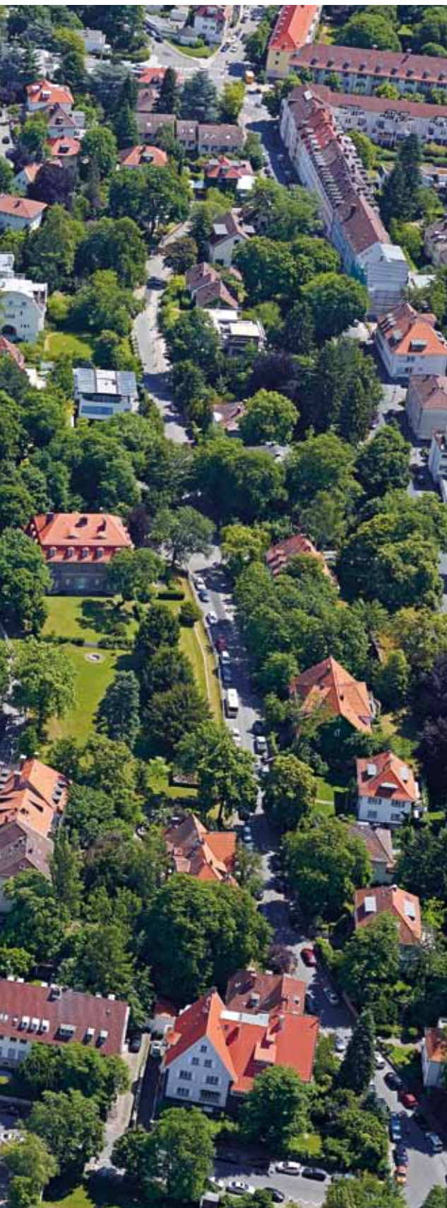
I Darmstadt, Mathildenhöhe: städtebauliche Einbindung (Zustand 2012) Darmstadt, Mathildenhöhe: urban context (status 2012)