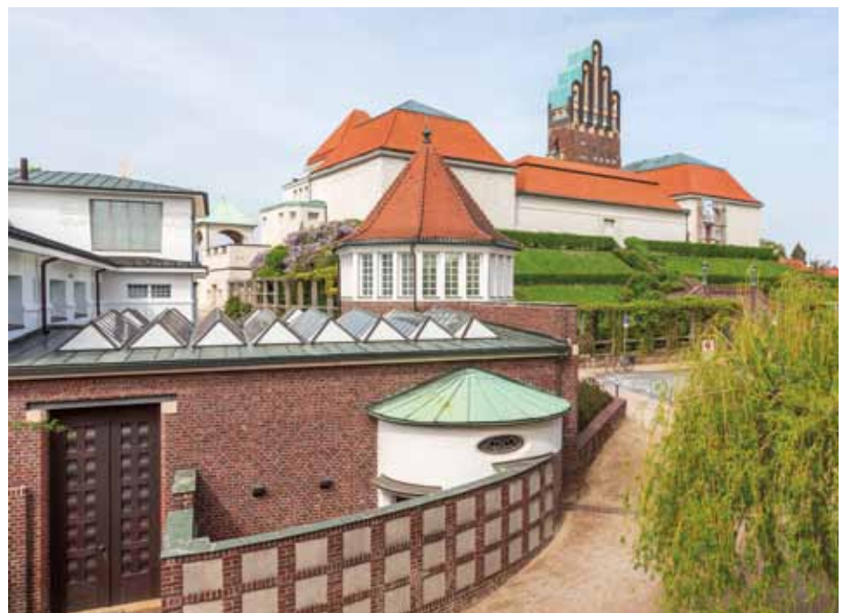
IV Joseph Maria Olbrich, Bildhauerateliers, 1904, und Ausstellungsgebäude, 1908 (Zustand 2015) Joseph Maria Olbrich, Sculptor Studios, 1904, and Exhibition Hall, 1908 (status 2015)