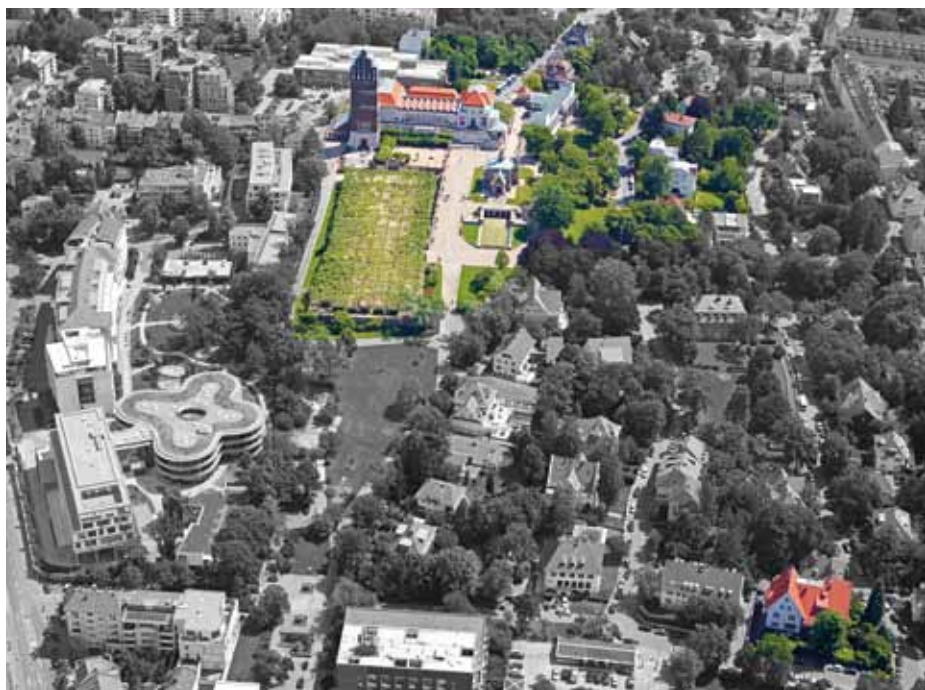
II Gebiet der Welterbenominierung (Zustand 2017) Area of the World Heritage nomination (status 2017)