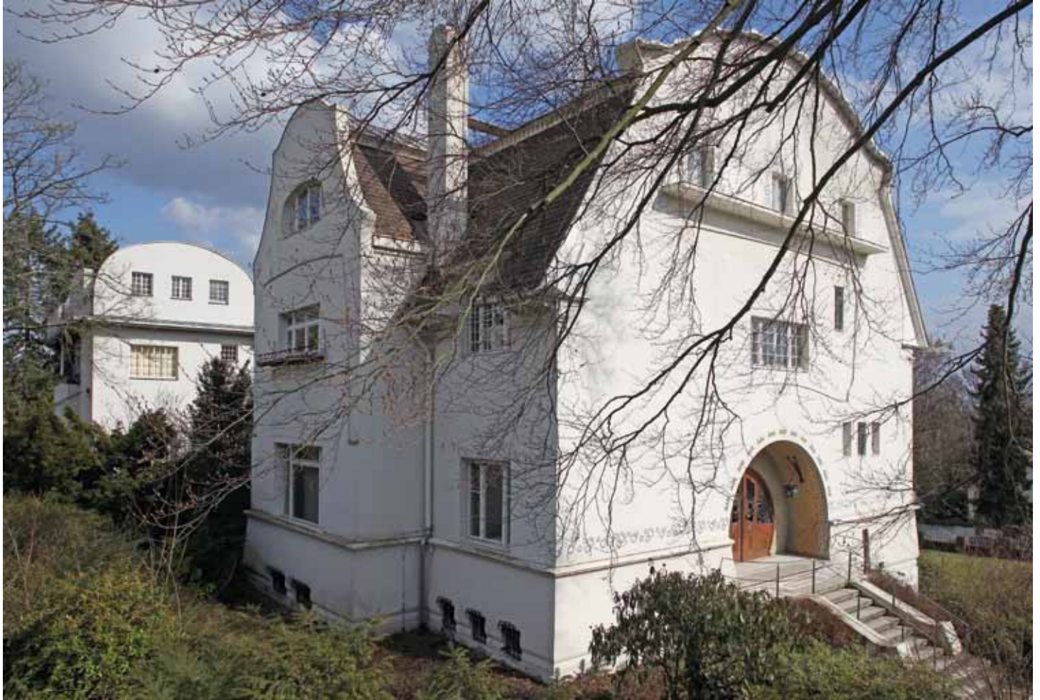
IX Joseph Maria Olbrich, Großes und Kleines Haus Glückert, 1901 (Zustand 2009) Joseph Maria Olbrich, Large and Small Glückert House, 1901 (status 2009)