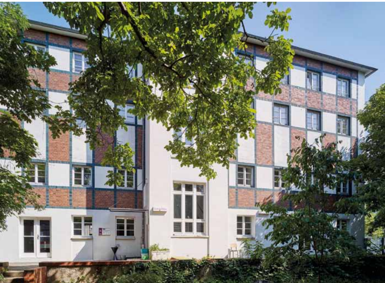
XVI Albin Müller, Ateliergebäude, Südfassade, 1914 (Zustand 2015) Albin Müller, Studio Building, south front, 1914 (status 2015)