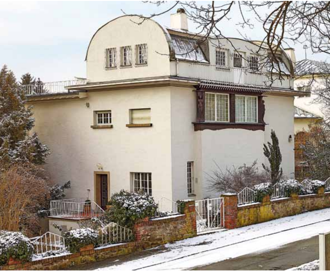
XI Joseph Maria Olbrich, Kleines Haus Glückert, 1901 (Zustand 2013) Joseph Maria Olbrich, Small Glückert House, 1901 (status 2013)