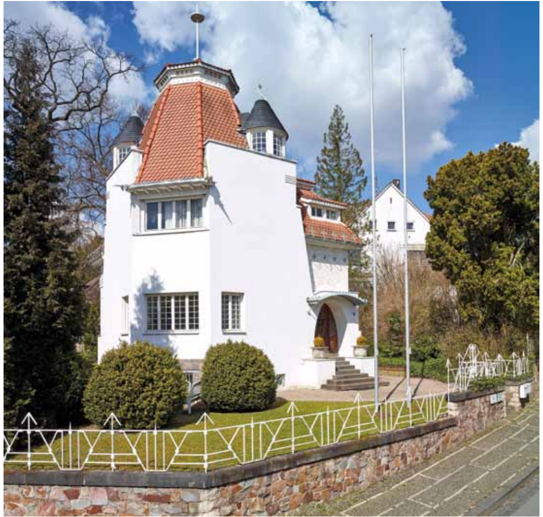
XIII Joseph Maria Olbrich, Haus Deiters, 1901 (Zustand 2015) Joseph Maria Olbrich, Deiters House, 1901 (status 2015)