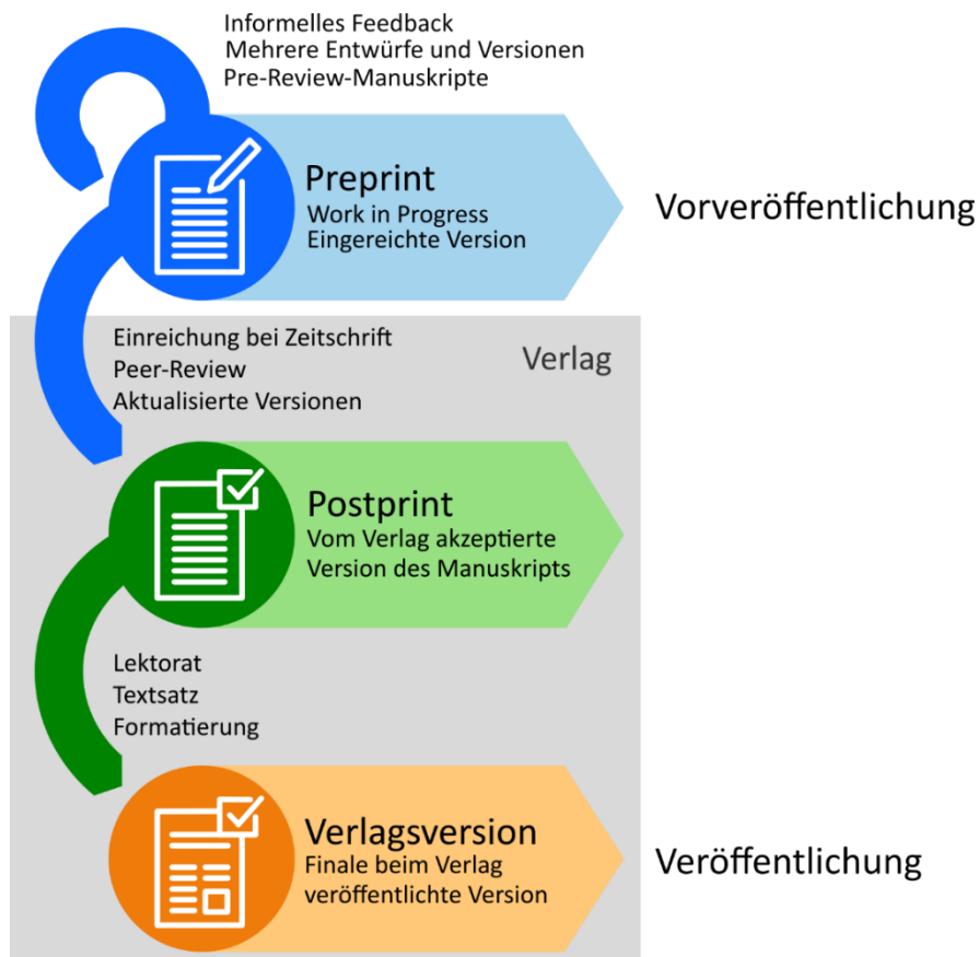
Abbildung 1: Erläuterung des klassischen verlagsgebundenen Publikationswegs (von oben nach unten) bei einer begutachteten Fachzeitschrift mit den wichtigsten Begriffen und Manuskriptversionen. Es handelt sich um eine übersetzte und adaptierte Darstellung einer Abbildung von Thomas Shafee, die auf einer Abbildung von Ginny Barbour beruht und unter einer CC BY 4.0 Lizenz veröffentlicht wurde. 9