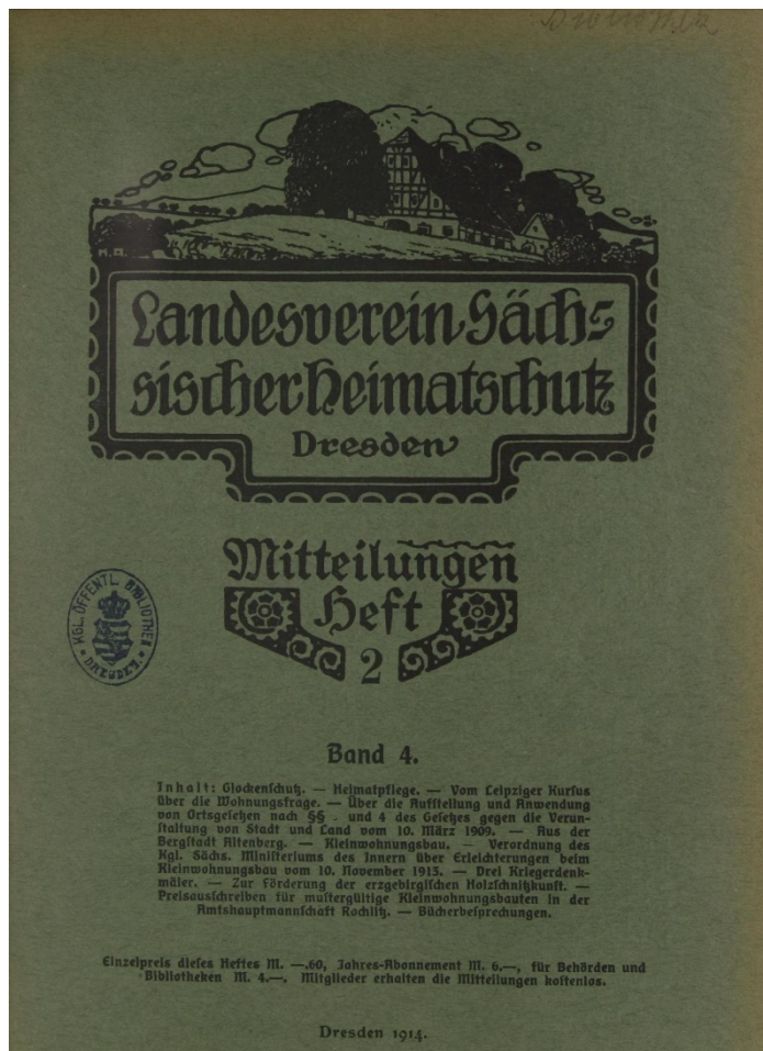
Abb. 3: Titelblatt einer historischen Ausgabe der ‚Grünen Hefte‘ des Landesvereins Sächsischer Heimatschutz

An die Stelle der bürgerlichen Vereine bezüglich der Beschäftigung mit Geschichte und Kultur trat in der DDR der ‚Kulturbund zur demokratischen Erneuerung Deutschlands‘ als sozialistische Massenorganisation mit untergeordneten Bezirks- und Kreisverbänden sowie angeschlossenen Organisationen, in denen zahlreiche der früher aktiven Akteur*innen unter neuen Vorzeichen und mit anderen Schwerpunkten ihre Arbeit fortsetzten. Trotz der Auflösung der Länder 1952 konnte so in begrenztem Maß an die Beschäftigung mit deren Traditionen angeknüpft werden, wobei zugleich ein neuer, „sozialistischer“ Heimatbegriff geprägt werden sollte. In diesem Kontext entstanden 1955 aus den bis dahin getrennt erscheinenden ‚Heimatkundlichen Blättern‘ für die Bezirke Dresden, Karl-Marx-Stadt und Leipzig die ‚Sächsischen Heimatblätter‘ (SHB), die bis 1990 im Verlag des Kulturbunds des Bezirks Dresden erschienen und sich rasch zu einem wichtigen Publikationsorgan für die orts- und landeshistorische Forschung unter den neuen Vorzeichen entwickelten – mal mehr, mal weniger stark ideologisch geprägt durch die Vorgaben einer „marxistischen“ Geschichtswissenschaft (Bräuer