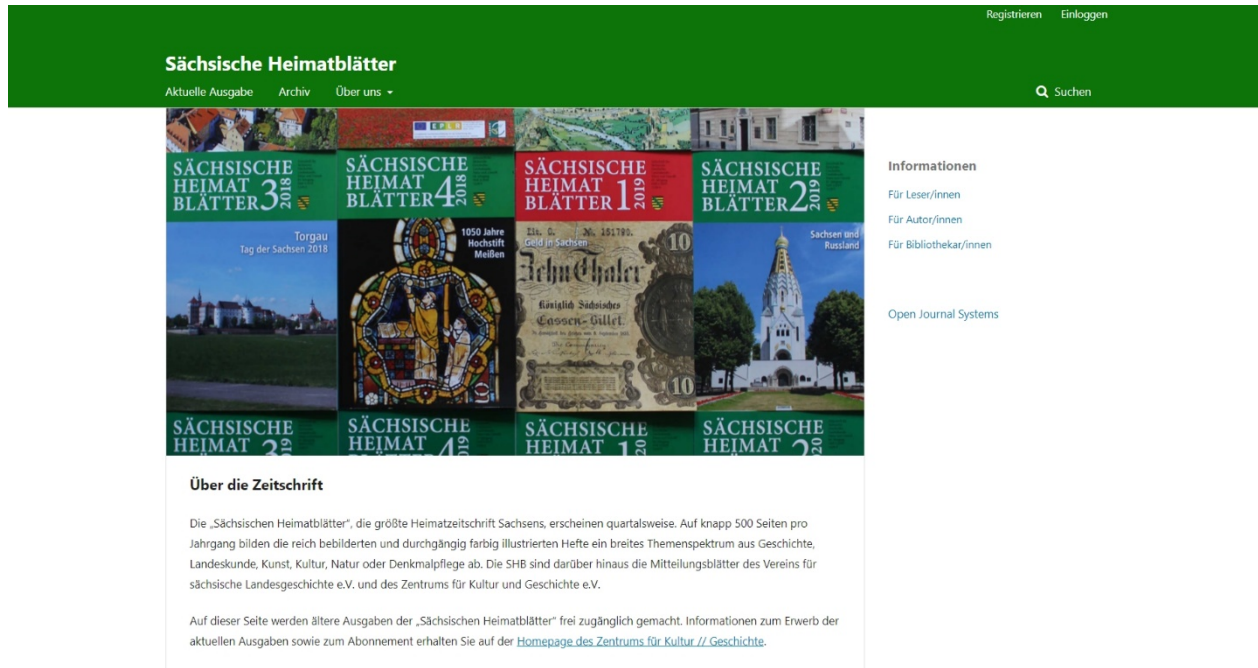
Abb. 4 Startseite der Präsentation der ‚Sächsischen Heimatblätter‘ in Qucosa.Journals

schrift Sachsens und die führende Fachzeitschrift für sächsische Landesgeschichte Teil von ‚Qucosa.Journals‘. Die Aufnahme weiterer, vergleichbarer renommierter Zeitschriften ist in Vorbereitung: mit den Herausgebern von ‚Neuem Lausitzischem Magazin‘ und ‚Mitteilungen des Landesvereins Sächsischer Heimatschutz‘ befindet sich die Bibliothek in fortgesetzten Gesprächen, im ersten Fall fanden bereits technische Prüfungen statt. Auch für die ‚Dresdner Hefte‘ gibt es erste Überlegungen, wobei in diesem Fall der Delayed Open Access mit einem digitalen Zugang auch zu den aktuellsten Heften für zahlende Abonnenten verbunden werden soll.