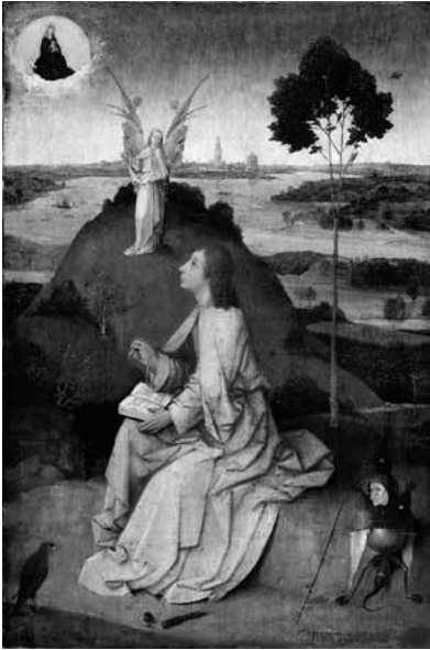
Hieronymus Bosch: Johannes auf Patmos, um 1505, Öl auf Holz, 63 x 43,3, Berlin, SMPK, Gemäldegalerie (S. 33)