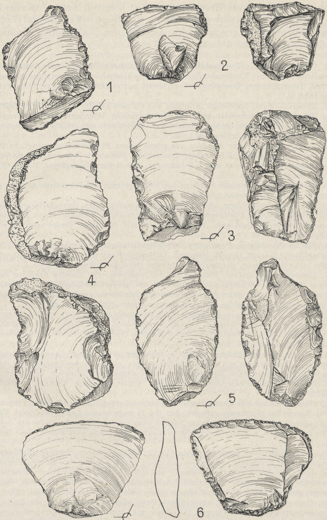
Abb. 3. Wallendorf, Kr. Merseburg. Feuersteinartefakte, Clactonien. 2:3