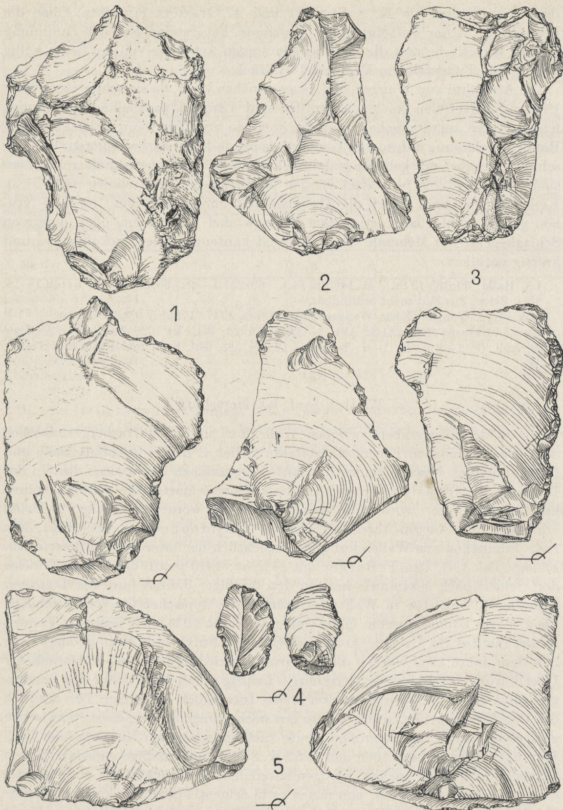
Abb. 2. Wallendorf, Kr. Merseburg. Feuersteinartefakte, Clactonien. 2:3