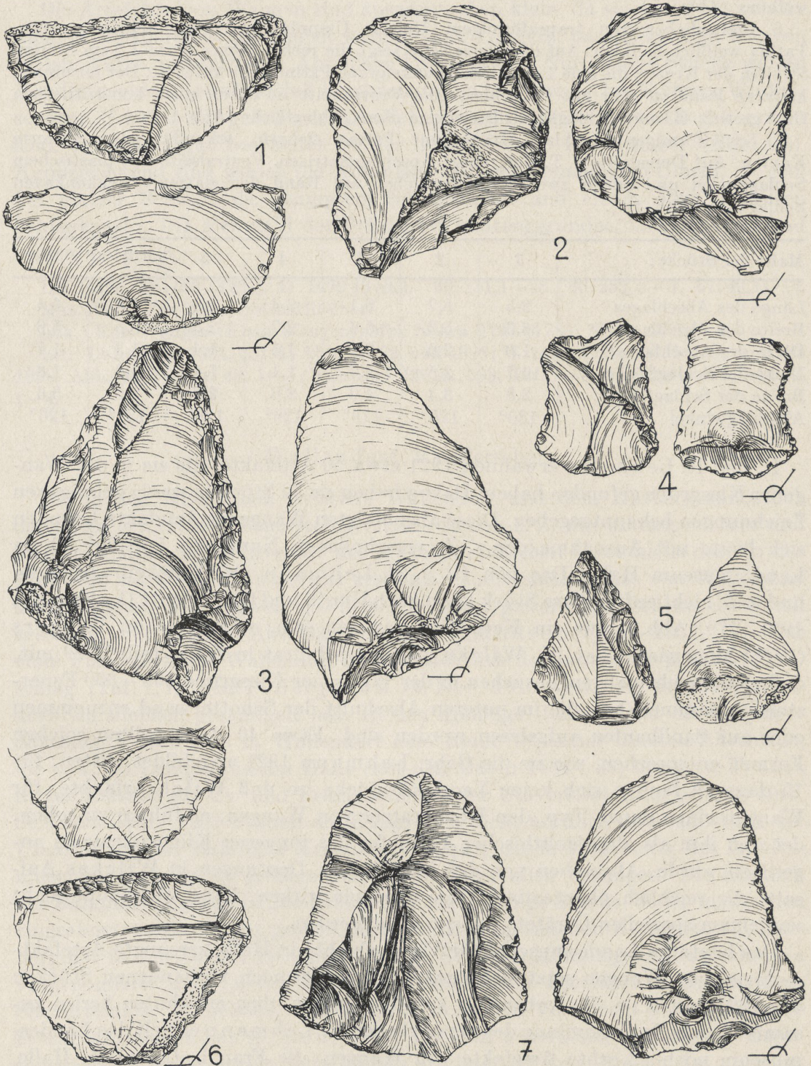
Abb. 1. Wangen, Kr. Nebra. Feuersteinartefakte, Clactonien. 2:3

3. Dicker, spitzer Abschlag mit retuschierten Schaberkanten. Gelblichweiße, porzellanartige, dicke Patina. Rezente Randaussplitterungen, hellblau patiniert. Auf der Dorsalseite und an der Basis neben der konkav geformten Schlagfläche Rindenreste des Feuersteinknollens (Abb. 1, 3).