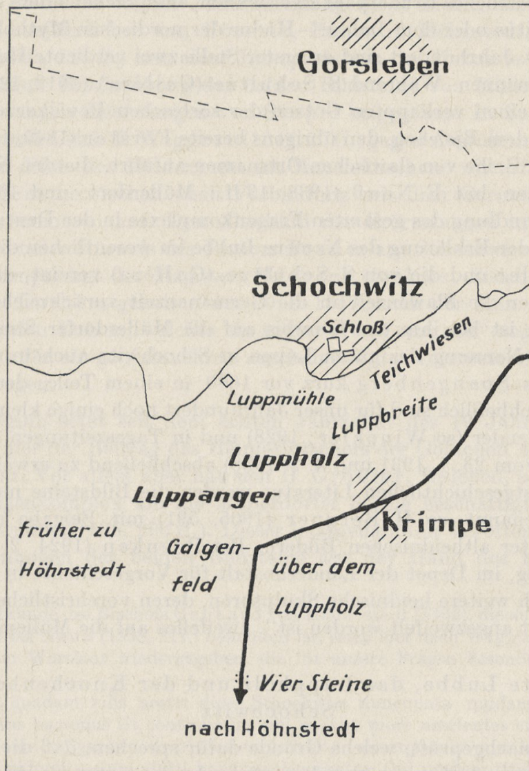
Abb. 1. Schochwitz, Saalkreis (Ausschnitt nach Flur- und Wüstungskarte Hist. Komm. Prov. Sachsen). 1:25 000

Name bisher nicht gedeutet ist (Ulbricht, 1957, 249). Sein Lauf führt über Müllerdorf und Zappendorf zur Salzke, die sich bei Salzmünde mit der Saale vereint. Südlich der Lawecke bei Schochwitz steigt das Gelände zu einer Hochfläche an, an deren Rande das kleine, früher zur Herrschaft Schochwitz gehörende Dorf Krimpe liegt, von dem aus die heutige Landstraße über die junge Siedlung Boltzenhöh südwärts nach Hohnstedt führt. Der Abhang zwischen