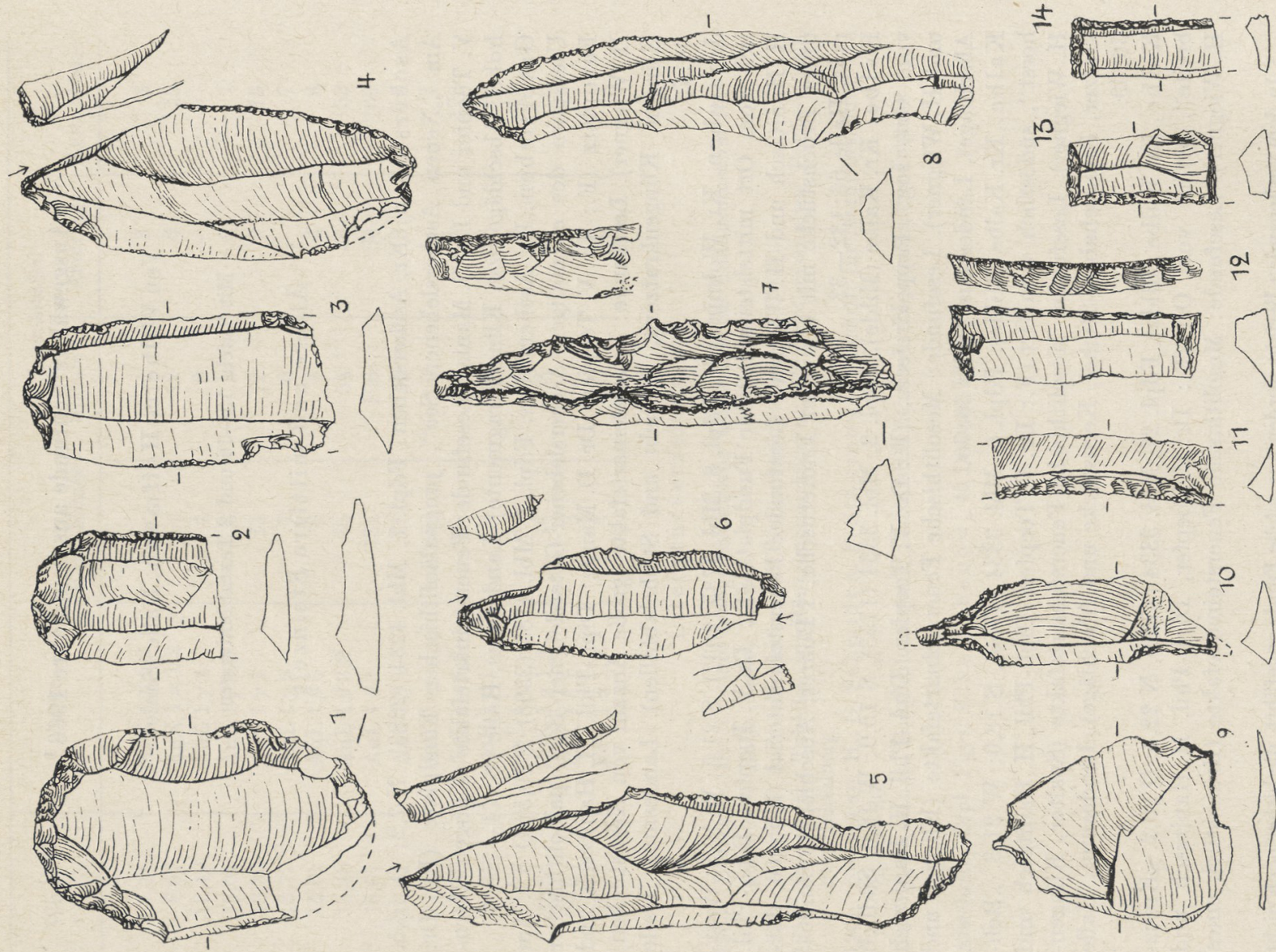
Abb. 1. Lengefeld, Kr. Naumburg. Spätpaläolithische Feuersteingeräte. 1—3 Klingenkratzer, 4—6 Stichel, 7—8 Zinken, 9—10 Bohrer, 11—14 Rückenmesser. 1:1