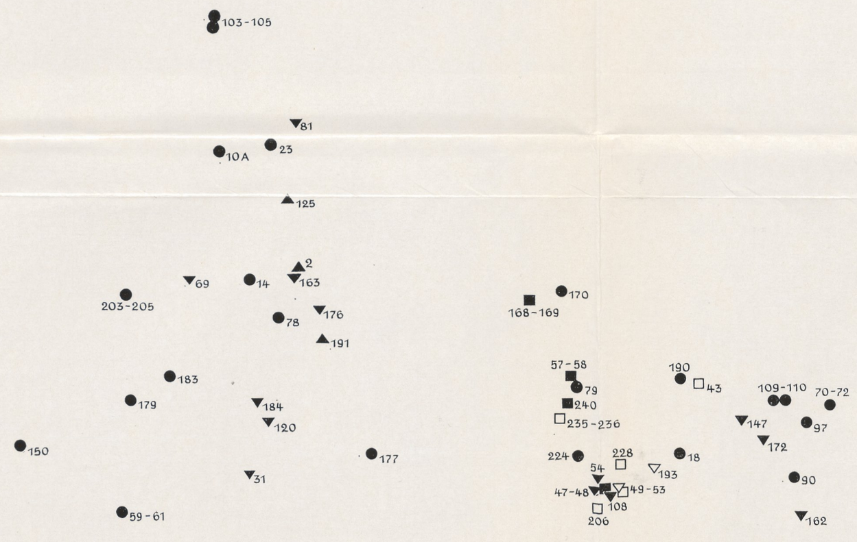
Karte 4. Ausstattungsfunde ▲ Schmuck und Waffen ▼ Schmuck und Geräte ● „reine“ Schmuckfunde □ Schmuck, Waffen und Geräte ▽ Schmuck, Geräte und Gußreste ■ Schmuck, Waffen, Geräte, Gußreste