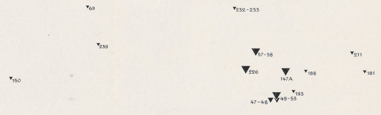
Karte 5. Bruchherzfunde ▼ mit 2-10 ▼ mit 11-20 ▼ mit mehr als 20 Gegenständen