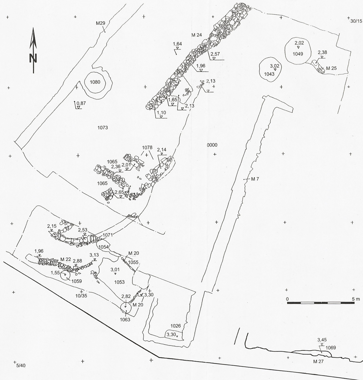
Jahresschrift für mitteldeutsche Vorgeschichte 81, Halle (Saale) 1999 Beilage 7 (zu Aufsatz Petzschmann): Naumburg (Saale), Ldkr. Burgenlandkreis, Othmarsweg. Phase 4, Siedlungsbefunde am Hang mit Angabe der Befundnummern (s. Text). Höhenangaben zzgl. 120 m üNN