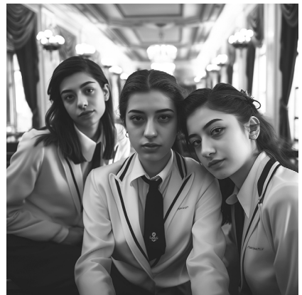
4 Maren Burghard (Prompt), Token of Shattered Dreams , 2023, KI-generiertes Bild