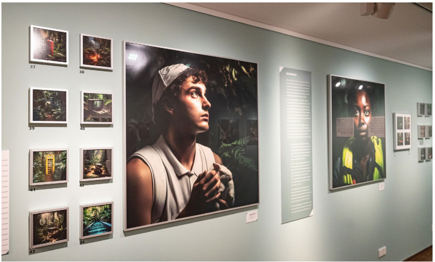
1 Ausstellungsansicht, New Realities – Wie Künstliche Intelligenz uns abbildet , 2023, Museum für Kommunikation Nürnberg

Die Menschen formen und gestalten KI ganz wesentlich mit. Das verdeutlicht auch die in der Ausstellung präsentierte KI-Kunst . 2 So erforschen wir im vorliegenden Beitrag ausgehend von der Ausstellung und der darin gezeigten KI-Kunst das Erkenntnispotential KI-generierter Bilder im Hinblick auf visuelle Ungerechtigkeit. 3