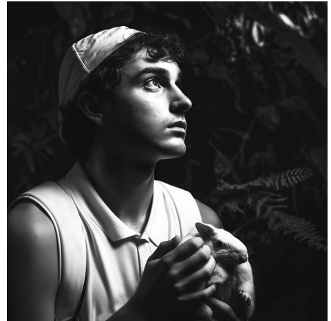
5 Maren Burghard (Prompt), Looking Beyond Sight , 2023, KI-generiertes Bild

Auch im Entstehungsprozess selbst können Ungleichheiten eingeschrieben sein. Die Zusammensetzung und das kulturelle Verständnis der Entwicklungsteams sind