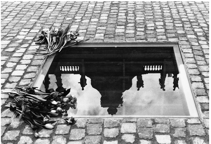
1 Micha Ullman, Bibliothek , 1995, Bebelplatz Berlin

Das Motiv der Leere findet sich in diesem Denkmal auf drei Ebenen. Ein Loch ist in den Boden gegraben, eine würfelförmige Grube ausgehoben, ein unterirdischer Negativraum entstanden. Als nicht begehbarer Raum, der nur von außen erkundet werden kann und dem man nie ganz nahe kommt, verweist er auch auf die Schwierigkeit, sich dem Thema heute zu nähern, Jahrzehnte nach dem Geschehen. Leere Regalwände wiederum sind Sinnbild für den durch Verbrennung