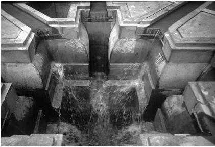
3 u. 4 Horst Hoheisel, Negativform des neuen Aschrottbrunnen , 1987, Kassel