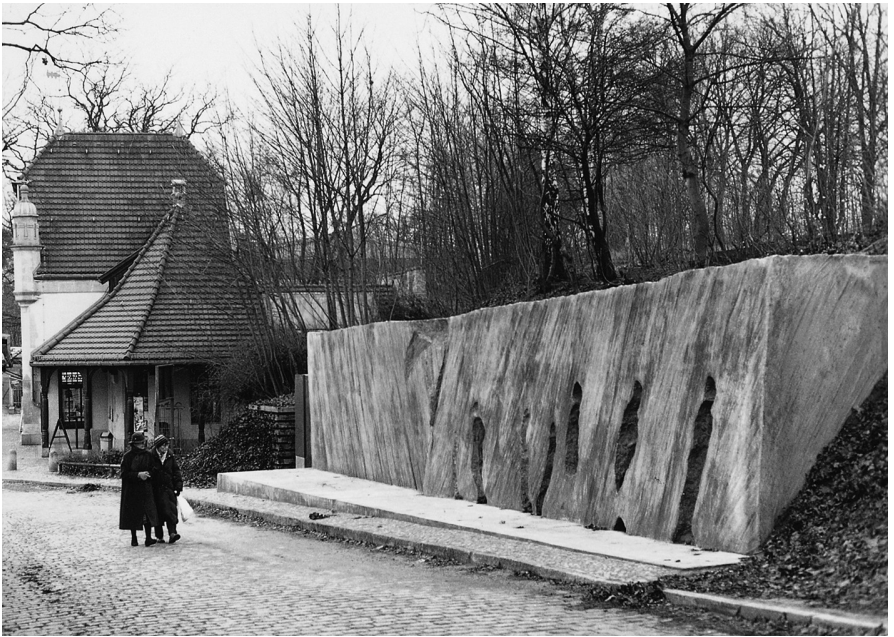
7 Karol Broniatowski und Ralf Sroka, Deportations-Mahnmal Bahnhof Grunewald , 1991, Berlin

ßenverlauf mit einer großen Betonwand nach, die Assoziationen an eine Klage-mauer hervorrufen könnte (Abb. 7). In ihr sind abstrahierte Negativformen menschlicher Körper eingelassen, die den Eindruck erwecken, als seien die Gestalten von Beton übergossen und eingeschlossen, später aber durch Auseinanderbrechen des Blocks wieder freigelegt worden. So hat es den Anschein, als existierten sie als immaterielle, silhouettenhafte Wesen weiter.