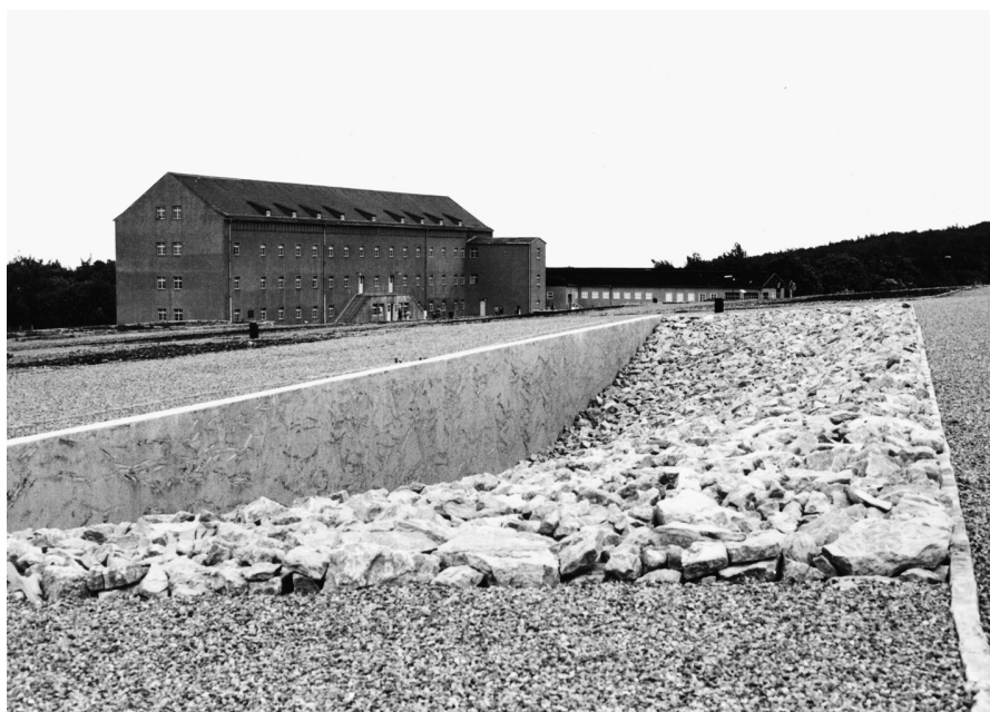
6 Tine Stehen und Klaus Schlosser, Jüdisches Mahnmal , 1993, Buchenwald

werden. In der KZ-Gedenkstätte Buchenwald hingegen entstand eine eindrucksvolle Negativform des Totengedenkens vor einem ganz anderen Hintergrund. An der Stelle des ehemaligen ‚jüdischen Blocks‘ wurde 1993 nach einem Entwurf von Tine Stehen und Klaus Schlosser die Grundfläche der Baracke ausgehoben, der Boden mit Brocken aus dem Buchenwalder Steinbruch bedeckt und die Stütz- und Inschriftenwand mit israelischem Olivenholz gestaltet (Abb. 6). Ideen gebend war hier vermutlich die ‚80-Zentimeter-Regel‘ der Gedenkstätte Buchenwald: kein neues Element, auch kein Denkmal, darf höher sein, um den freien Blick über die leere Fläche des historischen Barackenlagers nicht zu beeinträchtigen.