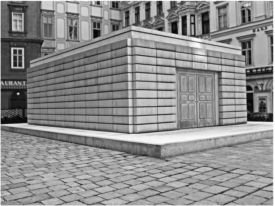
9 Rachel Whiteread, Namenlose Bibliothek , 2000, Wien

das Wiener Denkmal für die jüdischen Opfer des NS-Regimes in Österreich, die Namenlose Bibliothek von Rachel Whiteread aus dem Jahr 2000 (Abb. 9). Im Erdreich unter dem «Judenplatz» befinden sich noch Reste der mittelalterlichen Synagoge, was man allerdings erst beim Bau des Denkmals entdeckte. Es ist nicht – wie Micha Ullmans Berliner Bibliothek – in die Tiefe gebaut, sondern ragt als weißer Beton-Kubus in den Platzraum hinein. Der Innenraum ist leer, unzugänglich und nicht von außen einsehbar, die Außenhaut wird von in Beton gegossenen Bücherwänden gebildet, gewissermaßen inside out , also die Buchrücken nach innen gestellt, dem Betrachter verborgen, und die Kanten mit den geschlossenen Buchseiten nach außen. Die Bücher stehen für die zerstörte jüdische Kultur, die Leere und das Negativ-Motiv für ihre Auslöschung. Auf Bodentafeln sind die Namen der Vernichtungsstätten zu lesen, in denen österreichische Juden starben.