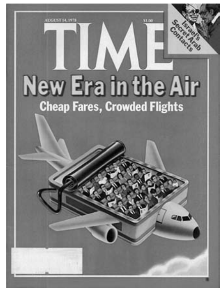
5 Time Magazine, 1978

Class auf. Ende der siebziger Jahre schließlich begannen einige Airlines, eine dritte, «Business Class» genannte Kategorie einzuführen. 25 Kurz: wo vorher die Grenze zum Luxus zwischen Fliegen und nicht-Fliegen verlaufen war, verlief sie nun zwischen den Klassen. Vorne saß man in bequemen Sesseln, streckte die Beine aus und ließ sich kleine Köstlichkeiten auf Porzellangeschirr munden – hinten zwängte man sich in enge Sitze, bekam die Rückenlehne seines Vordermanns in die Knie gedrückt und musste für alkoholische Getränke extra zahlen.