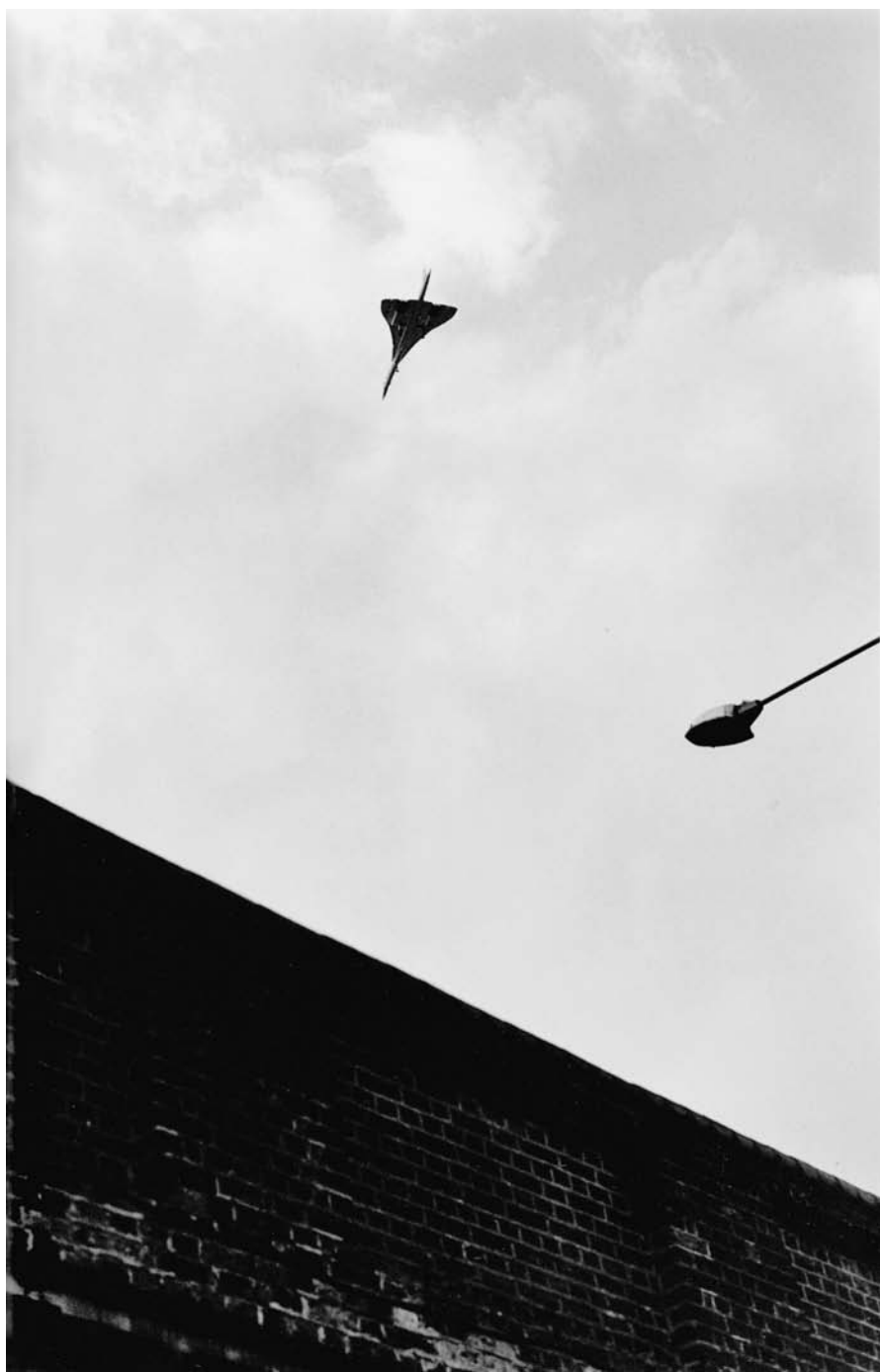
1 Wolfgang Tilmanns, Concorde L 440-14A , 1997.