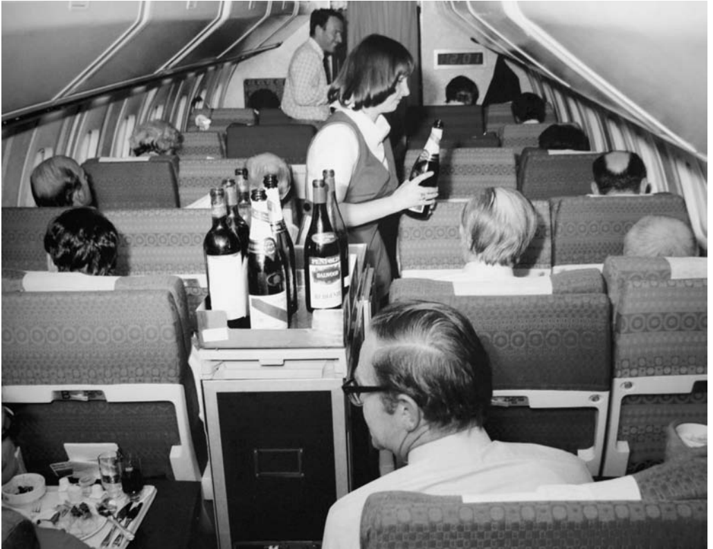
6 An Bord der Concorde, 1970er Jahre.