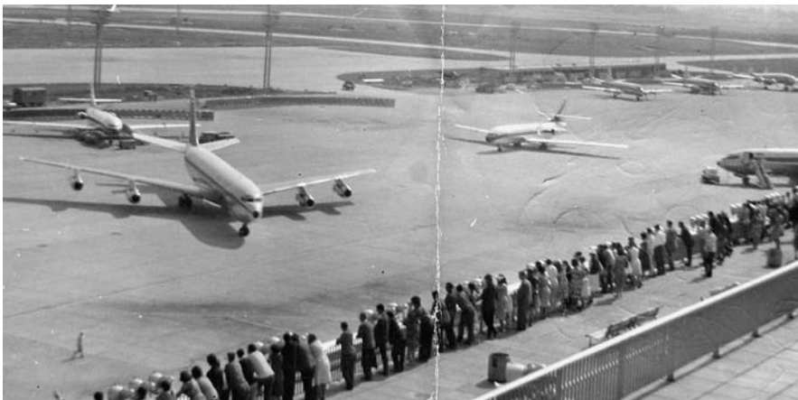
2 «Dimanches à Orly»: Besucherterrasse und Vorfeld in Paris-Orly, 1960.

Welche enorme Veränderung die Jets für den Flugverkehr bedeuteten, zeigt sich im Vergleich mit einem Artikel des amerikanischen Science News-Letter aus der Vorkriegszeit. Dort wurden 1936 Studien des MIT zum (noch Propeller-betriebenen) Flugzeug der Zukunft vorgestellt. Es würde mehr Sitze haben und durch stär-