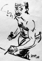
Neue Deutsche Graphik

Die neue Deutsche Graphik war eine neue Nation. Die neue Nation ist ein „New Graphic“ ist ein Begriff, beschränkt auf die neue Nation wie zuvor. Die neue Nation ist ein „New Graphic“ ist ein Begriff, beschränkt auf die neue Nation wie zuvor.