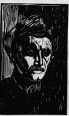
Neue Deutsche Graphik

Die neue Deutsche Graphik war eine neue Nation. Die neue Nation ist ein „New Graphic“ ist ein Begriff, beschränkt auf die neue Nation wie zuvor. Die neue Nation ist ein „New Graphic“ ist ein Begriff, beschränkt auf die neue Nation wie zuvor.