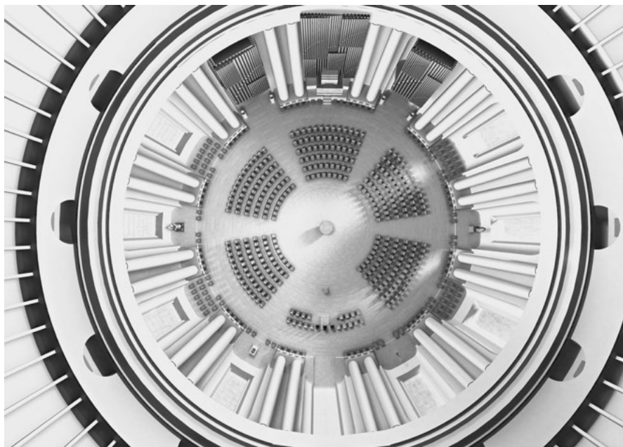
2 St. Hedwigs-Kathedrale, Berlin, Vogelperspektive auf den Innenraum