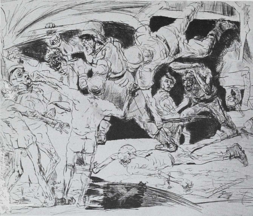
Alfred Hrdlicka, »Kap Arcona«. Radlerung (1986).