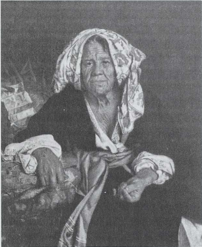
Pietro Bellotti (1627–1700): »Die Parze Lachesis«

Aber auch mit der Einrichtung der Spinn- und Arbeitshäuser blieb die Spinnproduktion hinter der Weberei zurück. Dies führte zu dem 1723 vom preußischen König erlassenen Edikt, das für alle Frauen, die nicht in Land- und Hauswirtschaft voll ausgelastet waren, den Spinnzwang einführte. Die Diskrepanz zwischen Spinnen und Weben führte im kapitali-