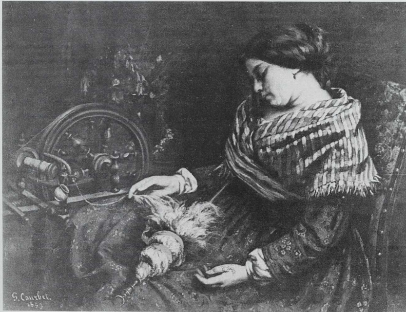
Gustave Courbet (1819–1877): »Die eingeschlafene Spinnerin«, 1853

In Millets »Die Spinnerin« (um 1855) bekommt die Arbeit des Menschen das Gewicht eines Rituals. Nach Clark (1981) erscheint die Arbeit bei Millet nicht als Prozeß, der die Umwelt verändert oder formt, er ist keine Frage des Schaffens und des Durchsetzens, sondern eine Reihe endlos wiederholter Handlungen, eine automatisch ausgeführte Aufgabe, die den Ausführenden unterjocht. Aus dem stumpfen und etwas mat-