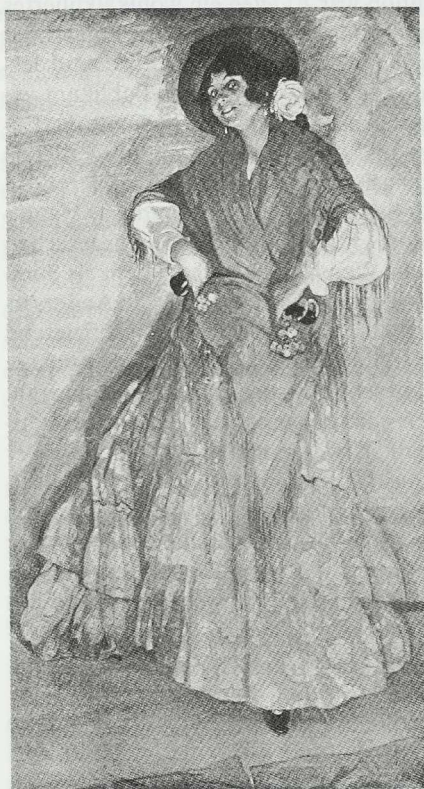
3 Ignacio Zuloaga, La Bailarina, Carmen la Gitana , Madrid 1902, Öl auf Leinwand, 181 x 100 cm, Buenos Aires, Museo de Bellas Artes (Schwarzweißaufnahme von 1912)