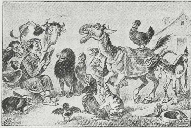
Ein Kapitel aus Darwins „Abstammung des Mausechels“.

1 »Ein Kapitel aus Darwins Abstammung des Mausechels«. Judenspottkarte aus der Sammlung Haney Berlin, um 1900. Die Verspottung jüdischer Kultur und jüdischer Eigennamen durch Tiermetaphern (Pferd mit Pejeslocken) findet sich in vielen Karten des Kaiserreiches.