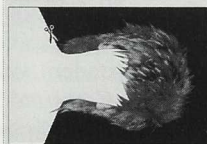
BLESS (Limited Edition) N° 00 Fits Every Style! Cut & Try.