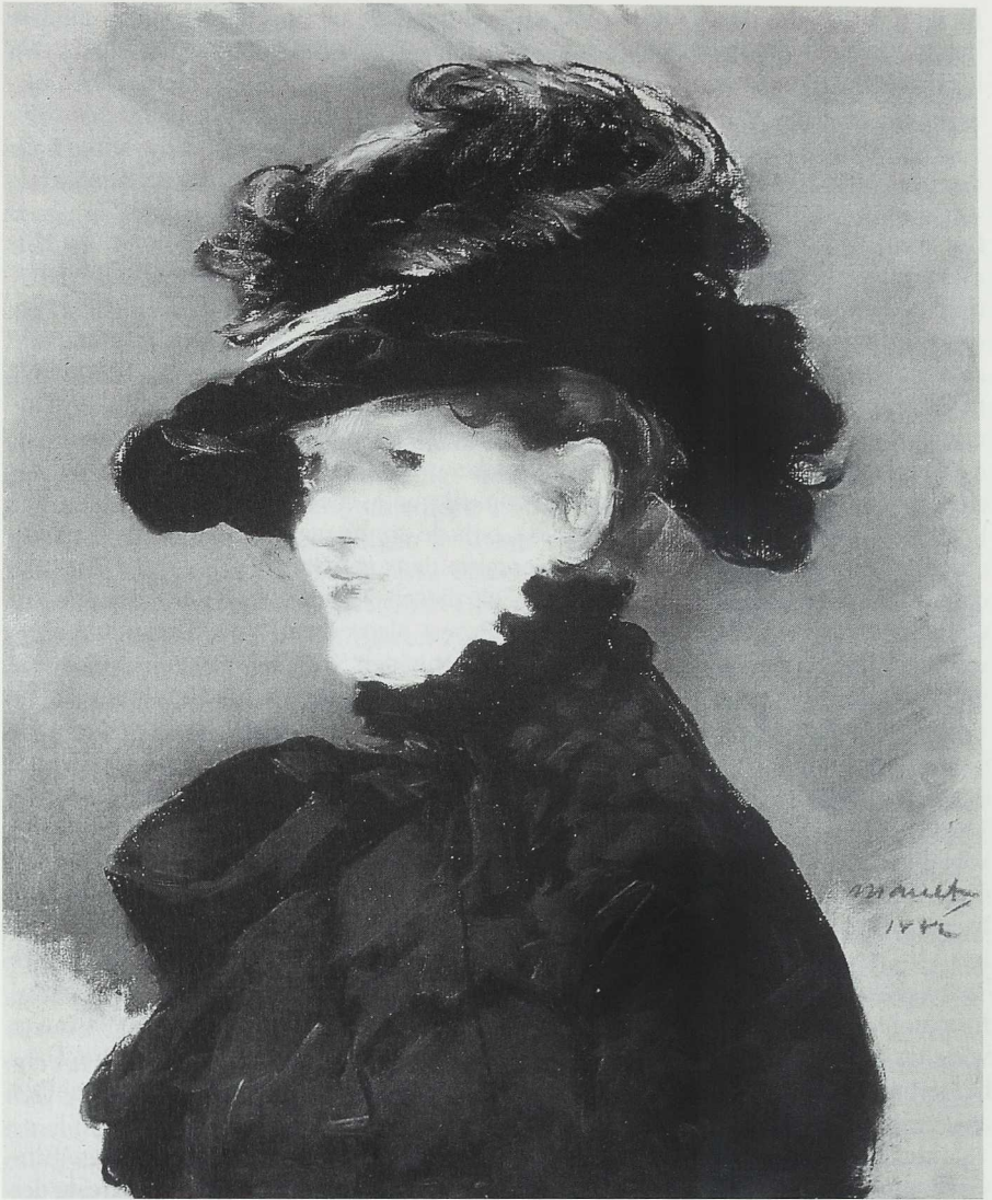
1 Bildnis Méry Laurent mit schwarzem Hut, 1882, Pastel, Musée des Beaux-Arts, Dijon

männliche Maler kann nur geben, was er hat, das allerdings nur in der Verkleidung des anderen Geschlechts. Manets Utopie von der Rezeption und Gabe seiner Kunst als wohlwollend und – wie ich versucht habe zu zeigen – explizit weiblich führt zur spielerischen Anerkennung und Imagination der eigenen Effeminierung. Wenn der ideale Betrachter als weiblich und die beschenkte Betrachterin als Geberin imaginiert wird, erfährt auch die unter diesen Bedingungen entstandene Malerei eine – im Horizont der Kunstkritik des 19. Jahrhunderts – geschlechtliche Beugung.