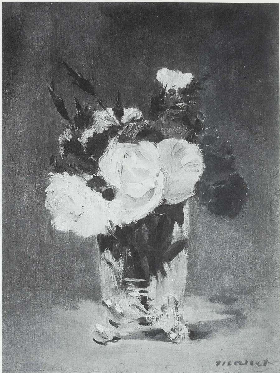
3 Blumen in einer Kristallvase, um 1882, Öl auf Leinwand, National Gallery of Art, Washington.

buchstäblich gemeint, denn bei der kleinen hellblauen Broschüre, die im Stilleben rechts hinter dem etwas steif posierenden Zola erscheint, handelt es sich um die 1867 herausgebrachte Streitschrift. »Manet« kann man darauf lesen, Titel der Streitschrift und Signatur des Bildes in einem; um den Namen des Autors zu ent-