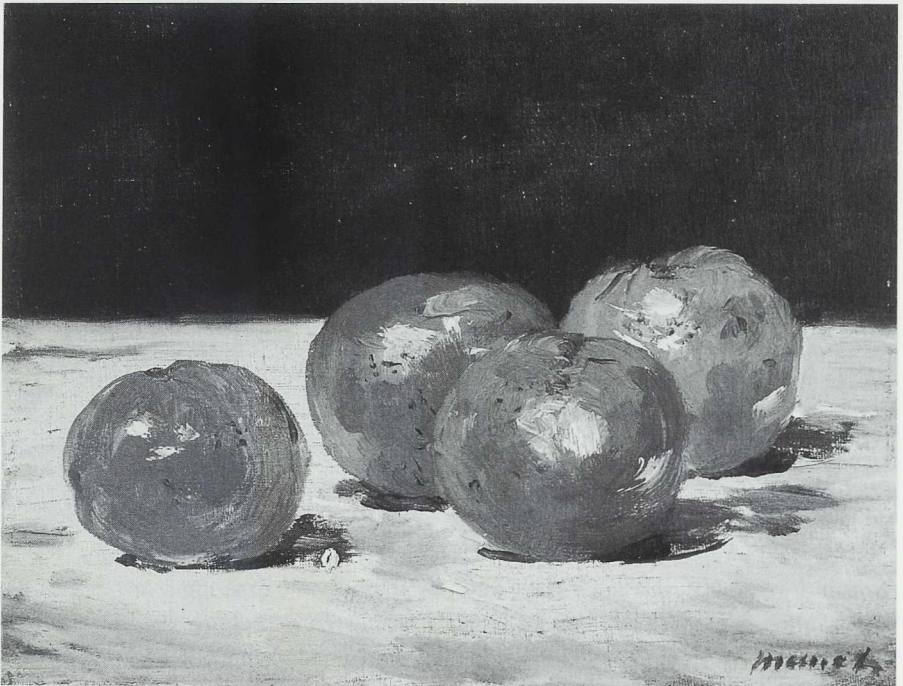
2 Mandarinensstillleben, 1882, Öl auf Leinwand, Pivatsammlung, Chicago.

Als besonders signifikantes Beispiel für die Funktion des Gabentausches im Beziehungsgeflecht der männlichen Avantgardekünstler kann Manets Freundschaft mit Zola gelten. Als am 1. Januar 1867 die erste umfangreiche Würdigung der Malerei Manets erscheint, bedankt sich der Maler tags darauf überschwenglich beim Autor Zola für dessen »Neujahrsgeschenk«. 13 Der Logik des Geschenks entsprechend muss diese Gabe eine Gegengabe finden, mit etwas vergolten werden, das die Schuld aufhebt und den Freund wiederum in neuer Weise verpflichtet. Das Bildnis Émile Zolas (Abb. 4) ist jenes Geschenk. 14 Zolas kunstkritisches Portrait Édouard Manet, étude biographique et critique bereitet das gemalte Bildnis vor, das gemalte Bildnis allerdings schließt sein literarisches Gegenstück ein. Das ist