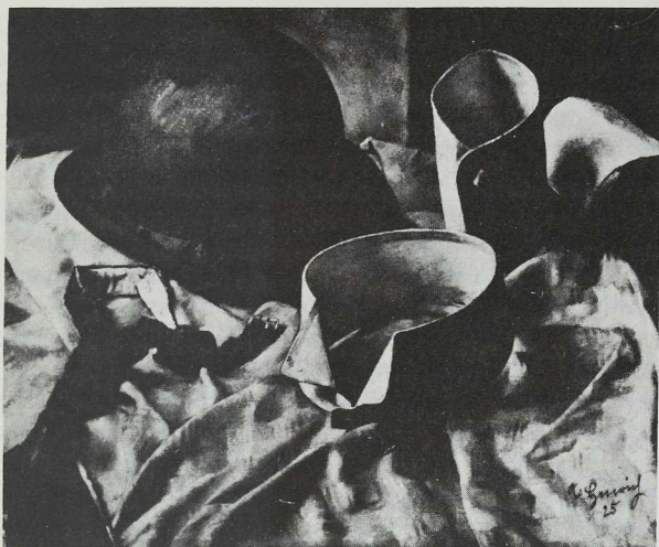
„Stilleben mit Kragen und Hut“ (1925)