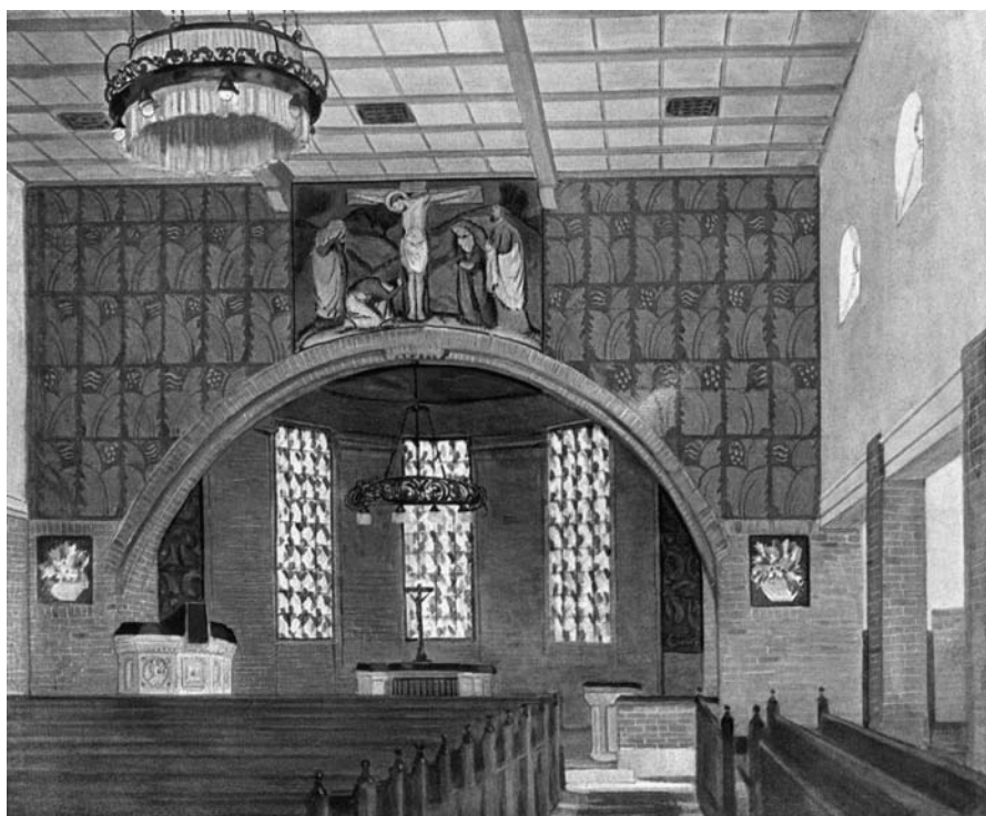
1 Innenraum Eberhardskirche Tübingen 1911 mit Altarbild von Käthe Schaller-Härlin nach einem Aquarell von Kunstmaler Nicolaus

von Emporen den zur «architektonischen Form gewordene[n] Wille[n] der Gemeinde» repräsentieren sollte. 6