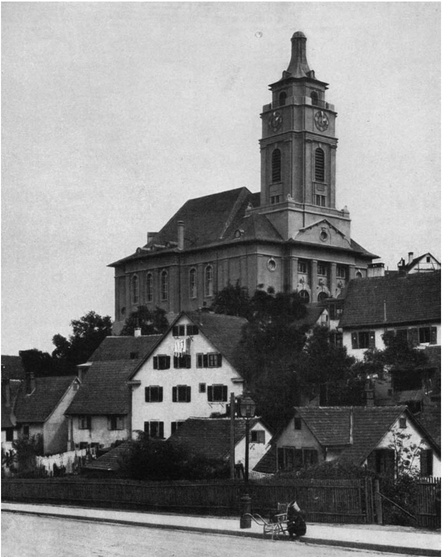
3 Ev. Stadtpfarrkirche Gaisburg-Stuttgart 1913

schen Kursus für Kultur und Kunst» in Marburg gehalten hatte. 26 Die «Hauptzweckbestimmung» der Kirche sah er in einem multifunktionalen, «halb schon etwas Weltliches» verkörpernden Predigtraum. Dafür könnte man «umso stärker einen kleinen sakralen Raum nun wirklich mit dem Geiste füllen», der Taufen, Trauungen und Abendmahl vorbehalten wäre. 27 Nur durch die Wahl der Dimensionen, durch die Konstruktionsbeherrschung und räumliche Gestaltung sollte ein überzeugend religiöser Ausdruck geschaffen werden. Als Konsequenz forderte er für die äußere Architektur die Aufgabe monumentaler Größe und – für die Stadt – den Verzicht auf den Kirchturm. 28 Damit würde eine im Gesamtbau durch «Helligkeit, Licht, Wohnlichkeit, schlichte Größe» betonte Verinnerli-