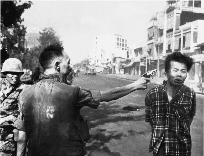
2 Eddie Adams: Hinrichtung in Saigon: General Nguyen Ngoc Loan erschießt einen vermeintlichen Vietcong in Saigon. (AP) 1968