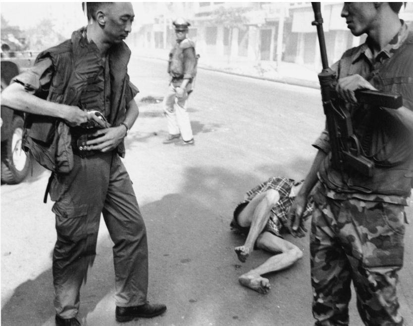
3 Eddie Adams: Der exekutierte Vietcong fällt tot zu Boden. 1968