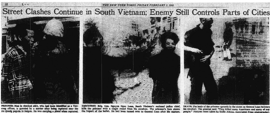
5 New York Times, Seite 12, 02.02.1968, Fotoserie von Eddie Adams.

Thema »Vietnam« gewidmet und von der alle Elemente verbindenden Überschrift zusammengefasst. Ein Teil des Themenkomplexes wird auf Seite 12 fortgesetzt. Dabei handelt sich um die Hintergrundberichte. Die gesamte Seite 12 der New York Times wird von der Bilderserie Eddie Adams' (Abb. 5) und den Bildunterschriften der Erschießung eingeleitet. 43 Diese Fortsetzung bzw. die visuelle Abbildung des Kontexts der Erschießung macht es dem Betrachter möglich, sich den Ablauf der Situation bildlich vorzustellen und nachzuvollziehen.