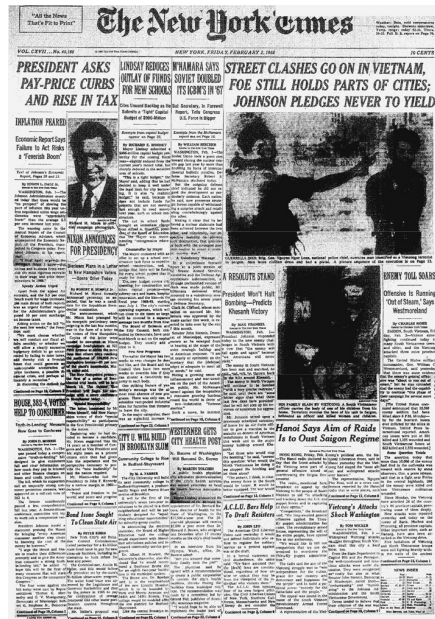
4 New York Times, Seite 1, 02.02.1968

Das Foto ist im Vergleich zum oben beschriebenen Bild beschnitten. Der Soldat am linken Bildrand sowie ein Teil des Hintergrunds am oberen Bildrand sind nicht mehr zu sehen. Das Foto beschränkt sich auf die beiden Hauptpersonen. Direkt unter der Bildunterschrift befindet sich ein weiteres Bild. Auf diesem ist ein Soldat zu sehen, der in seinen Armen ein verletztes oder totes Kind hält. Die Bildunterschrift beginnt mit den Worten: »His family slain by Vietcong« und besagt, dass die Vietcong eine Militärbasis überfallen sowie Frauen und Kinder ermordet haben. Auf der Seite 1 der New York Times finden sich weitere Artikel über das aktuelle Kriegsgeschehen in Vietnam.