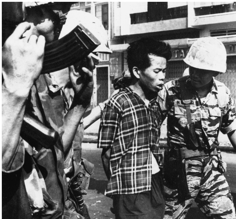
1 Eddie Adams: Zwei Soldaten führen einen vermeintlichen Vietcong in Saigon ab. 1968 (AP)

Am zweiten Tag der Tet-Offensive 1968 hatte sich der AP-Fotograf Eddie Adams 27 mit seinem Kollegen Vo Su, einem Kameramann von der NBC , verabredet, um Gerüchten über Kämpfe in Cholon, dem Chinesenviertel Saigons, nachzugehen. Als Adams und Vo Su in Cholon ankamen, waren die Kämpfe bereits abgeflaut und die beiden wollten schon umkehren, als sie mehrere Schüsse hörten. Sie beobachteten, wie zwei vietnamesische Soldaten einen jungen Vietnamesen mit auf dem Rücken gefesselten Armen aus einem Hauseingang zerrten. Die Soldaten führten ihn in die Richtung, in der sich Eddie Adams und Vo Su befanden. Eddie Adams sagte später dazu in einem Interview: »Ich verfolgte die drei mit der Kamera und machte einige Bilder. Als sie direkt vor uns standen – vielleicht zwei, drei Meter entfernt –, blieben