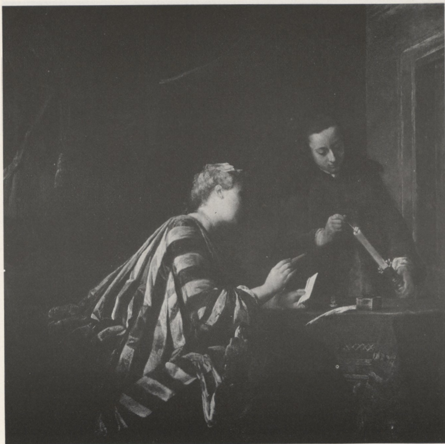
Abb. 1 Jean Siméon Chardin: Die Briefsieglerin. Berlin, Stiftung Preußischer Kulturbesitz