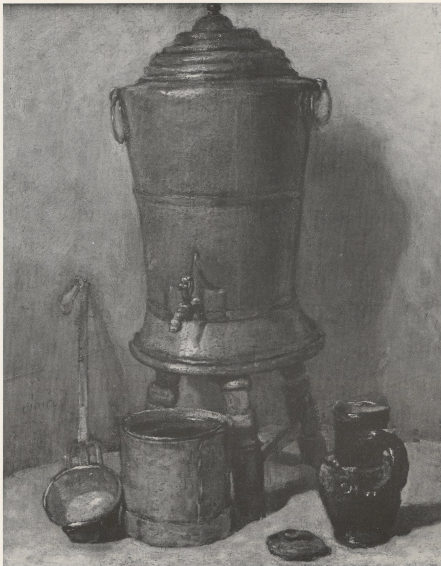
Abb. 3 Jean Siméon Chardin: „La fontaine de cuivre“. Paris, Louvre