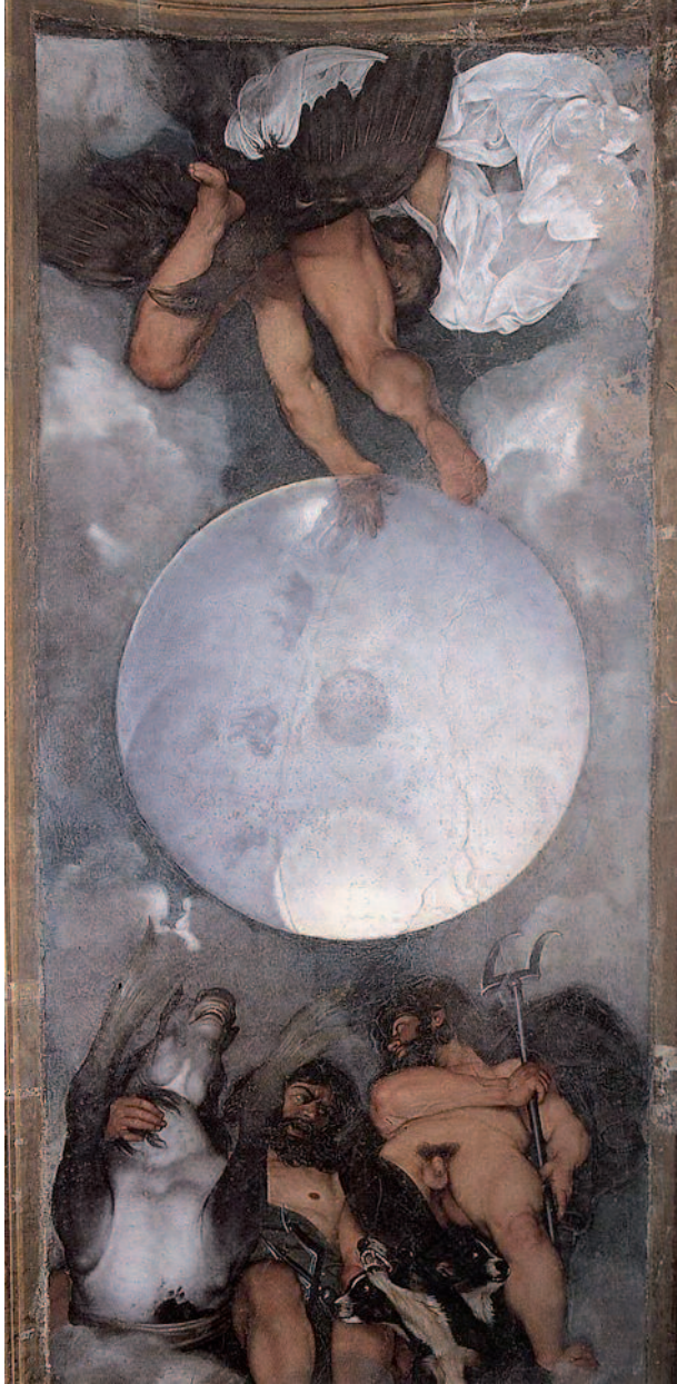
Abb. 1 Caravaggio, Jupiter, Neptun und Pluto, Wandmalerei in Öl, Rom, Casino Ludovisi ( https://commons.wikimedia.org/wiki/File:Caravaggio_Jupiter_Neptune_Pluto.jpg )

nals und Giovanni Luigi Valesio 1621 zum Sekretär des jüngeren Bruders Gregors XV. ernannt und mit stattlichen Gehältern versorgt worden waren (Morselli, 40–44; zu den Ämtern auch Gatta, 155, allerdings ist der 13. März 1621, Tag der Anstellung Violas, nicht der auf die Wahl Gregors XV. folgende Tag; Iseppi, 175). Viola, Guercino und Domenichino sowie der damals gefragteste Landschaftsmaler in Rom, Paul Bril, malten in der kleineren Sala del Caminetto (heute als Sala dei paesaggi bekannt) unter einem Puttenreigen von Antonio Circignani, gen. Pomarancio, je eine Landschaft, deren Abfolge, Analyse und Bedeutung sich der Aufsatz von Pasquale Stenta widmet. Einen genaueren stilistischen Vergleich, insbesondere von Domenichino und Viola, nimmt Francesco Gatta in seinem Beitrag vor, der eine unpublizierte Zeichnung vorstellt, deren recto er überzeugend Domenichino zuschreibt und als einen ersten Entwurf für dessen Landschaft im Casino Ludovisi identifiziert Abb. 5 , während das verso Viola gegeben wird. Valesio seinerseits führte im damaligen Bibliotheksraum an der Decke ein von Putten getragenes Ludovisi-Wappen aus (Iseppi, 175).