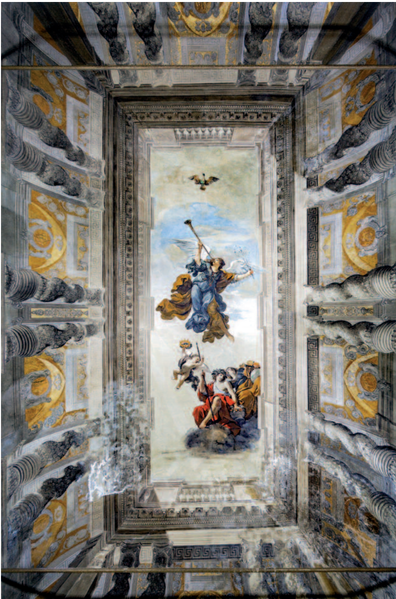
Abb. 3 Guercino, Fama mit Honor und Virtus. Rom, Casino Ludovisi (Storia dell'arte 157, 1, 2022, Tav. IV)