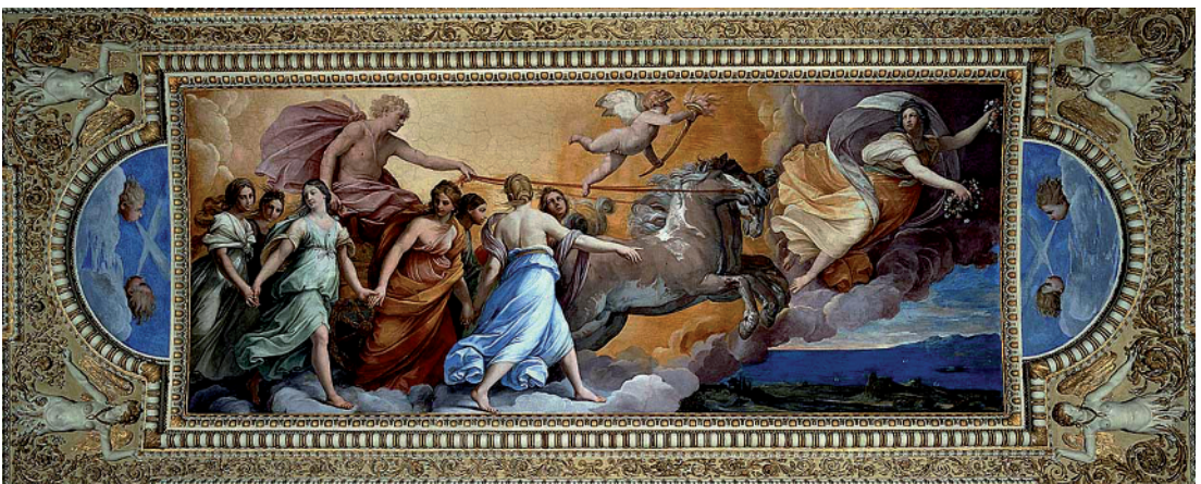
Abb. 6 Guido Reni, Aurora. Rom, Casino Pallavicini-Rospigliosi ( https://upload.wikimedia.org/wikipedia/commons/a/a3/Guido_Reni_-_Aurora_-_WGA19273.jpg )

pione Borghese gedacht worden, die rund zehn Jahre zuvor entstanden war Abb. 6 . Von diesem antiken quadro riportato in gleichmäßig hellem Kolorit, auf dem Apoll selbst den Wagen lenkt, ist Guercinos Interpretation grundsätzlich verschieden. Das betrifft die Ikonographie, die Wahl der Untersicht und das Kolorit. Dem stilistischen Aspekt widmet sich der Aufsatz von Daniele Benati. Es kann mit ihm nicht oft genug wiederholt werden, dass Guercinos malerisches, flüssiges Hell-dunkel keineswegs mit Caravaggio zusammen-