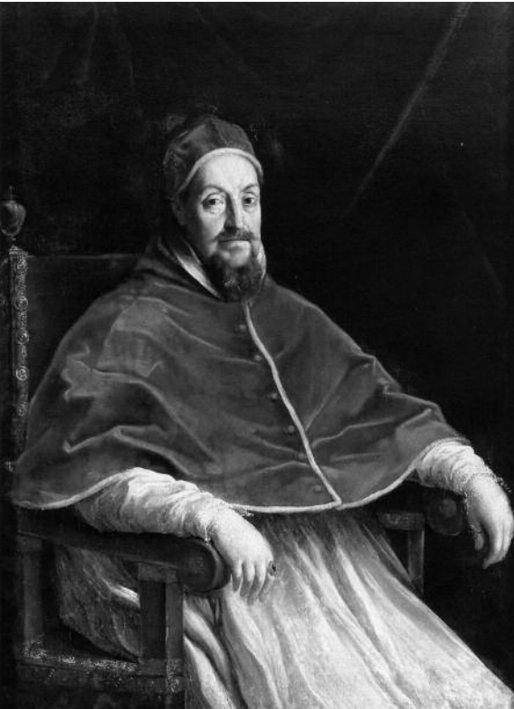
Abb. 4c (links unten) Guido Reni, Papst Gregor XV. Corsham Court, Methuen Collection [Storia dell'arte 157, 1, 2022, Fig. 3, S. 35]