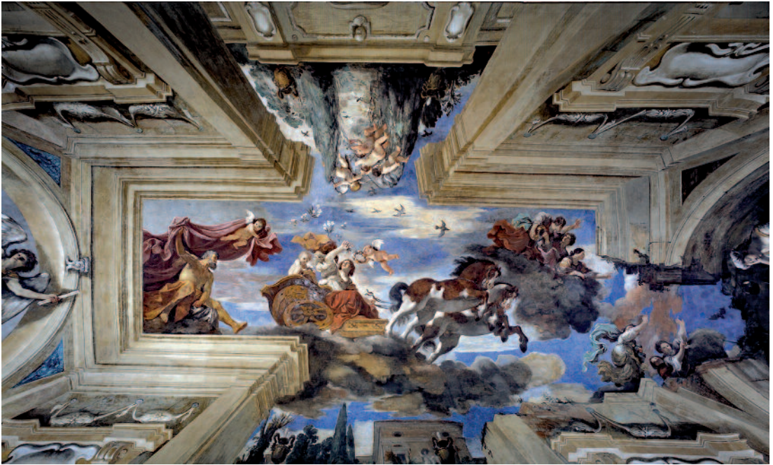
Abb. 2 Guercino, Aurora. Rom, Casino Ludovisi ( www.villa.ludovisi.org )

dem Hintergrund von Tassis häufigen Gefängnis-aufenthalt, zu denen sie einige aussagekräftige neue Archivfunde hinzufügen kann, ergeben sich auch neue Datierungen.