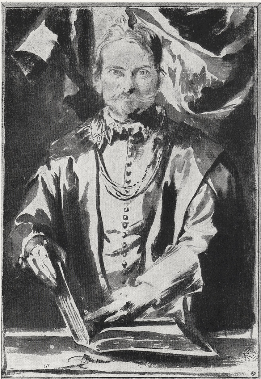
324 Abb. 4 Anton van Dyck: Porträt des Theodor van Thulden. Bister, laviert, über Kohle- Vorzeichnung. Paris, Cabinet des dessins du Musée du Louvre