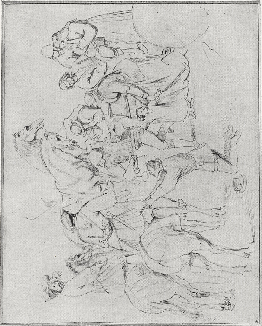
Abb. 1 Anton van Dyck: Gruppen aus der Darstellung des bethlehemitischen Kindermordes von Pieter Bruegel. Federzeichnung. Lille, Palais des Beaux-Arts, Slg. Wicar